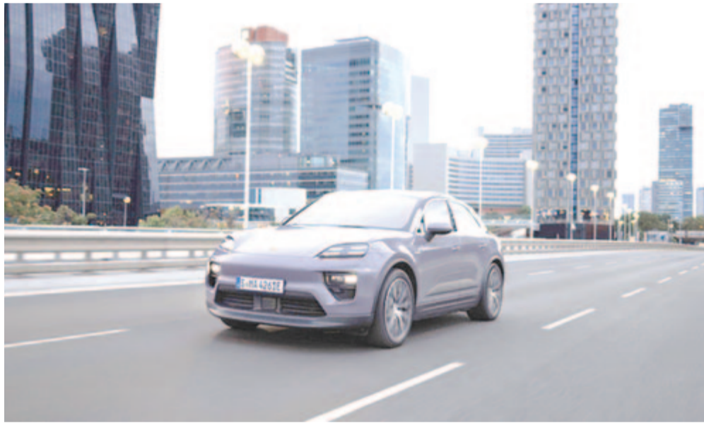
Elektromos Porsche Macan

Ezen túlmenően nagy változás nincs sem kívül, sem belül. Lényegében a Porsche beépítette az elektromos Macanba a mostani designelemeit, illetve – mivel nincs belső égésű motor – alacsonyabbra tette a motorházatetőt, ezzel pedig csökkentette a típus légellenállási együtthatóját, amely így 0,25, ami nagyon jó érték annak fényében, hogy egy kis SUV-ról beszélünk. Az új, elektromos Macan alapváltozata 80.450 dollárról indul, az erősebbért 106.950 dollárt kérnek el.