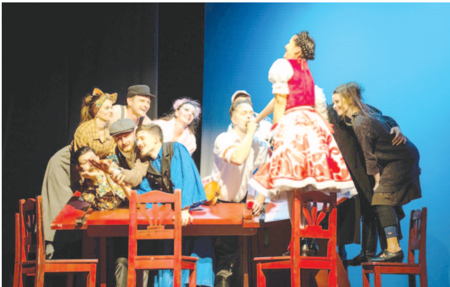
A bérletek bevezetésével több műfaj és több előadás kerül a színpadra