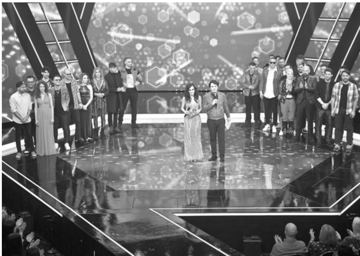
A Dal 2024 első válogató

A Dal 2024 szombatonként 20 óra 35 perctől látható a Dunán, ismétlés vasárnaponként 11 óra 30 perckor a Duna World csatornán. (MTI)