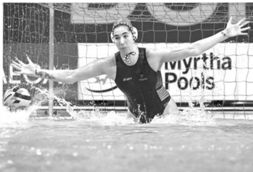
Magyar Alda véd

A magyar együttes biztosan éremért játszhat a viadalon, a mai elődöntőben (16.30 óra) a görög csapattal találkozik.