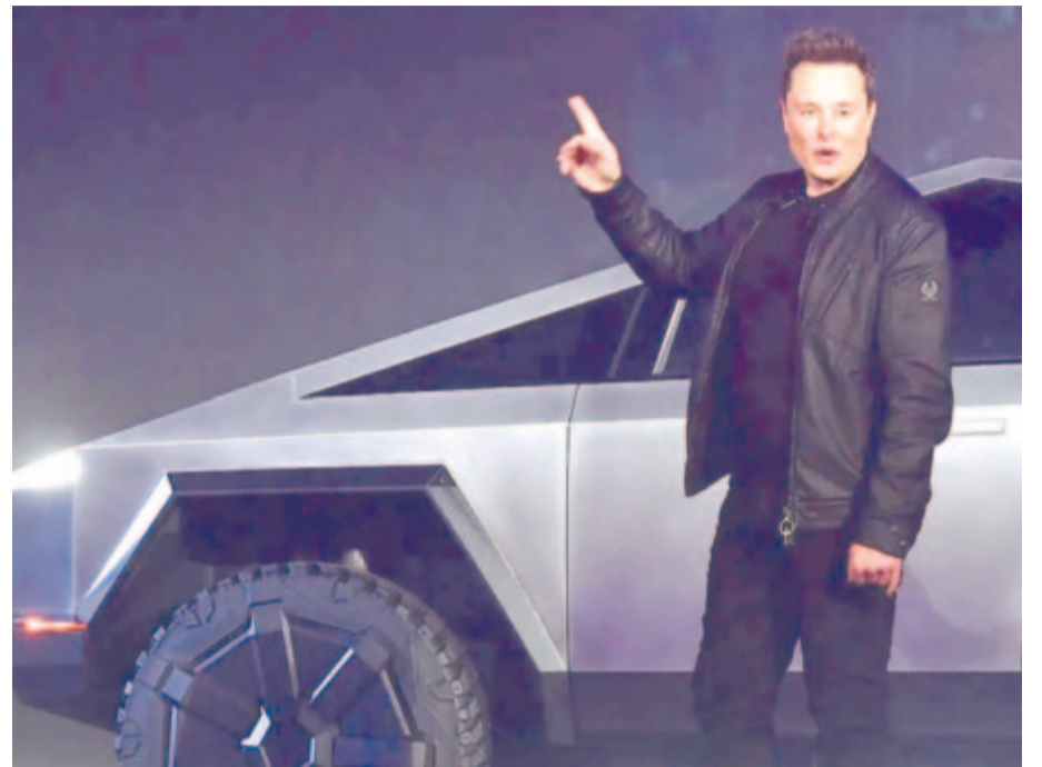
Elon Musk a Tesla Cybertruck bemutatóján, illusztráció