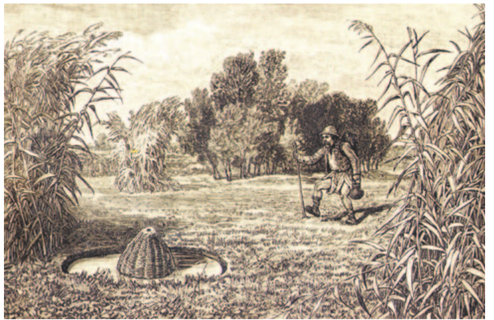
A csikász – Hermann Ottó – A magyar halászat könyve

„Az egykoron oly hatalmas népies halászati ág, a csikászat, ma általánosan leáldozófélben van, s aligha megéri a huszadik század első napjának virradatát” – írja Hermann Ottó 1887-ben A magyar halászat könyvében.