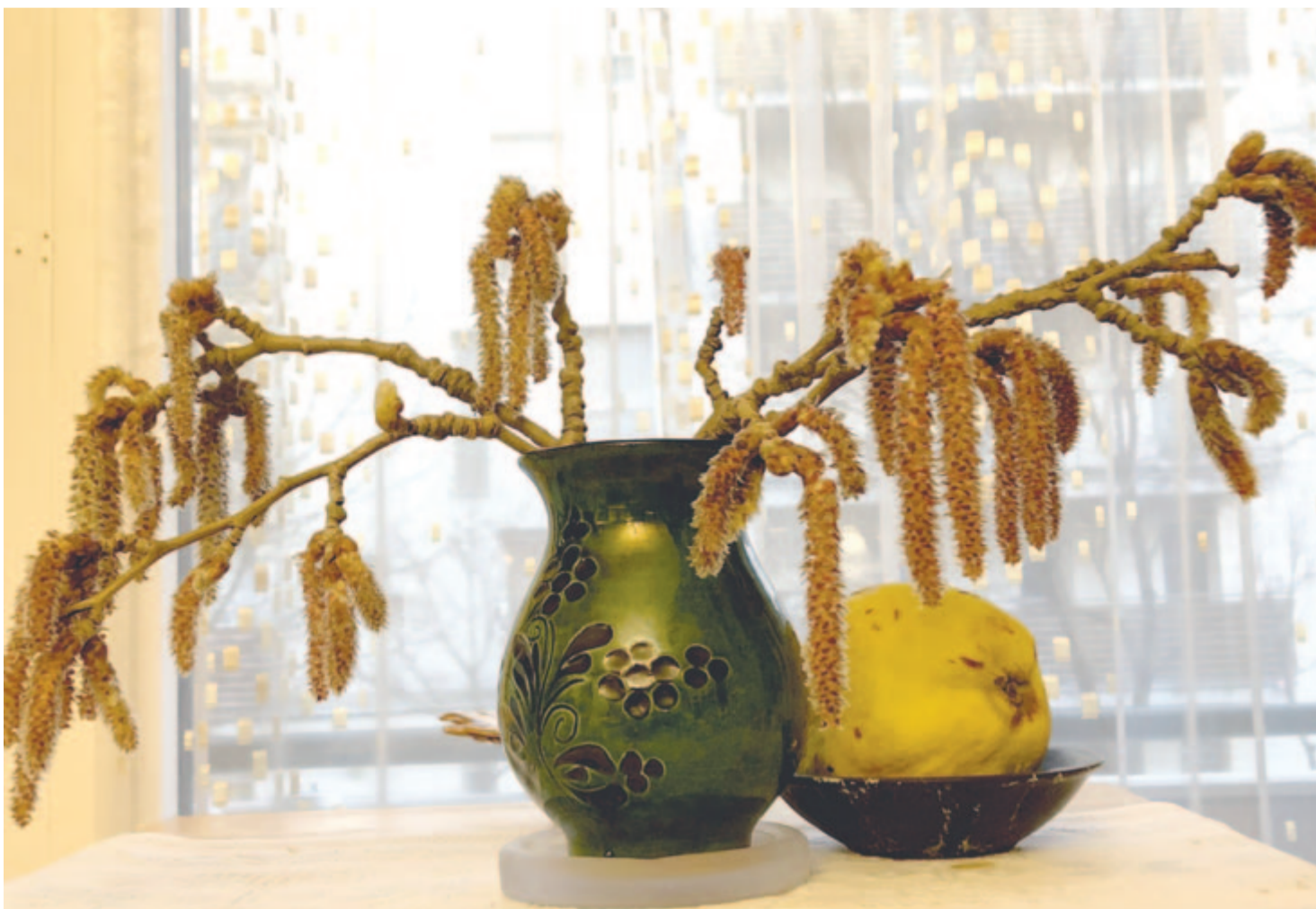
A duzzadó rügyű nyárfagally harmadnapra kibarkázik

Kelt 2024-ben, 249 évvel Bolyai Farkas születése után.