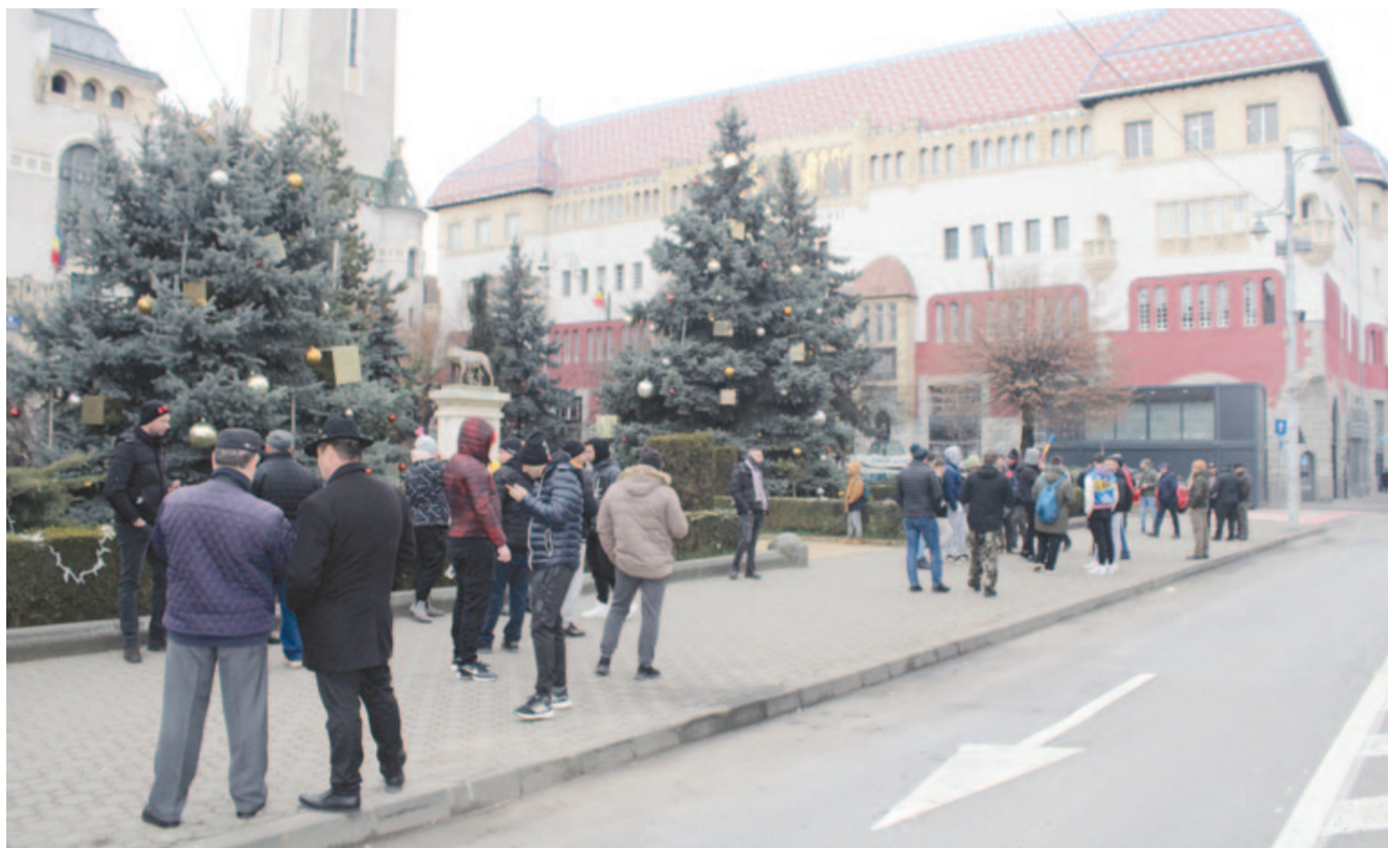
Gazdatüntetés Marosvásárhelyen 2024 januárjában