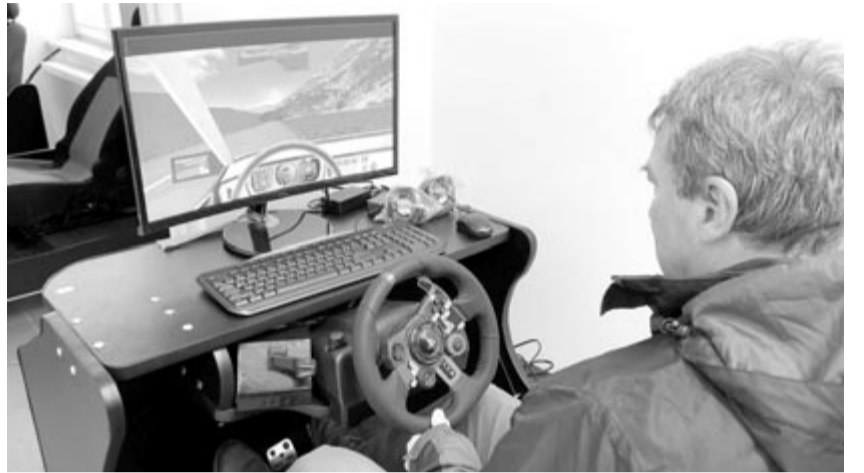
Felszerelték a hat szimulátort a műhelyben

A tanintézmények digitális felszerelését célzó projektnek öt része van, ebből kettőnek akkora az értéke, hogy megengedte a közvetlen közbeszerzést – nyilatkozta Tóth Sándor polgármester. Az első projektrész meg is valósult, ugyanis nemrég hat szimulációs eszközt szereztek be a Bocskai István elméleti liceum számára. Ezek segítségével a középiskolában működő automechanikai osztályok diákjai tanulhatják, gyakorolhatják a járművezetést. A projekt második „csomagja” tanfelszerelések beszerzését célozza, ebben az esetben is folyamatban van a közbeszerzés. Következik további három fejezet, amikor is tantermeket, informatikai szaktermekeket látnak el digitális eszközökkel és bútorzattal. A 4.177.000 lej értékű projekt nemcsak a középiskolát, hanem a Deák Farkas általános iskolában tanuló nyolcszáz diákot is érinti. A városvezető reméli, hogy a