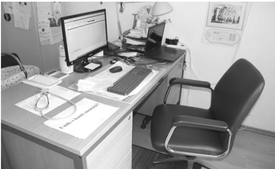
Orvosok nélkül marad a rendszer?