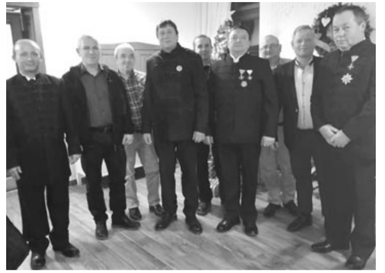
Múlt pénteken kiértékeltek az idei évet a rendtartomány tagjai.

A jövő évi terveket illetően szó esett a székelyabodi otthon épületének belső javításáról, az erdélyi Szent László-kultusz néhány helyszínének meglátogatásáról, és az is kiderült, hogy az erdélyi központi rendezvényt a következő