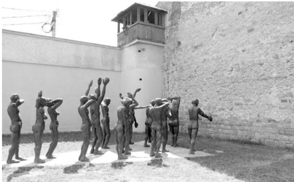
Emlékmű a máramarosszigeti börtön kivégzőfala előtt

Ma már tagadhatatlan tény, hogy a katonaság lőtt a lakosságba, és nem léteztek terroristák, hiszen utólag senkit ilyen váddal nem ítélték el. Több eset kapcsán beigazoló-dott, hogy az akkori felfokozott hangulatban, jól irányítottan, a hadsereg új hatalmat frissen (Ceaușescu elmenekülése után közvetlenül) átvevő felső vezetése kreálta a híreszteléseket, a diverziót, ami tragikus helyzeteket teremtett,