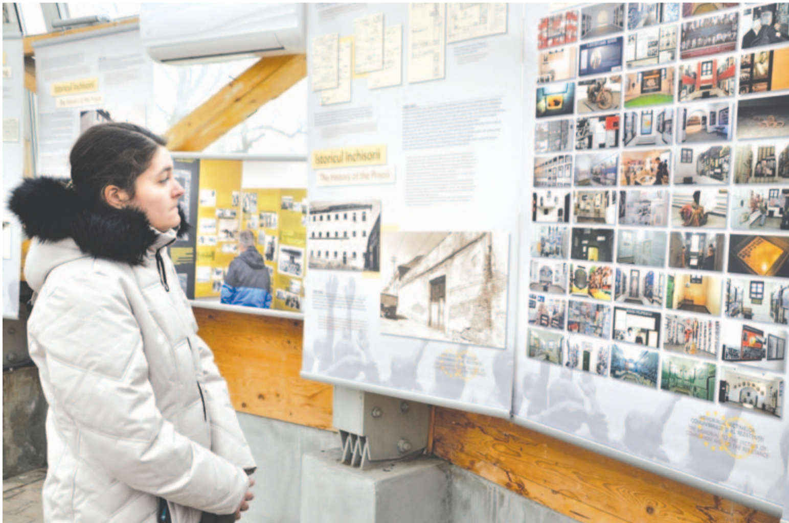
A marosvásárhelyi várban nemrég nyílt, a máramaroszigeti börtönmúzeumról összeállított tárlat