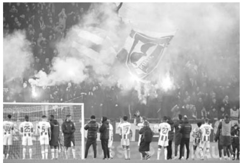
A Ferencváros játékosai és szurkolói ünnepelnek, miután a csapat 1-1-es döntetlent játszott a Fiorentina ellen a labdarúgó Európa-konferencialiga csoportkörének hatodik, utolsó fordulójában játszott mérkőzésen a Groupama Arénában 2023. december 14-én. A Ferencváros második helyen jutott tovább a csoportból.