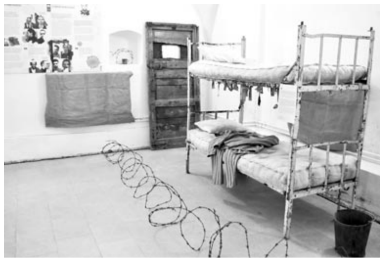
A pitești-i börtönről rendezett emlékkiállítás Nagyszebenben

Az 1989-es eseményeket a katonai ügyészség vizsgálta ki, jóval az események után. A vitatott ügyészségi adatgyűjtés évekig elhúzódott, és leginkább azt a célt szolgálta, hogy bizonyos tényeket elkendőzzenek, mintsem feltárjanak. Sokáig hozzá sem lehetett férni az adatokhoz. Több mint két évtizeddel az események után újságírói minőségben kértem engedélyt a katonai ügyészségtől, hogy tanulmányozhassam a marosvásárhelyi események dossziéját, és kiterő hivatalos válasszal elutasítottak. Az alig néhány éve – a forradalmárok szervezetének köszönhetően – kezembe került ügyészségi vádiratban az áll, hogy a jelenlegi Győzelem téri sor-tűz úgy dördült el, hogy „kiakadt a harckocsi puskacsövének támasztója”, s így nem a levegőbe, hanem az emberek felé irányultak a go-