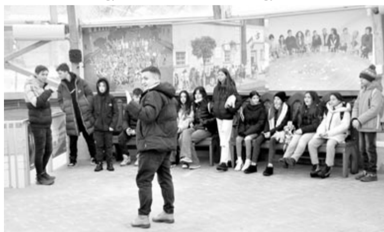
Az új nemzedék tagjai ismerkednek a közelmúlttal a máramarosszigeti börtönről szóló marosvásárhelyi kiállításon

Lehet, hogy túl közel van a jelenhez e korszak ahhoz, hogy történelmi relikviává váljon a hagyatéka, vagy továbbra is érdeke az 1989 utáni (háttér)hatalmat átvevőknek, hogy az akkor történtek