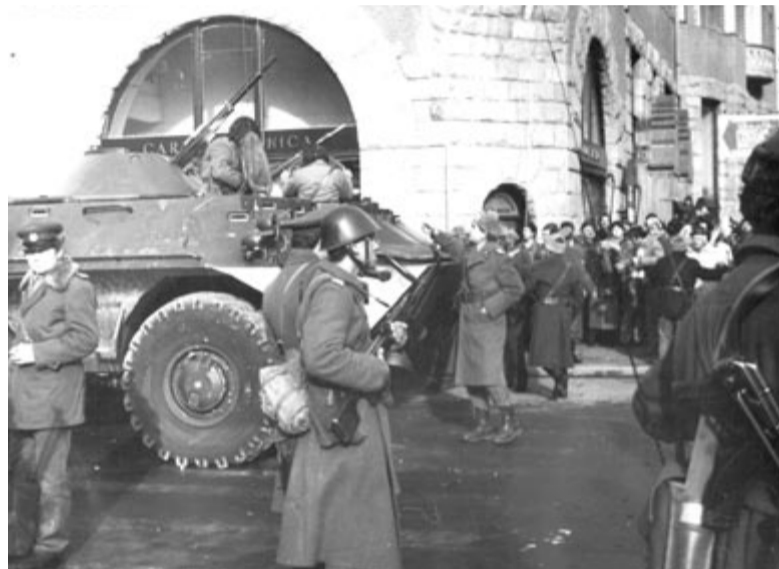
Védelmi állásban az egykori pártszékház előtt – 1989. december 22-én

részletei homályban maradjanak? Emlékeznünk kell, hogy tanuljunk a múlt tévedéseiből, mert szükségünk van intő jelekre. A pandémiát követő – orosz–ukrán háború által is gerjesztett – gazdasági és társadalmi válság (lásd migránsok) okozta bizonytalanság, az EU-szkepticizmus felerősítette kontinensünkön azt a politikai irányzatot, amely szélsőséges megoldásokat kínál a gondok rendezésére akár bizonyos (szabadság-) jogok csorbításával, a közvélemény – most már leginkább online – manipulálásával. Na ugye, hogy ismerős a recept? Az a nemzet, amely nem tisztázza a múltat, nem érdemli a jelent – talán ezért lenne jó végre tisztázni, hogy ki lőtt ránk 1989 decemberében. Ameddig nem sülyedünk újra jól irányított, közös annéziába.