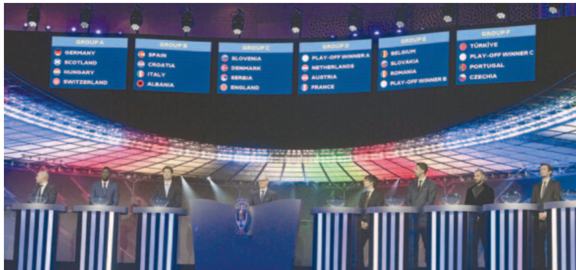
A 2024-es németországi labdarúgó-Európa-bajnokság csoportosorsolása a hamburgi Elbphilharmonie épületében 2023. december 2-án

Továbbjutna az Eb-csoportkörből a román válogatott – a hamburgi sorsolás után nyilatkozta ezt a csapat szakvezetője. Edward Iordănescu úgy fogalmazott: már bizonyították, hogy jó munkával kiváló eredményekre képesek, ezért az a cél, hogy bejussanak az egyenes kieséses szakaszba. Az edző szerint nem lesz könnyű dolguk, függetlenül attól, hogy melyik lesz a negyedik csapat, amely a pótselejtezőből kivívja a részvétel jogát, és csatlakozik az E csoport mezőnyéhez. „Ez az Európa-bajnokság, valamennyi együttes, amely kijutott a döntő tornára, remek játékerőt képvisel” – idézte a szakvezető nyilatkozatát a román sportági szövetség honlapja.