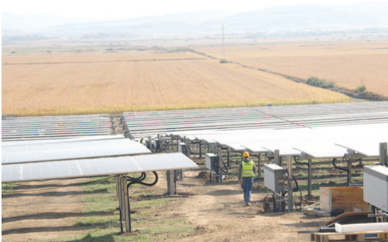
A felvétel illusztráció