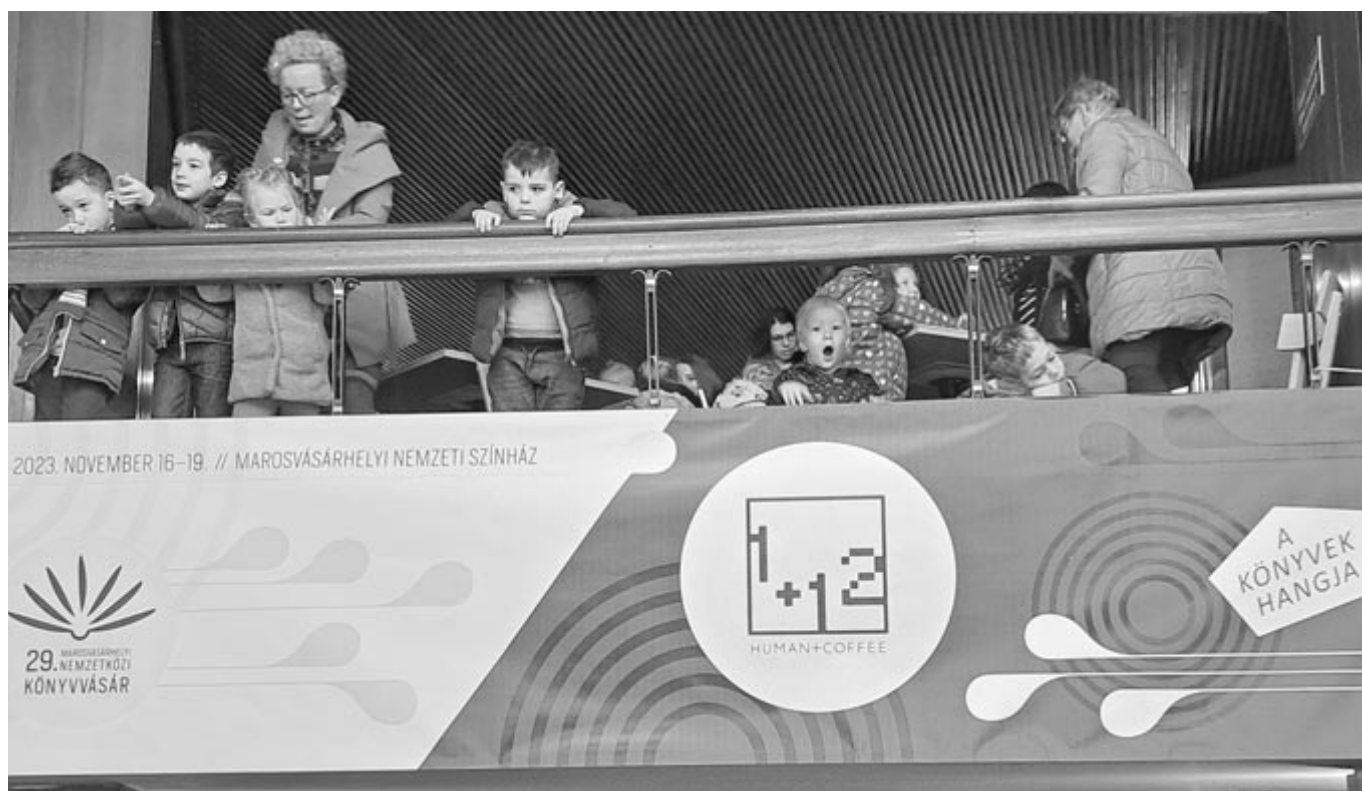
Mindenki másképp csinálja... A legkisebbek a koncertkezdésre várnak a könyvvásár első reggelén

Sóvárad fölött, a Kerekhegyen. De mondhatnám Endrebércét, vagy Szénégetőt. Mondhatnám a Cserét, Virgót, Szénamezőt. De Sóvárad fölött mindenképpen. Ahonnan látható a Mezőhavas. Vagy a Küküllő völgye Makfálváig. Valahol ott. Valamikor akkor. Sovány tehenek előtt a barázdában. Döglegyek dongásában. Valahol ott, valamikor akkor. Vagy a pohárderekű boglyák taposása közben. Kukoricások szablyái között. Vagy amikor szénásszekér-költemények ereszkednek alá a római-kori úton szombati-esti harangszó karjaiba. Valahol ott. És valamikor akkor. Elsuhogó évek. Ősök, telek. Némaságok, tavaszok, nyarak.