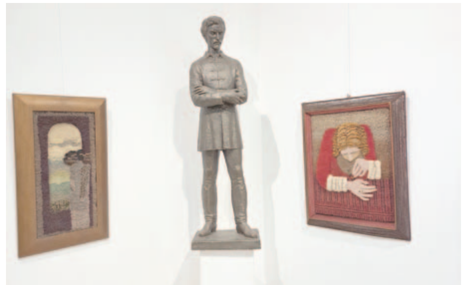
A jubileumi tárlat egy részlete a Bernády Házban