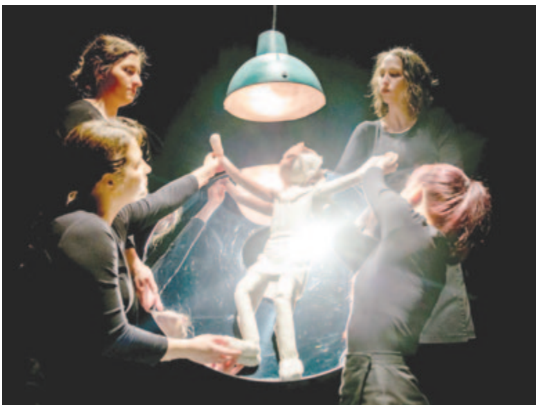
Jelenet az előadásból

Az Árvácska – átváltozásokban gazdag színpadi játékkal, zene- és látványvilágának líraiságával – számomra a hosszú életű színházi elemények közé tartozik. Egy intő jel, hótiszta üzenet, maga a születés pillanatában felsíró lelkiismeret.