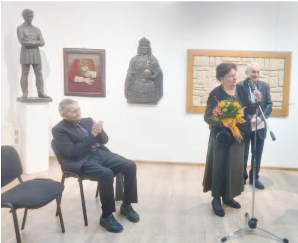
Ünnepi tárlatnyitó a derű jegyében

A tíz évvel ezelőtt írtak lényege nem változott, az elemző értékeléshez fűzött adatok számszerűségükben módosultak, hiszen az utóbbi évtizedben is számos újabb Hunyadi-alkotást avattak, idén tavasszal például a szlovéniai Kranjban egy Petőfi-mellszobrot. A marosvásárhelyi Bernády Házban a művész 90. születésnapjára feleségével, Hunyadi Mária textilművésszel közösen rendezett kiállításon is jelen van a nemzet 200 esztendeje világra jött költője, Petőfi ugyanis a szobrásznak is egyik meghatározó példaképe. De ez a kamarakiállítás, amely egy később rendezendő nagyszabású retrospektív tárlat előtt jubileumi főhajtás kíván lenni, az életműnek nyilván csak kis hányadát képes felsorakoztatni. Mindaz azonban, ami Hunyadi László plasztikai univerzumára jellemző, jól érzékelhető e szűkített válogatás által is. A magyarság nagyjai, a megörökített személyiségek, például Szent István, Petőfi Sándor, Orbán Balázs, Tamási Áron, Apor Vilmos, Kemény János, George Enescu szobra, portréja, valamint a hajdúhadházi Múza, a rusztikus képzetű lányt vagy a groteszken modern fogantatású Horgász, illetve az ötvös Hunyadi megidéző művek méltóképpen képviselik e humánus értékekben bővelkedő életmű kvalitásait. És az alkotó erejéit is, aki (ismételten Sütő szavaival) „történelmi tarvágas után újból szálfanövekedést juttat eszünkbe, erdélyi magyarok drámai exodusában a szülőföld marasztaló vigaszát is jelzi”.