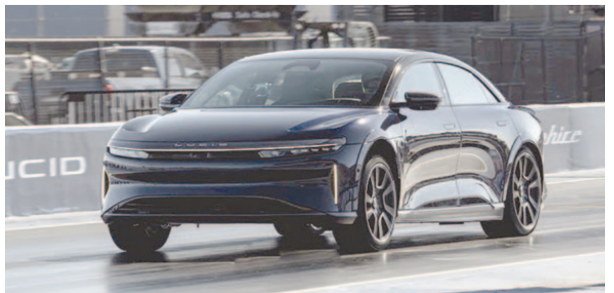
Lucid Air Sapphire

Lucid Air Sapphire az Egyesült Államokban „csak” 250.000 dollár, miközben egy Bugatti Chiron 3 millió körül mozog. De akár Romániában is lehet számtalan, a csúcselektromos autónál drágább járművet látni az utakon. Vagyis ezek előbb-utóbb mindenhol meg fognak jelenni, sokan meg fogják vásárolni, és ki kell mondani: egy ilyen autó egy felelőtlen sofőr kezében hatalmas veszélyt jelent. Ezért is lenne szükség célzott oktatásra, hogy csökkenjen a balesetkockázat.