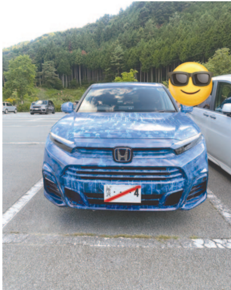
Honda CR-V hidrogén hajtással

tében egyre nagyobb hangsúly kerül az elektrifikációra. A nagy autógyártók sorra jelentik be az újabb és újabb villanymodelleket, ezzel párhuzamosan pedig a hagyományos,