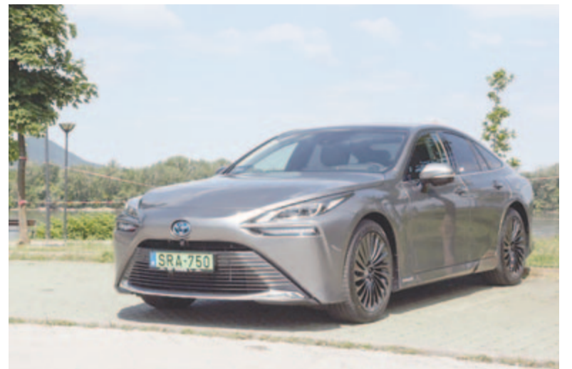
Toyota Mirai, második generáció

Azonban hiába a nagyon alacsony eladás, a Toyota nem mond le az üzemanyagcellás tervéről, csupán változtat rajta egy keveset. A jövőben ugyanis nem a személyautókba tervezi ezt a hajtásláncot, hanem a haszonjárművekbe, főként azokba, amelyek két helyszín között közlekednek. Ha egy bizonyos helyen specifikusan meg lehetne