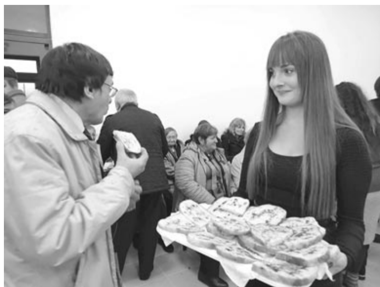
Nyáradszentmártonban nem maradt el a libasziros kenyér