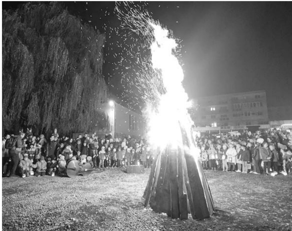
Szovátán ismét Márton-napi tüzet gyújtottak