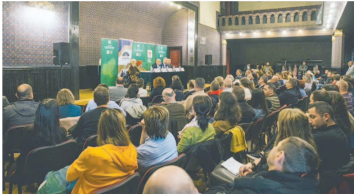
Az eseményen részt vevő vállalkozók, akiket mind érint a kormány döntése