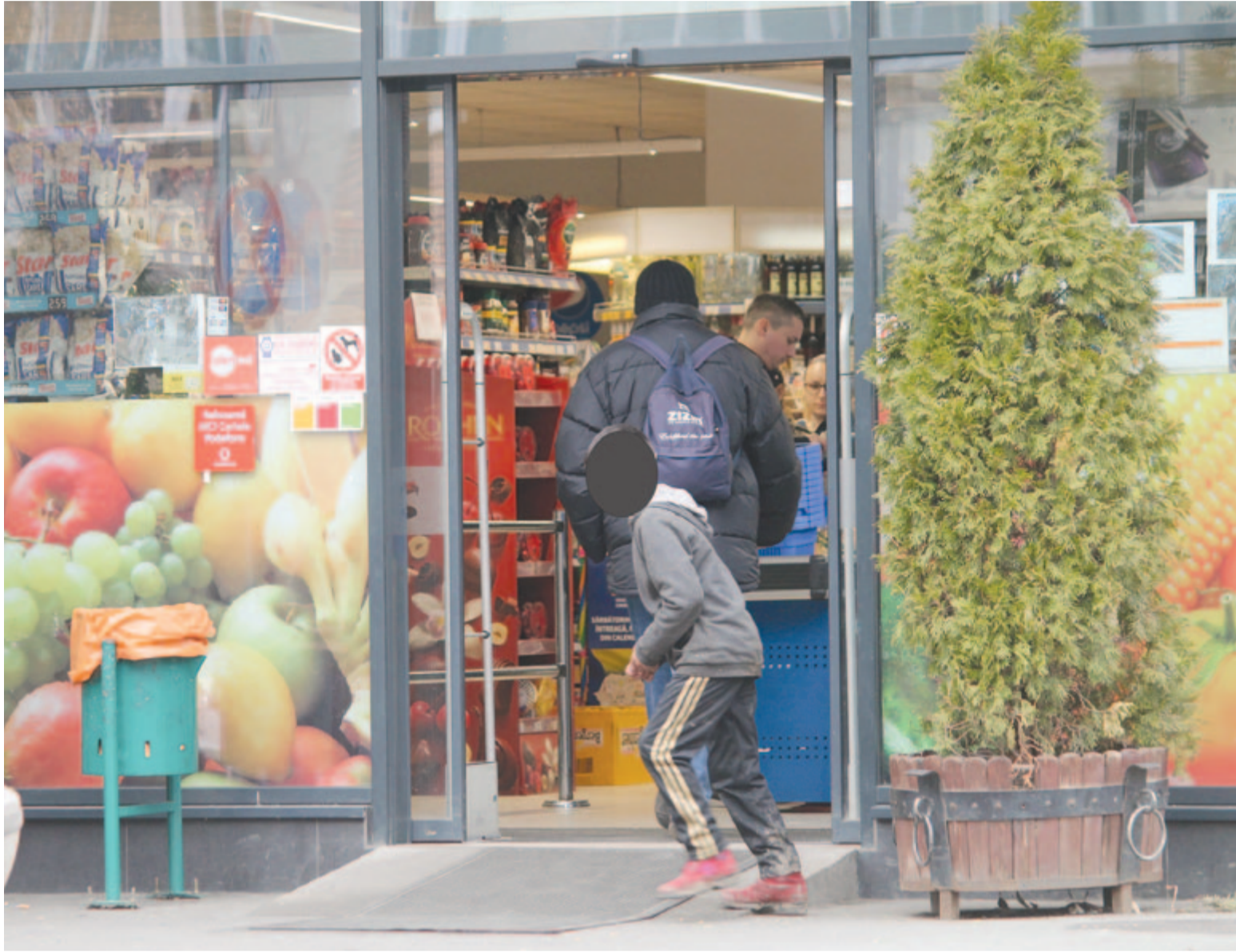
A felvétel illusztráció