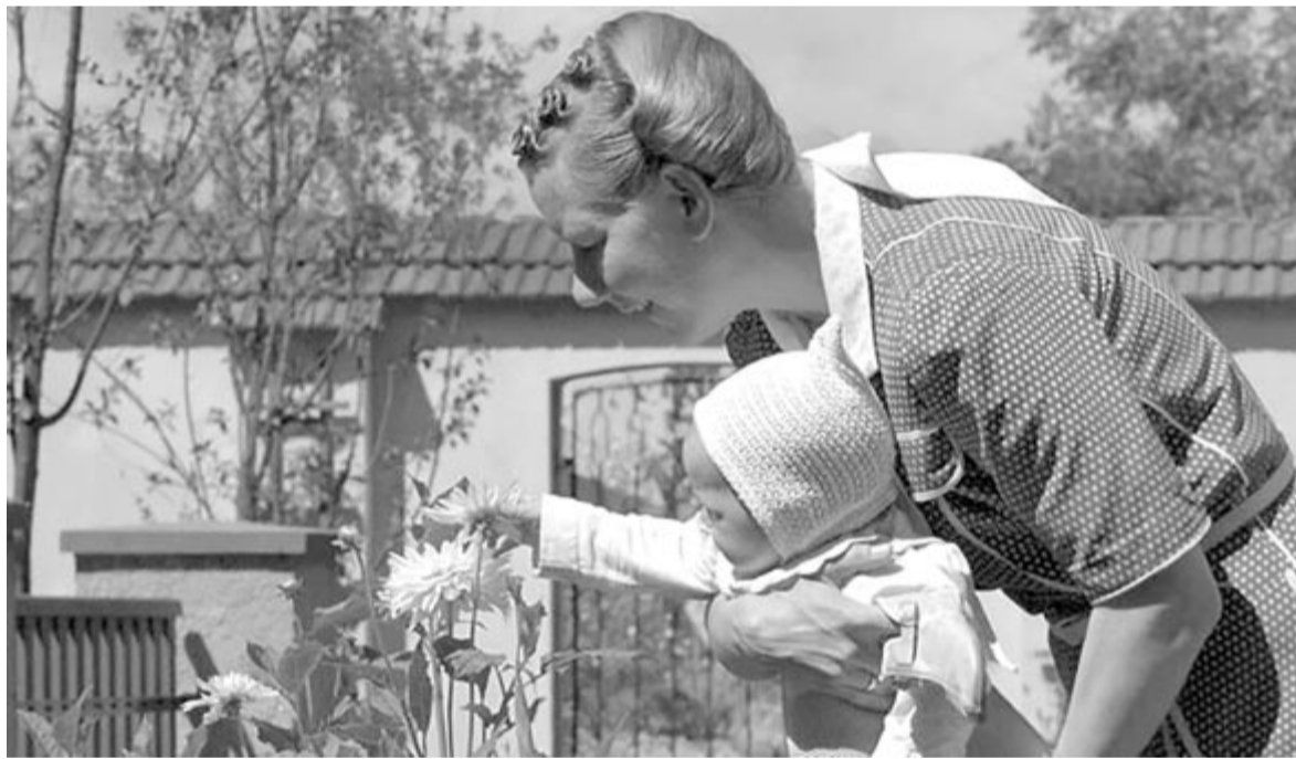
Zone of Interest

Az Európai Filmdíj jelöléseiről a 4600 fős filmakadémia tagsága döntött. Az Európai Filmdíjakat idén december 9-én adják át Berlinben.