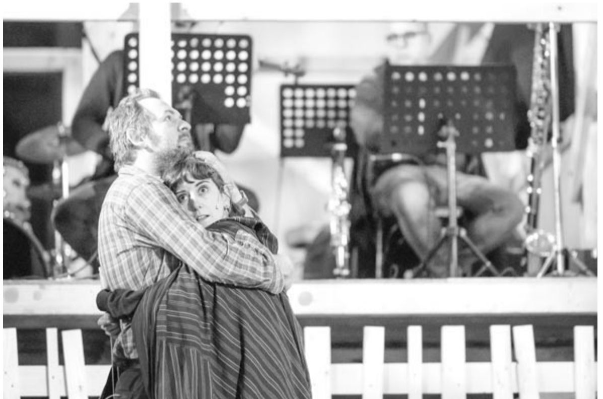
Az igazság gyertyái