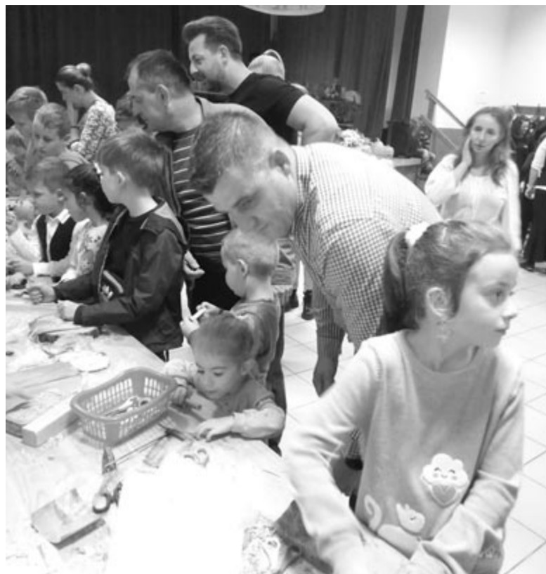
Apukák is segítenek

Elsősorban a fiúk körében nagy sikere volt a kukoricafejtésnek, ki