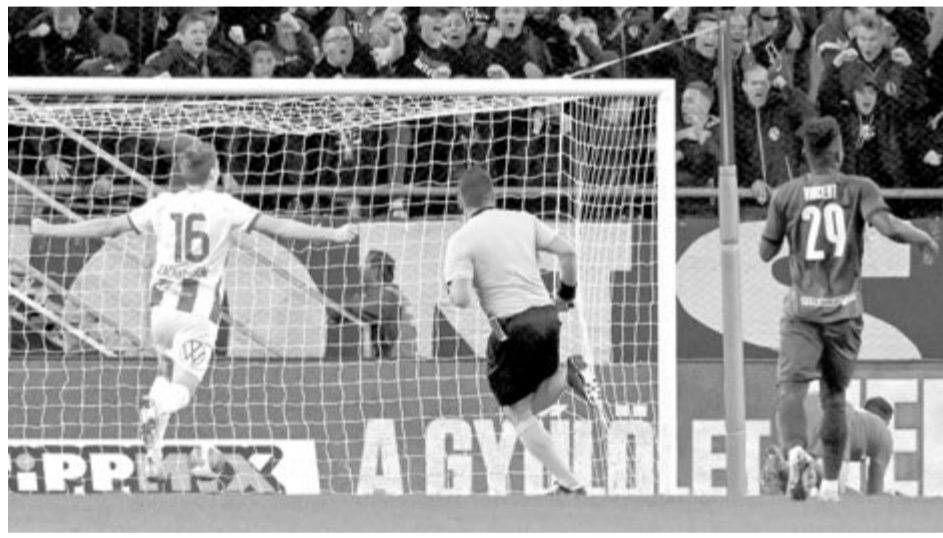
Ferencvárosi gól az Újpest FC elleni mérkőzésen

A hajrára érhetően hitehagyottá vált az Újpest, a Ferencváros pedig már nem erőltette a támadásokat, így az eredmény nem változott.