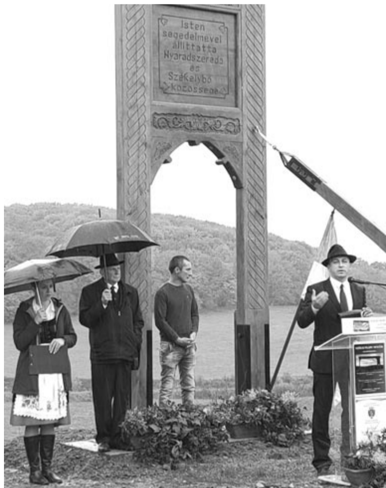
Nem félünk vállalni identitásunkat, hangzott el az ünnepségen