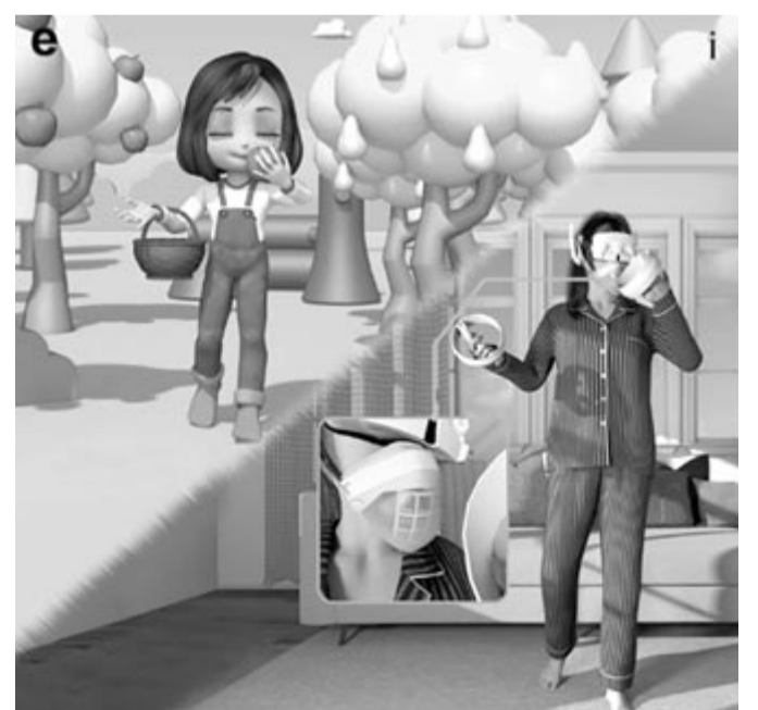
Illatok a virtuális valóságban

Természetesen a Huawei megoldása teljesen más, itt a rendszer egy kimondottan korszerűnek, divatosnak számító hajlítható telefonba van beépítve, amely már a technológiai újdonsága miatt vonzó lehet a vásárlók számára. Persze, ez még csak egy terv, egyáltalán nem biztos, hogy valóban el is készül a típus, ha pedig elkészül, akkor továbbra is probléma, hogy nincs Google-támogatás, ami miatt számos potenciális vásárló fogja meggondolni magát, legalábbis a nyugati országokban. Kérdéses, hogy a modell mennyire lesz kelendő Ázsiában. Abban mindenki biztos lehet, hogy egy ilyen készülék nem fog az olcsók közé tartozni, már csak azért sem, mert a Huawei korábbi hajlítható okostelefonja, az XS köröket vert árban az akkor aktuális Samsung Galaxy Foldra is, amely szintén nem az olcsóságáról híres.