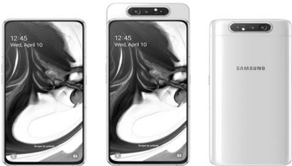
Samsung Galaxy A80, megfordítható kamerával