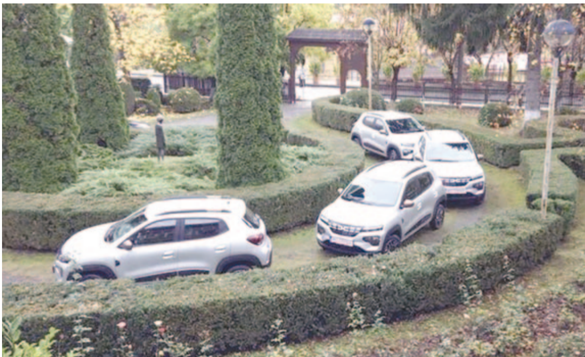
Megérkezett a négy elektromos autó az önkormányzathoz

költségvetését. „Az idei évben világszerte olyan megszorító intézkedések voltak az energiaiparban, amelyek a környezetbarátabb megoldások felé terelték a társadalmat, úgy látjuk, hogy ez az út, amely elengedhetetlen a jövő fenntartható fejlődéséhez” – áll a városháza közleményében. (grl)