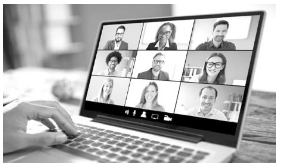
Zoom Meeting, illusztráció

A tervek szerint a funkció 2024 tavaszán lesz majd általánosan elérhető. Arról egyelőre nem szól a fáma, hogy az ingyenes, 40 perces beszélgetéseket biztosító részben is elérhető lesz, vagy csak a fizetős változatban, vagy esetleg lesz-e a Zoom Docsnak valamilyen külön díja. A vállalat alapítója és vezérigazgatója, Eric Yuan úgy nyilatkozott az amerikai Forbes magazinnak, hogy nem várja el, hogy a Zoom Docs leváltson más jegyzetkészítő szoftvert, viszont reméli, hogy egy jól használható alternatívát fog kínálni az értekezletek során.