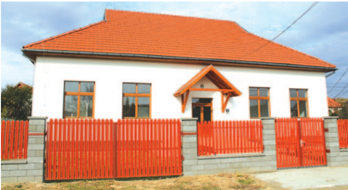
A felújított művelődési ház