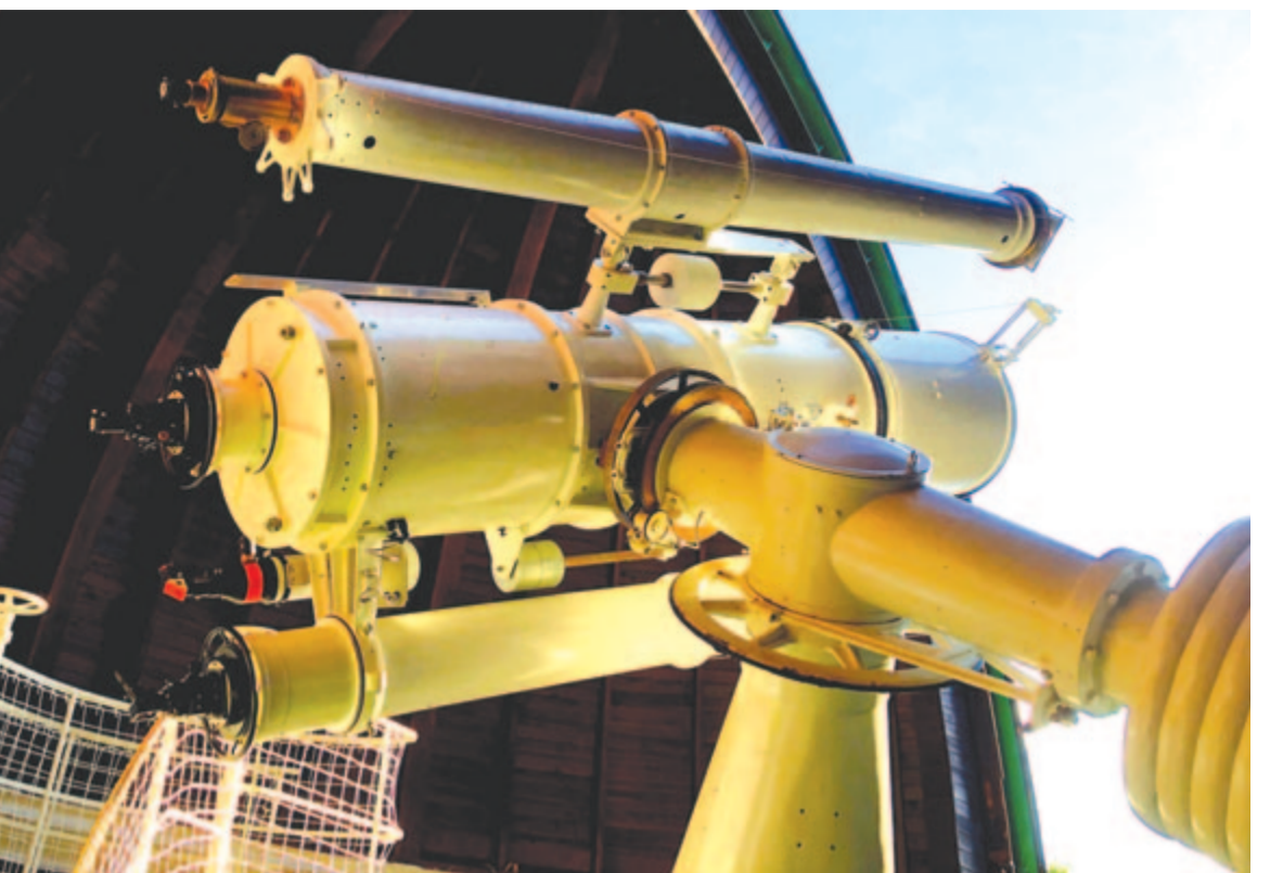
Égre nyílik a Svábhegyi Csillagvizsgáló nagykupolája

A magyar kormány a nehéz gazdasági helyzet ellenére támogatja ezt a hosszú távú programot, lehetővé téve a jövőbeli megelőző orvoslás alapjainak lerakását. Az egész világon elsőként Magyarországon!