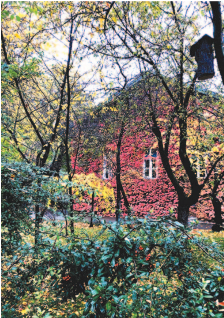
Ráborul a házra október vérpiros szívével