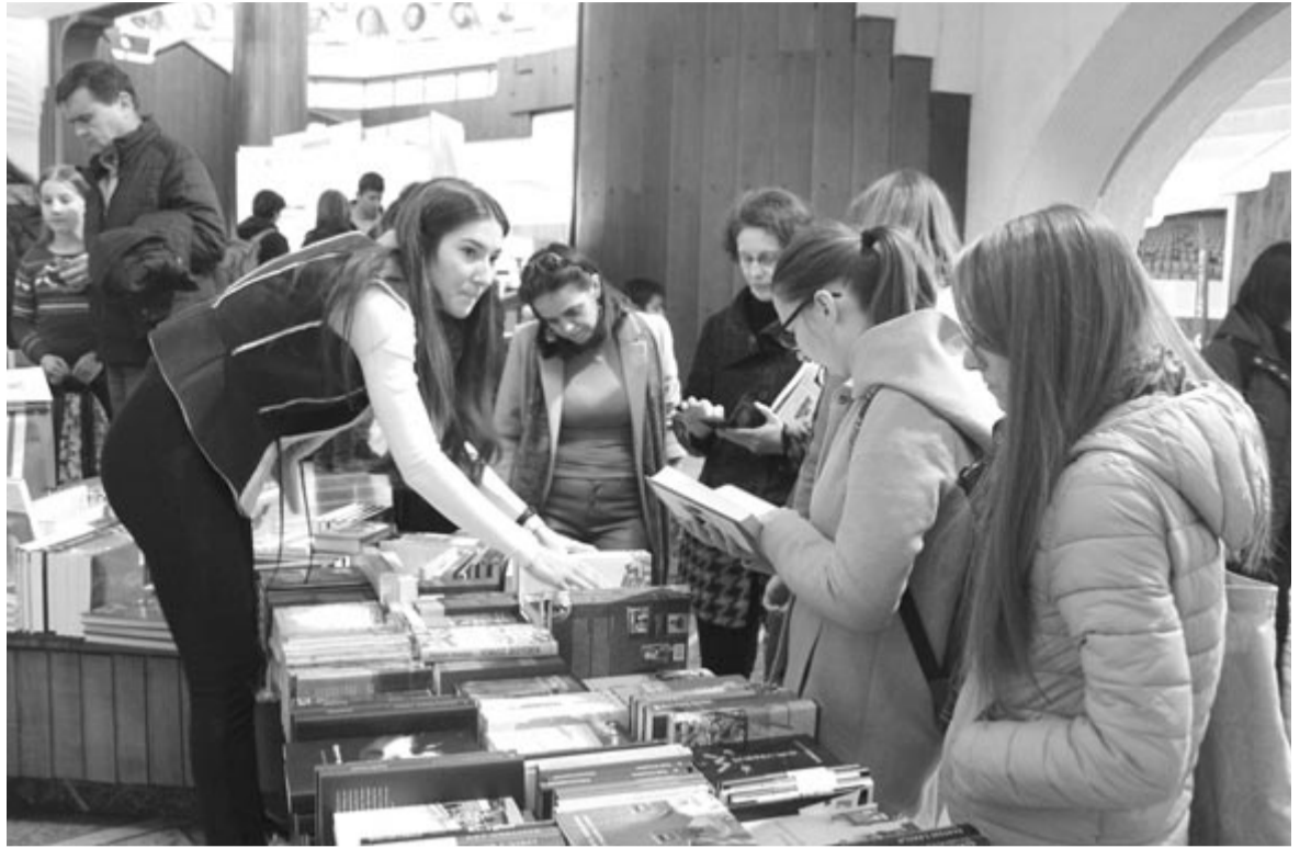
Marosvásárhelyi Nemzetközi Könyvvásár, 2022-ben

A könyvünnep kiegészítő programjai egytől egyig a könyvek hangja mottóra rezonálnak. Az idei Bánffy Miklós-évforduló előtt a Király István rendezte Naplegenda című felolvasó-színházi előadással tisztelegnek a szervezők, ezt csütörtökön lehet majd meghallgatni. A szemle nulladik napján, 15-én, szerdán Székely Csaba Az igazság gyertyái című, a bözödújfalusi székely zsidók abszurd történetéről szóló darabjának bemutatójára kerül sor Sebestyén Aba rendezésében, ezt