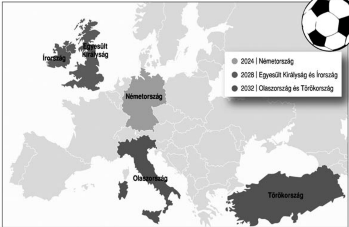
A következő labdarúgó-Európa-bajnokságok rendezői

Magyar szempontból még a holland, horvát, spanyol, olasz, dán, portugál, belga hetes szereplése érdekes, ugyanis ebből legalább négy válogatottnak egyenes úton ki kell jutnia a kontinensviadalra ahhoz, hogy Marco Rossi csapata pótszelejtezőn javíthasson sikertelen kvalifikáció esetén. A felsorolt válogatottak közül jelenleg csupán a holland nem áll kijutó helyen, de egy találkozóval kevesebbet játszott, mint riválisai, mivel a júniusi játéknapokon a Nemzetek