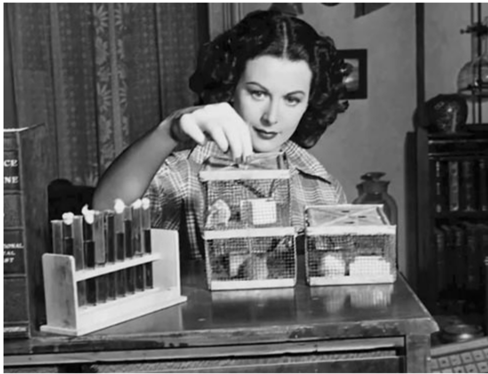
Hedy Lamarr saját laboratóriumában

Hedy Lamarr, az egykori Hedwig Eva Maria Kiesler 2000-ben hunyt el floridai otthonában. Bár ötlete kétségkívül jelentős a technika történetében, mégis szépsége által a filmjeiből vált híressé és ismertté.