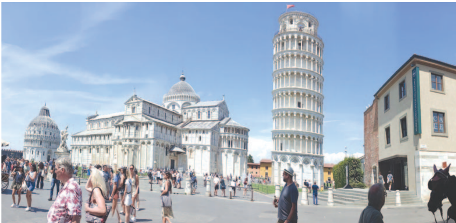
Panoramafelvétel a pisai Dóm térről