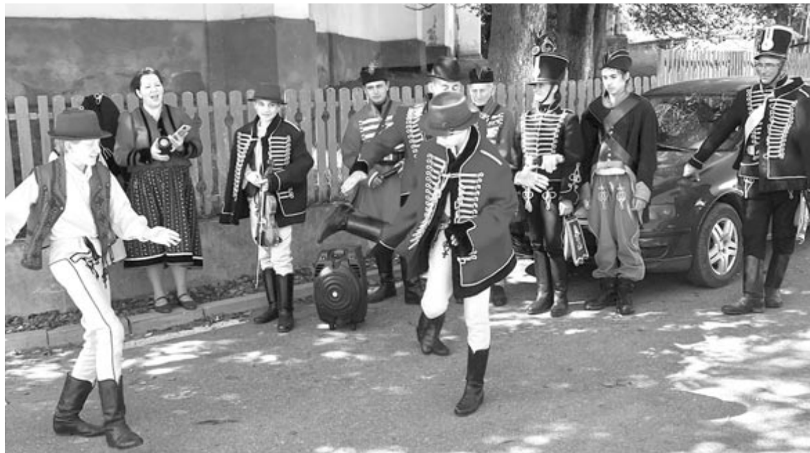
Toborzótánc Makfalva központjában – így válogatták hajdan is a nemzetőröknek való legényeket