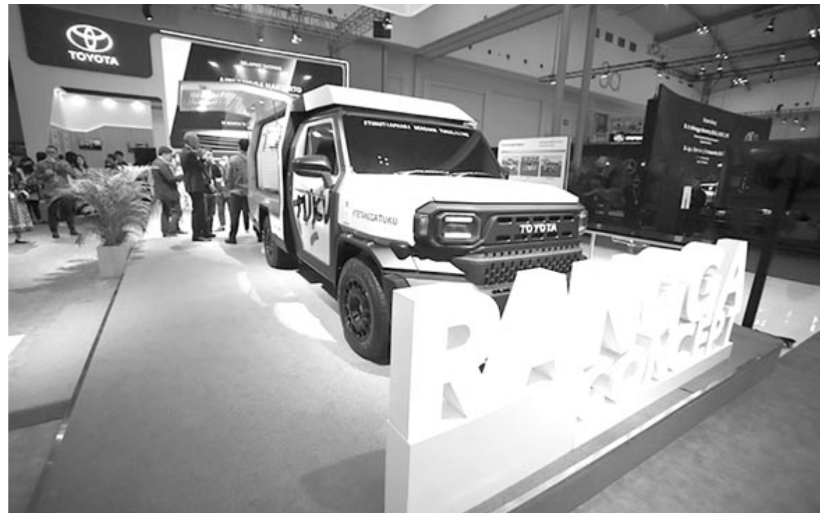
A Toyota Rangga Concept az indonéziái bemutatón