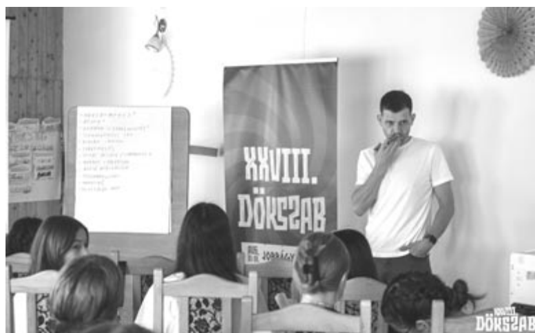
Ismert hazai és magyarországi személyeket hívtak meg előadásokat tartani

A tábor másik célja az volt, hogy összekovácsolja a résztvevőket, és egy jó diákközösséget alakítson ki. A tábor nagy előnye, hogy az ország minden pontjáról érkező középiszkolások kis- és nagycsoportokban dolgozva megismerik egymást, így ha valakinek az ország bármely részén segítségre van szüksége, lesz akihez fordulnia, és nemcsak középiszkolás korában, hanem a későbbiekben is.