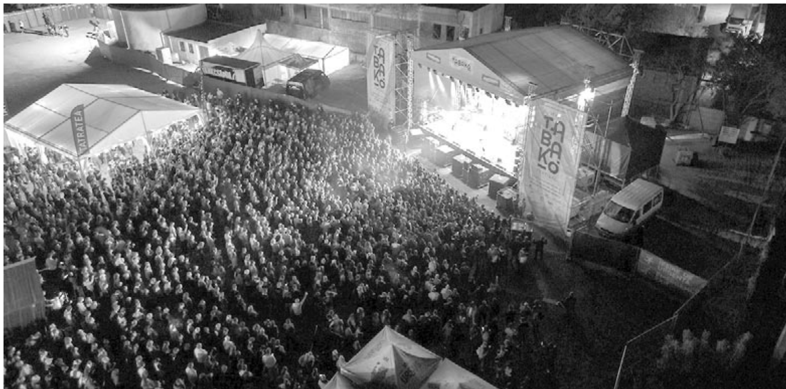
Bulizó tömeg a Sepsi Tabakó fesztiválon