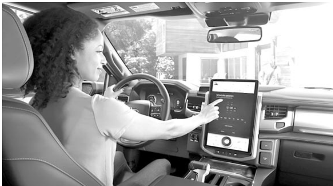
Ford szoftveres szolgáltatások, illusztráció

adata elnökhelyettesként. A Ford tisztában van vele, hogy a szórakoztató és kényelmi rendszerek rohamléptekben fejlődnek, és éppen ezért kellett neki egy olyan ember, aki a techiparból jött, és képes lépést tartani a technológiai robbanás-