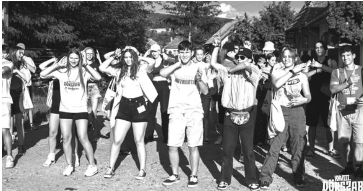
Kéves volt a szabadidő, így minden feladattól mókát is lehetett csinálni