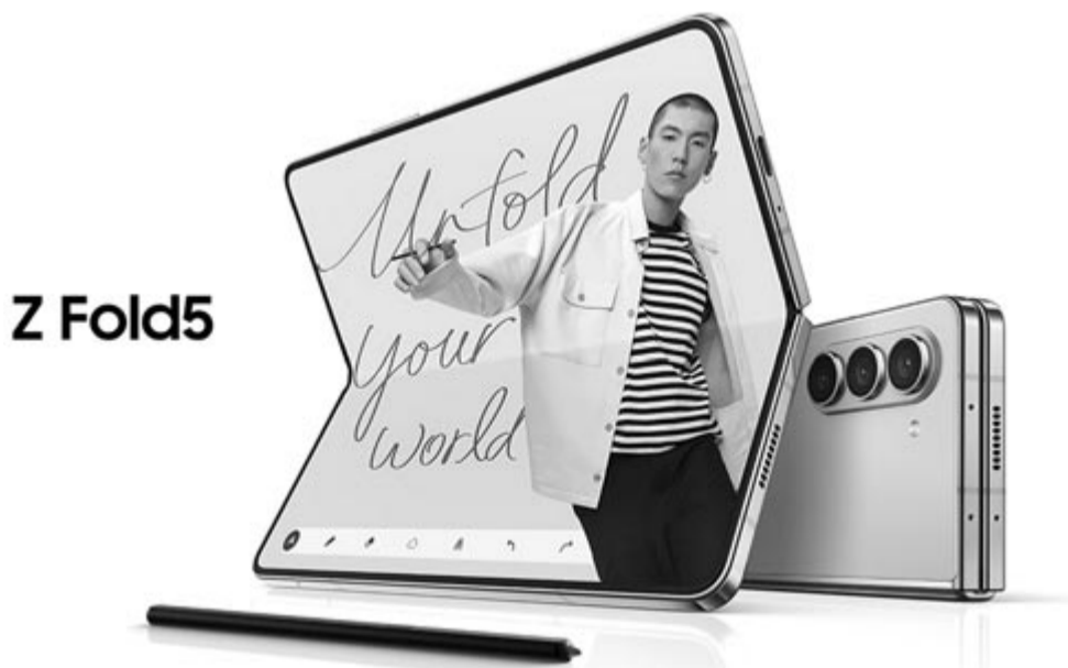
Samsung Galaxy Z Fold 5