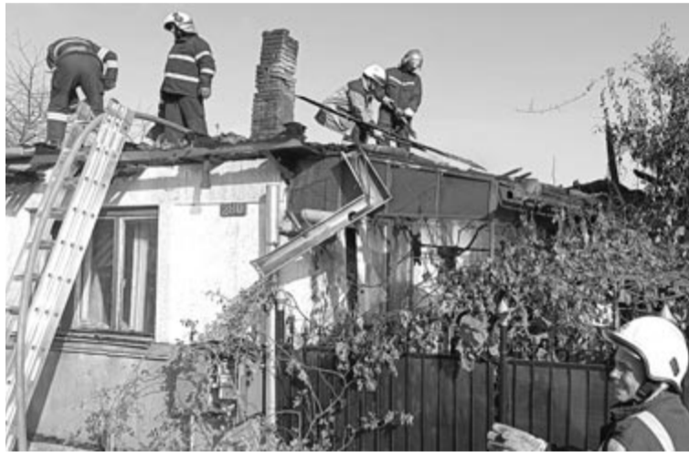
A tetőzet teljesen elpusztult, az épület erősen károsult, kiégett