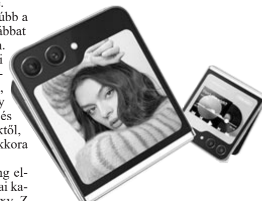
Samsung Galaxy Z Flip 5

Összegezve: a tavalyi iPhone-ok – 14-es széria, az idei 15-ös szériáról még nincsenek DxOMark-adatok – kamerateljesítményét távolról sem képesek megugrani a divatos, új, hajlítható Samsungok. A korrektség miatt viszont hozzá kell tenni azt, hogy bár kamerában jobb az almás márka, neki nincs hajlítható telefonja, amivel mostanra a legtöbb nagyobb gyártó már rendelkezik. Nem tudni, hogy mekkora igény lenne egy hajlítható iPhone-ra, viszont az tagadhatatlan, hogy az Apple adós vele. Bár folynak a tesztelek, ennek megvalósítása érdekében még távol lehet a sorozatgyártásba küldhető változat. Egyelőre az Apple és a hozzá közeli források sem ígérnek semmit. Azt viszont mi garantálhatjuk, hogy ha egyszer elkészül, akkor egyvalami biztosan nem lesz: olcsó!