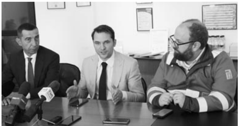
Balról jobbra: Ciprian Dobre prefektus, Sebastian-Ioan Burduja miniszter és Josh Zacharias vezérigazgató

A miniszter hozzátette, látogatása nem véletlen, hiszen 1963. szeptember 21-én helyezték üzembe az akkor napi 800 megawatt energiát termelő egységet. Nemrég transzformátor-állomást cseréltek. Jelenleg csak az egyik turbina üzemel, az itt dolgozók emberfeletti erőfeszítésére kerül a működtetése. A Duro Felguera cég jelenleg 100 embert foglalkoztat az építőtelenen, és jól haladnak a munkával, a jogi nézeteltéréseket pedig várhatóan sikerül rendezni. A beruházás állami támogatással valósul meg, ezért fontos, hogy az elkövetkezendő 16 hónapban folyamatos legyen a munka. Jelenleg 80%-ban van kész, és 2024 végéig átadhatják a korszerűsített hőerőművet – tájékoztatta a sajtó képviselőit a miniszter.