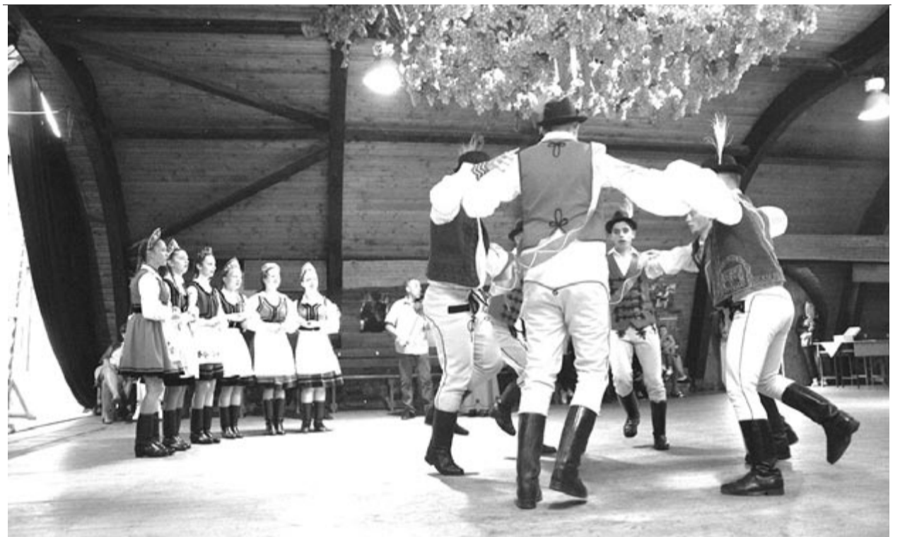
Mikházán felelevenítették a csősztáncok hagyományát

Aki lemaradt volna az eddigi bálokról, a hétfőn pótolhatta, ugyanis szombaton Nyárádszeredában az andrásfalvi fiatalok szerveztek szüreti bált, a Mezőség kapujában a Mezőfele Gyöngye a helyi kultúrotthonba hívta a szórakozni vágyókat, de akiknek ez távol volt, választhaták Erdősztengygyöt vagy a szomszédos megye szélén Parajdot is. Ami a belépőket illeti, ezekben a bálókban 20 lejért lehetett táncolni, de ennél többet kell majd fizetnie annak, aki a következő hét végén, 30-án Mezőbergenyét választja: ott 40 lejért kérnek egy felnőtől, 25 lejért a gyermekektől, ha meg akarják tekinteni a báli szüreti táncot.