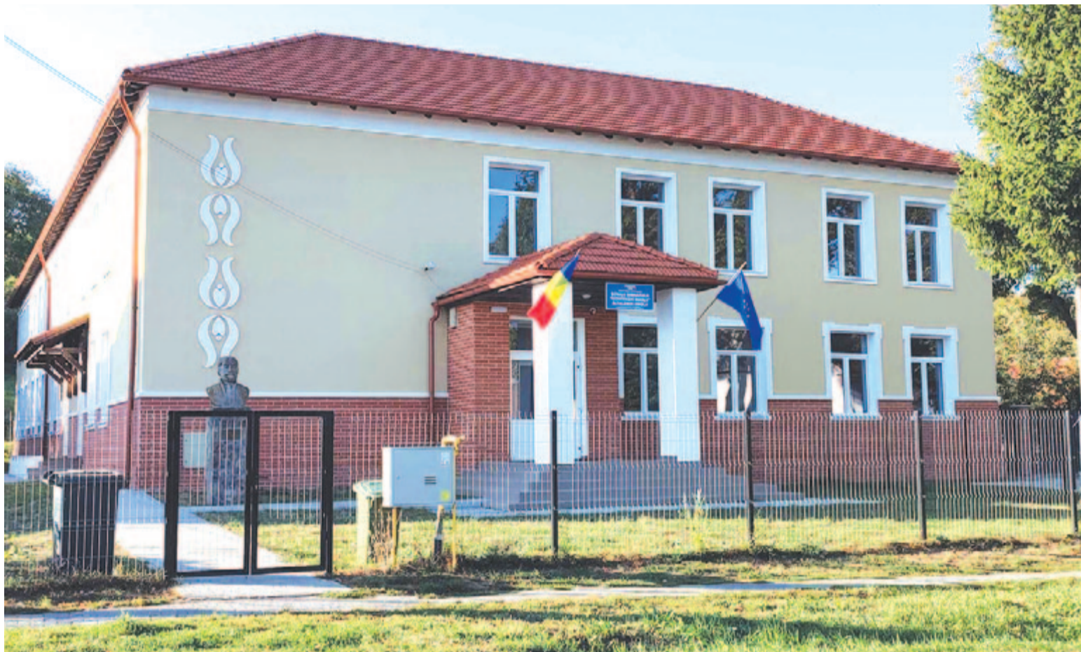
Négy év után visszatérhettek a gyerekek az iskolába