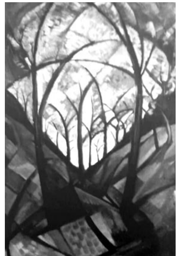
Kulcsár Béla: Gótika – a Nagy Attila kötetének borítóján szereplő festmény

Borító: Kulcsár Béla szobrászművész Gótika című festménye alapján született, Király István munkája.