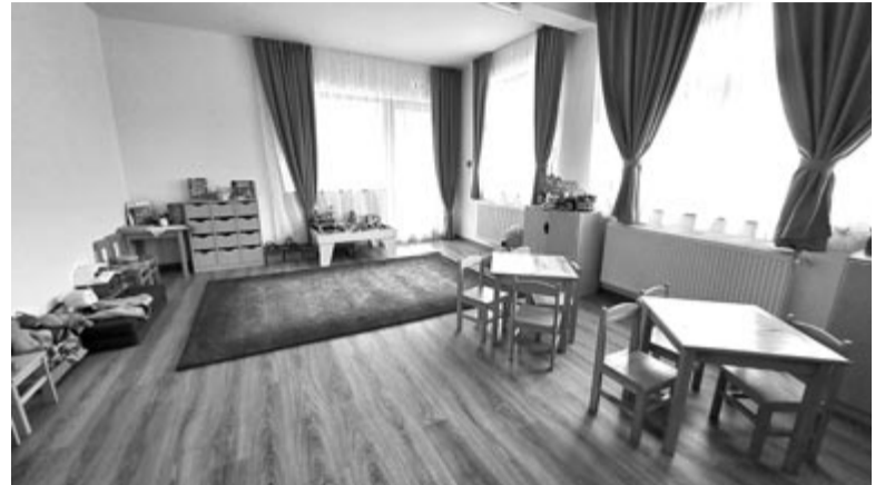
Nyárádszeredában két csoport költözött be az új napközibe

tartott, egyrészt gazdasági okok, másrészt a világvárvány miatt csúszott meg a kivitelezés tervezett határideje – tette hozzá az előljáró.