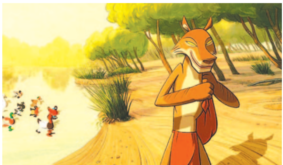
A kojot négy lelke

A 23. Filmtettfeszt programjában pár hete bemutatott magyar alkotások is szerepelnek, köztük a Sopsits Árpád rendezte Mellékszereplők , Szabó Mátyás Látom, amit látsz és Buvári Tamás A másik érintése című mozija.