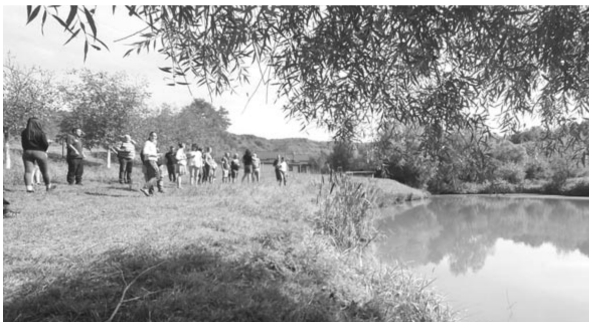
A vendégek számos jó tapasztalatot szereztek az itteni vizes élőhelyek visszaállítására terén