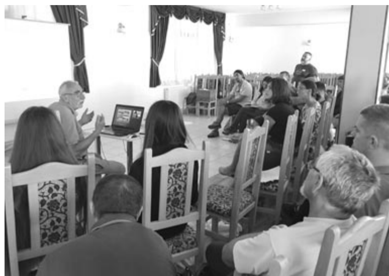
A nyárádmenti vízgazdálkodás problémáival, helyzetével is megismerkedtek

ciót végeznek Magyarországon. A projekt keretében tanulmányutakat szerveznek olyan helyekre, ahol már végeztek hasonló munkálatokat. Jártak már Angliában, Franciaországban, és egy közelebbi helyet keresve vették fel a kapcsolatot a romániai WWF szervezettel, az pedig a marosvásárhelyi Fókusz Öko Központot ajánlta romániai jó példaként, amely több mint húsz éve foglalkozik a kérdéssel, és nem csak elméletben, hanem gyakorlatban is megvalósított ilyen projektet. Így keresték meg a marosvásárhelyi szervezetet, majd szerveztek egy