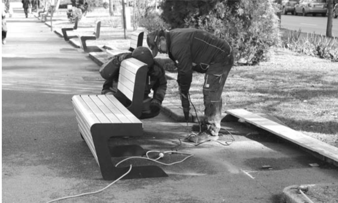
Nem váltak be a 2022 elején felszerelt padok

A köztéri padok cseréjét a helyi költségvetésből finanszírozták. A beszerzésükhöz nem volt szükség tanácsi határozatra. A régi padok nem mennek kárba, más parkokba helyezik át őket, ahol jobban illenek a városképbe. A kérdés az, hol vannak azok a szakemberek, akik eldönthetik, milyen köztéri bútorzat illik (vagy nem) Marosvásárhely központjához, hogy ne kelljen kétvétenként kicserélni, tegyük hozzá, a városlakók közös kasszájából.