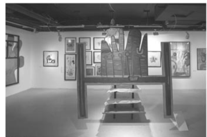
Rajzok: Szegedi Fanni Léptékhely 2, 6, 7, 9, 11, 12, 13, 14, 17, 19, 21, 25 és 28. oldal: György László Hegyekről című kiállításának anyagából. Balról, amely a legutóbbi Helikonban volt megjelent.