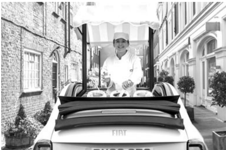
Fiat 500e Gelateria Edition