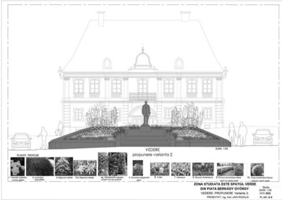
A Bernády tér felújításának terve