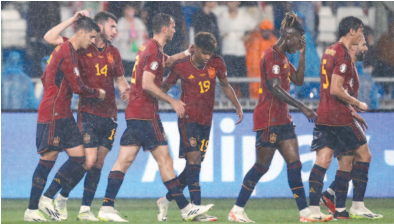
A spanyolok fiatal játékos (k) országa legifjabb válogatott futballistája és gólszerzője lett

A tíz selejtezőcsoportból az első két-két helyezett jut ki a jövő évi németországi kontinensviadalra. A maradék négy helyből egy a házigazda németeké, három pedig a pótselejtezőn 12 csapat küzdhet meg elődöntő-döntő rendszerben a Nemzetek Ligája alapján.