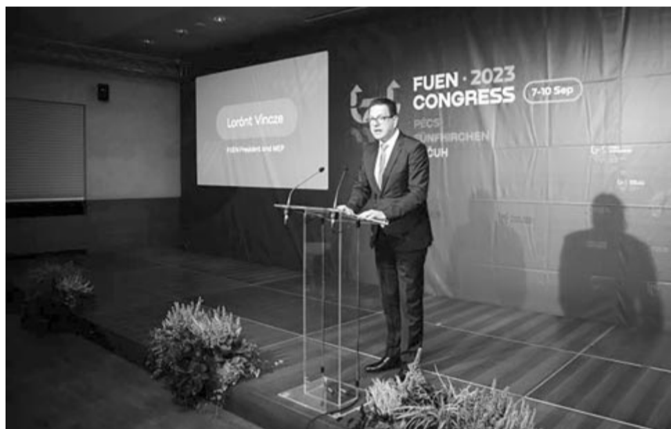
Vincze Loránt a FUEN kongresszusán, Pécsett

Vincze Loránt, a FUEN elnöke a megnyitón kiemelte a budapesti kongresszus történelmi jelentőségét: „A közép- és kelet-európai nemzeti kisebbségek nagy reményeket fűztek a kommunizmus bukásához,