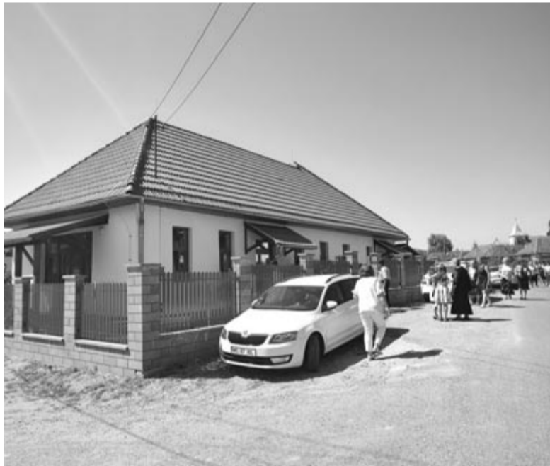
Befejezték a vadadi művelődési otthon felújítását – ennek is örülhettek a helyiek és a hazatérők

A szalagvágás, jelképes avatás után telt ház előtt lépett fel küllőmenti, mezőszegi, kalotaszegi táncokkal Dózsa György és Nyárádkarácsony községek egyesített néptáncsoportja, a Kalangya, a közönség gyönyörűségére. (GRL)