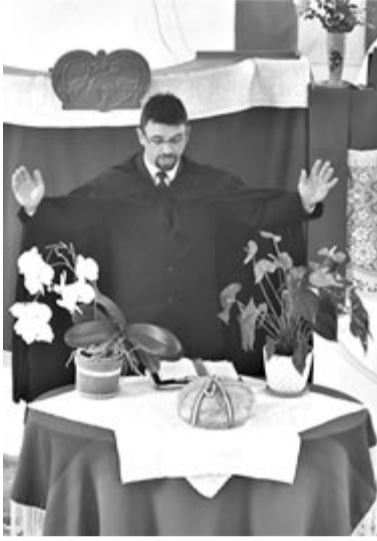
A reformátusok úrvacsorát vettek új kenyér ünnepén, Vadadban áldást kértek az új kenyérre

A Felső-Nyárádszeredai reformátusait Jobbágyfalvától Vármezőig pásztoroló csíkfalvi missziói refor-