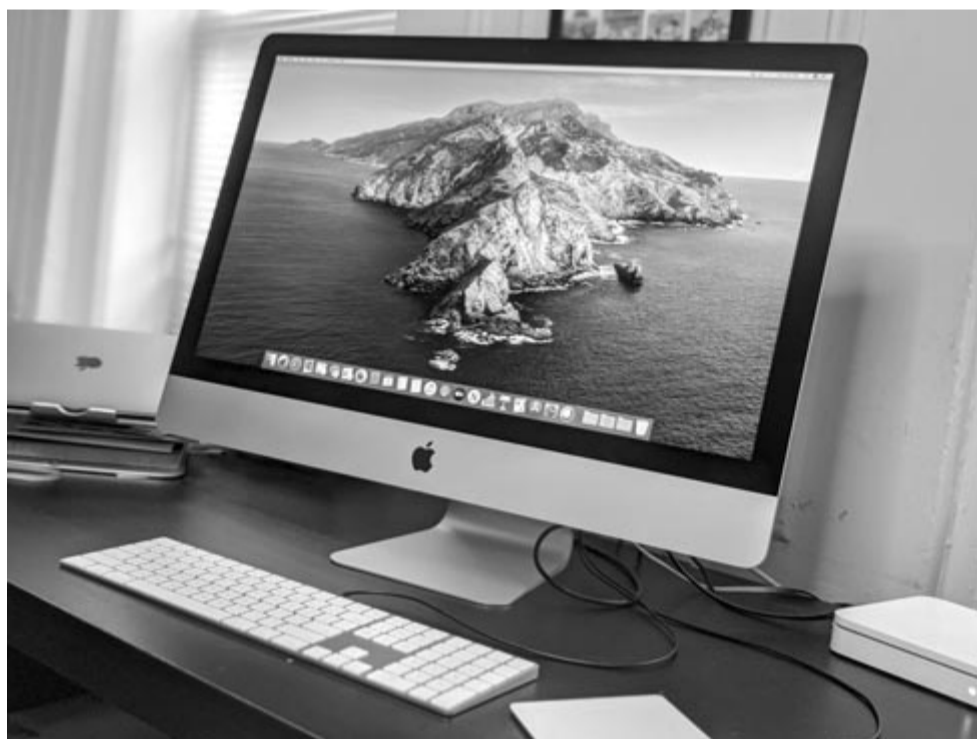
A klasszikus iMac, az Apple ikonikus számítógépe

De miért nem kap figyelmet az iMac? Egykoron az Apple nagy üzletet csinálhatott volna egy 30 hüvelykes all-in-one számítógéppel, viszont ma már nem vesződik azzal,