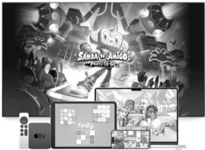
Apple-termékek és szolgáltatások, illusztráció

Van viszont olyan termék kategória is, amely növekedett 2023 második negyedében: a viselhető és otthoni készülékek. Ebben nagy szerepe volt az Apple Watch Ultrának, amely a hatalmas árcimkéje ellenére is képes volt megfogni a potenciális vásárlókat, többet, mint amennyire az Apple számított, derül ki a Tim Cookkal készült interjúból.