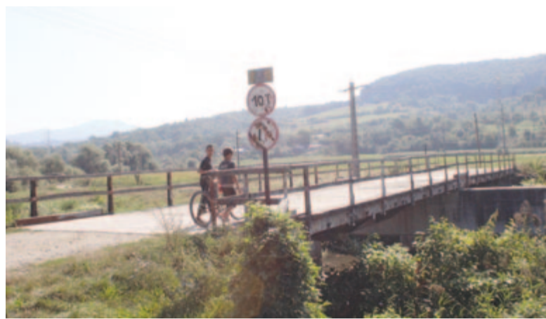
A felújításra váró híd

A községgazda arról is tájékoztott, hogy pénzalapot hívtak le a polgármesteri hivatal épületének teljes felújítására és energetikai hatékonyságának növelésére. A nagy volumenű munkát idejére a multifunkcionális orvosi központban