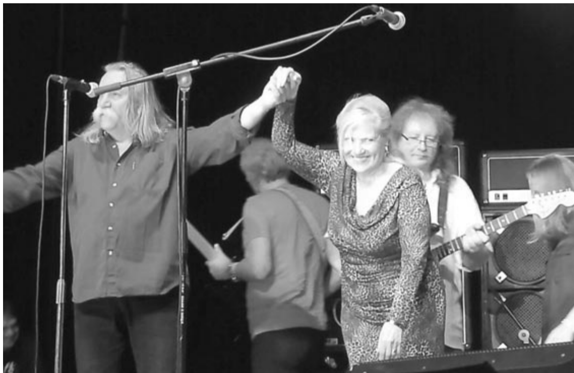
Schuster Lóránt és Adamis Anna

Itthon 1976-ban az év szövegírójának választották, 1995-ben Artisjus életmű-díjat, 1997-ben Huszka Jenő-életműdíjat kapott. 1996-ban művészeti munkájának elismeréseként a Magyar Köztársasági Érdemrend tisztikeresztjét vehette át. 2013-ban szülővárosa Pro Urbe Díját kapta meg, 2011-ben az V. kerület, 2021-ben Budapest díszpolgárává avatták. Idén megkapta a Petőfi Zenei Díj Életműdíjat és Kossuth-díjjal tüntették ki Magyarország számára kivételesen értékes, a könnyűzenei életet gazdagító művészi pályája, a legnevesebb zenekarok számára írt ikonikus dalszövegei, generációk életérzését hűen közvetítő és évtizedek óta töretlen népszerűségnek örvendő slágerei elismeréseként. Ősszel a Gútai Városi Művelődési Központot Adamis Anna Városi Művelődési Központtá nevezik át.