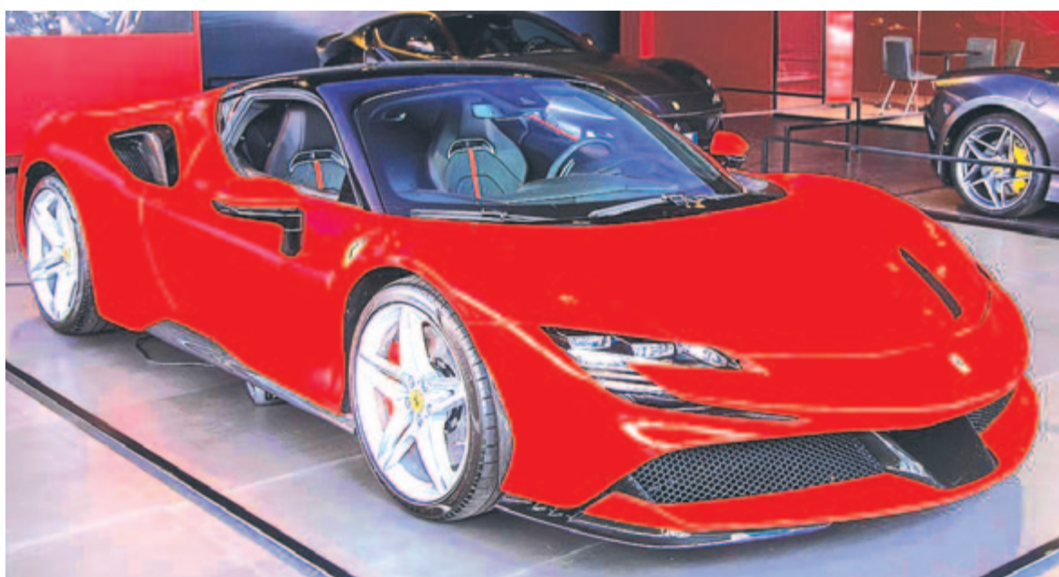
Ferrari SF90, az 1000 lóerős, hibrid Ferrari