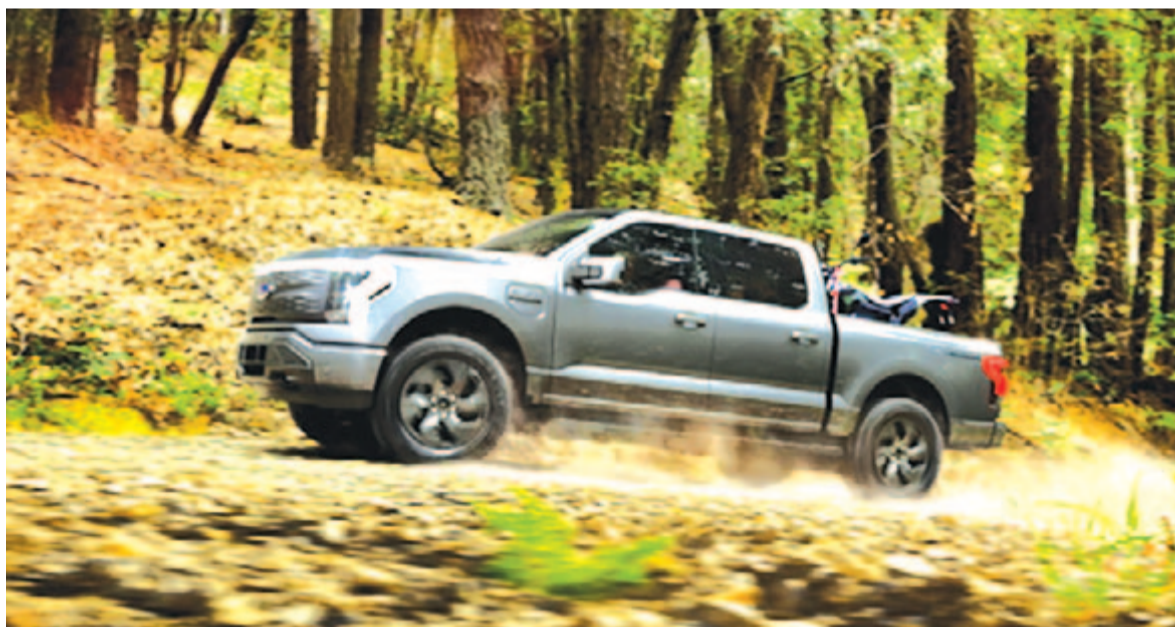
Ford F-150 Lightning, az óriási villany Ford pick-up

szen a gyártók elkészítik azt a mennyiséget, amely révén benn tudnak maradni a megszabott tisztasági kvótában, így nem kell büntetést fizessenek, és nem gyártanak többet az adott típusból, legalábbis abban az évben. Viszont amúgy