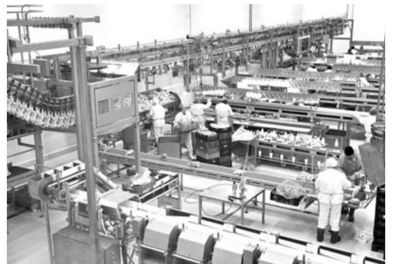
A kerelőszentpályi szárnyashús-feldolgozó üzem. A program az ilyen jellegű beruházásokat is támogatja

A nyilvános vitát követően a határozatot közlik a Hivatalos Közlönyben, utána meghirdetik majd a pályázatot. (vajda)