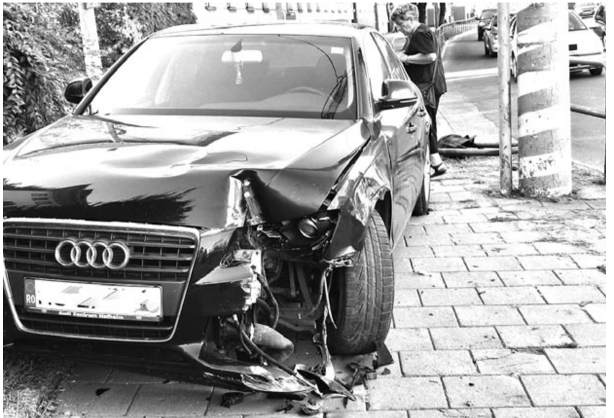
A Hangya-épület előtt