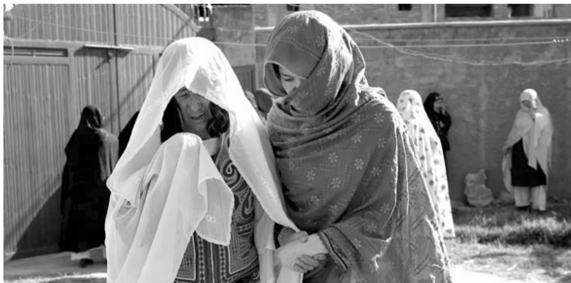
Kitiltották a nőket az összes egyetemről

„A béke nem csak annyit jelent, hogy nincs háború. Számomra a béke az, hogy az embernek joga van saját magához, a saját választásához. Mi vagyunk ebben a társadalomban az a csoport, amelynek nincs semmilyen joga ebben az országban. A helyzetünk nem jó, és napról napra romlik” – hangsúlyozta egy másik, az Euronews riportereinek nyilatkozó fiatal afgán lány.