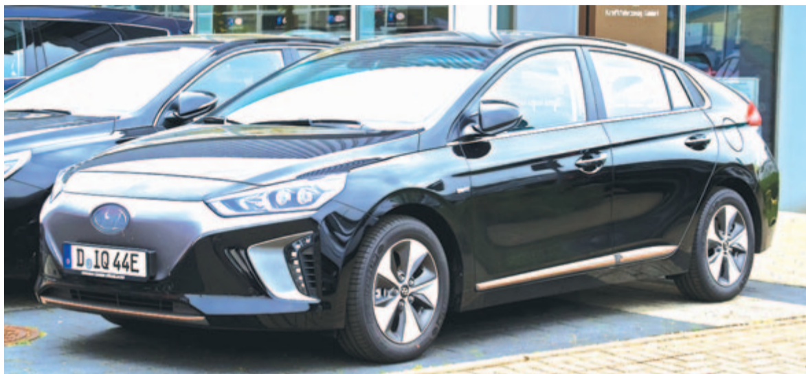
Tisztán elektromos szedán, a Hyundai Ioniq