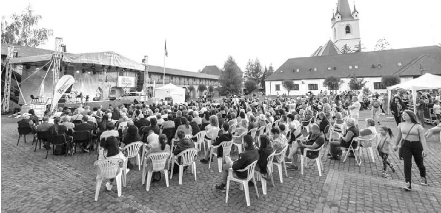
Véget ért a Harmonia Cordis gitárfesztivál

46 éve, 1977. augusztus 18-án hunyt el Budapesten a Kossuth- és Baumgarten-díjas magyar író, költő. (Született Budapesten, 1894. október 18-án).