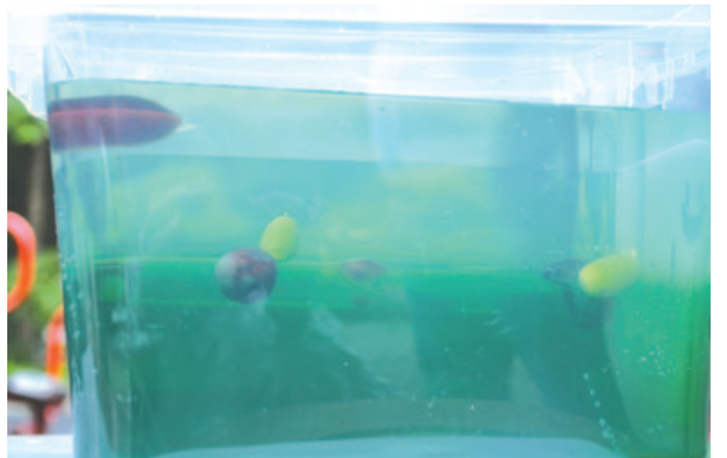
Haloklin réteg kísérleti szimulációja