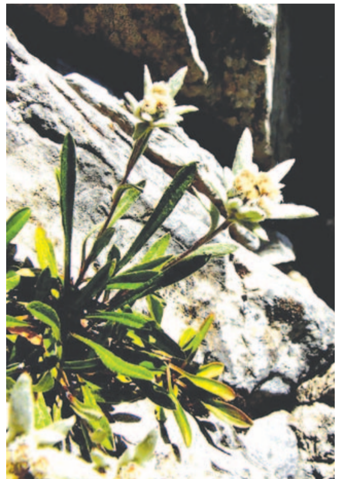
Havasi gyopár – remeteként szűz szirtfokon

Augusztus 22-én emlékezünk meg a rejtélyes életű Afrika-kutató, repülő és autóversenyző, Almásy László Ede születéséről. Az Őr-vidéki Borostyánkő várában született 128 évvel ezelőtt, 1895. augusztus 22-én. A borostyánkői birtokot még nagyapja, Almásy Ede szerezte, aki a Magyar Földrajzi Társaság egyik alapító tagja volt 1872-ben. Édesapja az Ázsia-kutató Almásy György volt. Egy londoni magániskolában érettségizett. Első pilótajogostványát 1912-ben