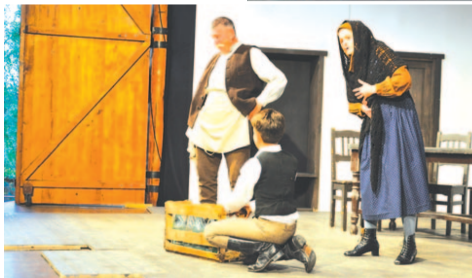
Csíki Játékszín: Tamási Áron – Csalóka szívárvány

Az igazgató arról is beszámolt lapunknak, hogy a kormány ellentmond saját magának. Elvárja a különféle menedzseri terveket, majd egy tollvonással keresztülhúzná azt, ami már az évtized végéig meg volt tervezve. Ha nem tartják ezeket a terveket, akkor felelősségre vonják őket, viszont abba nem gon-