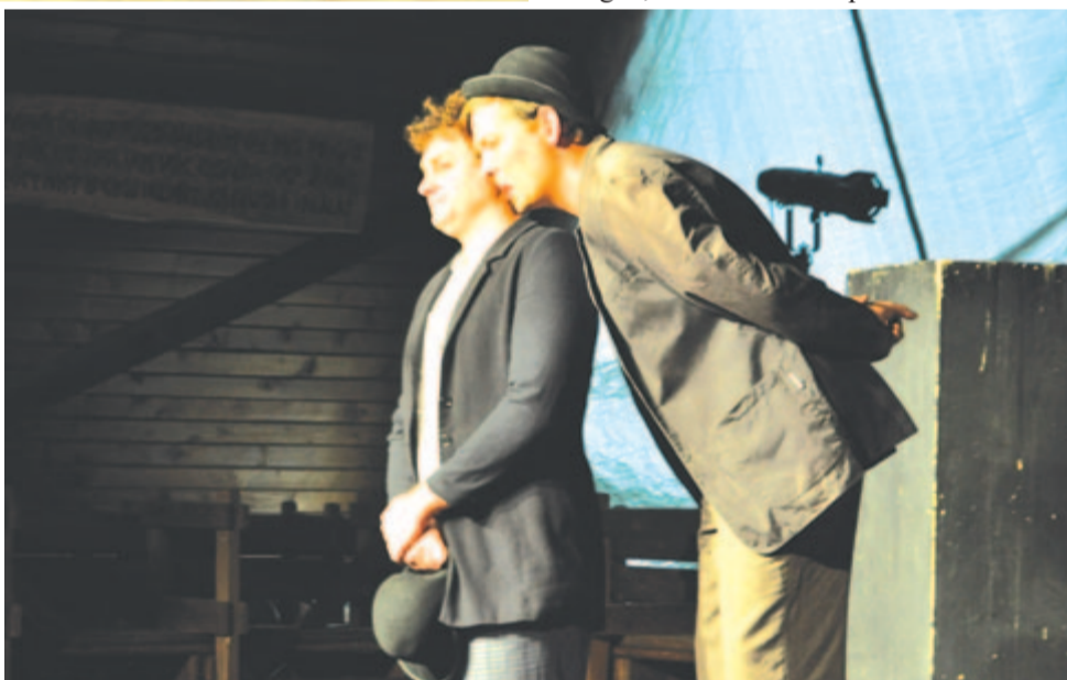
Figura Stúdió: Marion Jones – Kövekkel a zsebben

– Ez a kormányrendelet Csíkszeredában teljesen megölné a kultúrát, az összes kulturális eseményről lemondhatna a város. Vagyis az utóbbi évek azon próbálkozásai, hogy egy virágzó, kulturális szempontból is kiemel-