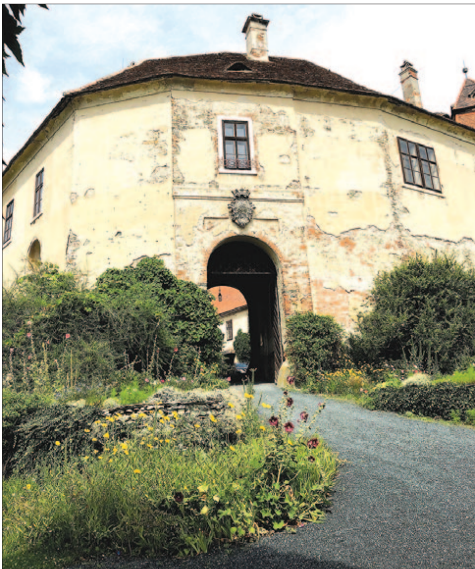
Borostyánkő, az Almásy-vár

Kelt 2023-ban, Szent Ilona , a régészek védőszentjének napján