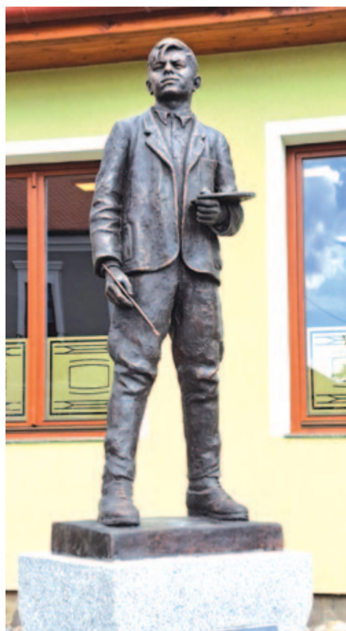
A festő... Izsák Márton szobra Gyergyóalfaluban

Nemrég írtunk róla mint Izsák Márton szobrász 15 éves modelljéről. A szobor a Petőfi Művelődési Központ bejáratánál áll Gyergyóalfaluban, A festő címet viseli. Márton Árpád ma Kolozsvár vendége lesz. A magyar napok alkalmával felsorakozó rangos kiállítások egyik legfontosabbjaként az ő több mint hat évtizedes alkotói munkásságát átfogó impozáns válogatást is bemutatják a Kolozsvári Művészeti Múzeumban. A Csíkszeredában élő festőművész széles körű képzőművészeti, művészetszervezői és festő-tanári munkásságának köszönhetően a kortárs erdélyi művészet megkerülhetetlen alakjává vált. Nevéhez nemcsak saját világot teremtő képzőművészeti munkásságát társítjuk, intézményteremtő tevékenysége szintén figyelemre méltó: a gyergyószárhegyi Barátság művésztelep 1974-es megalapítása Gaál