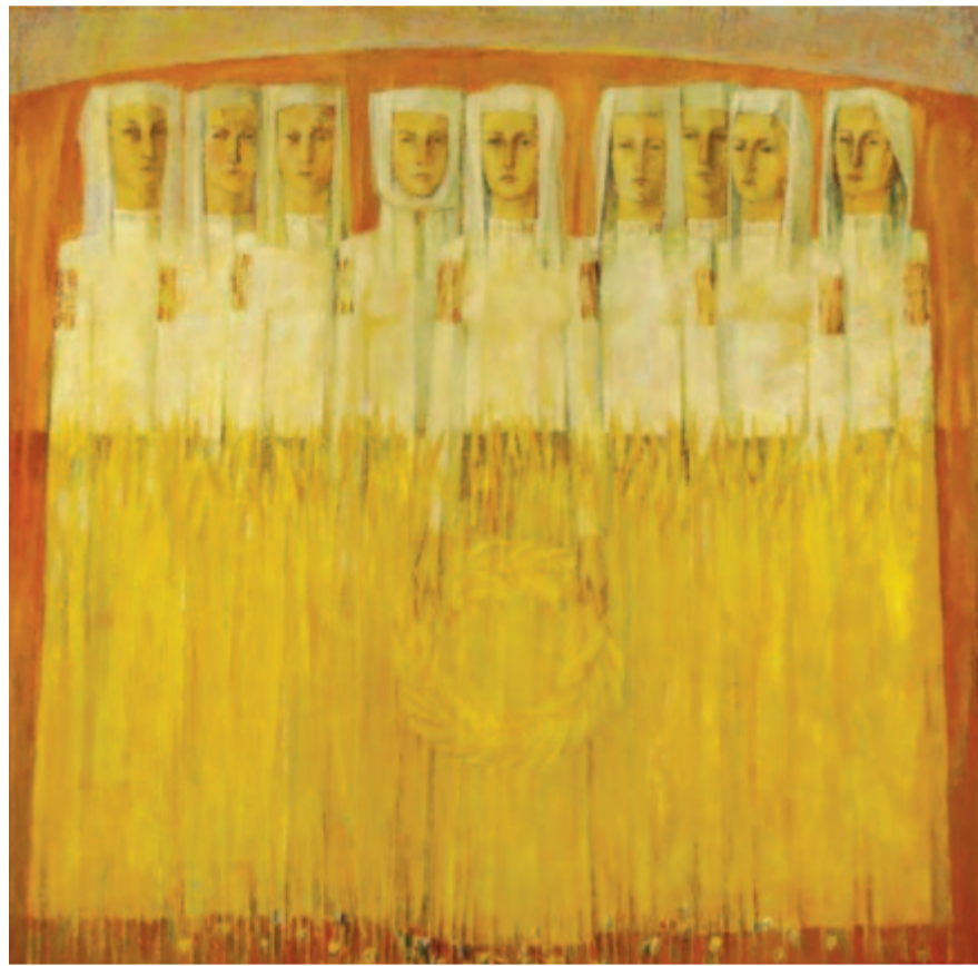
Búzacoszoru... Datu Victor festménye