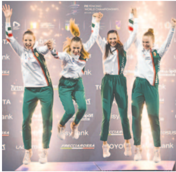
Címét megvédve világbajnok a női kardcsapat

A női kardozók a magyar küldöttség negyedik érmét szereztek Milánóban: korábban győzött a párbajtőröző Koch Máté és a Szilágyi Áron, Szatmári András, Gémesi Csanád, Decsi Tamás összeállítású férfikardcsapat, Szilágyi pedig harmadik lett egyéniben. (MTI)