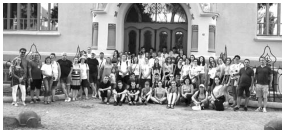
A teljes csapat a Bolyai Farkas Elméleti Líceum bejáratánál