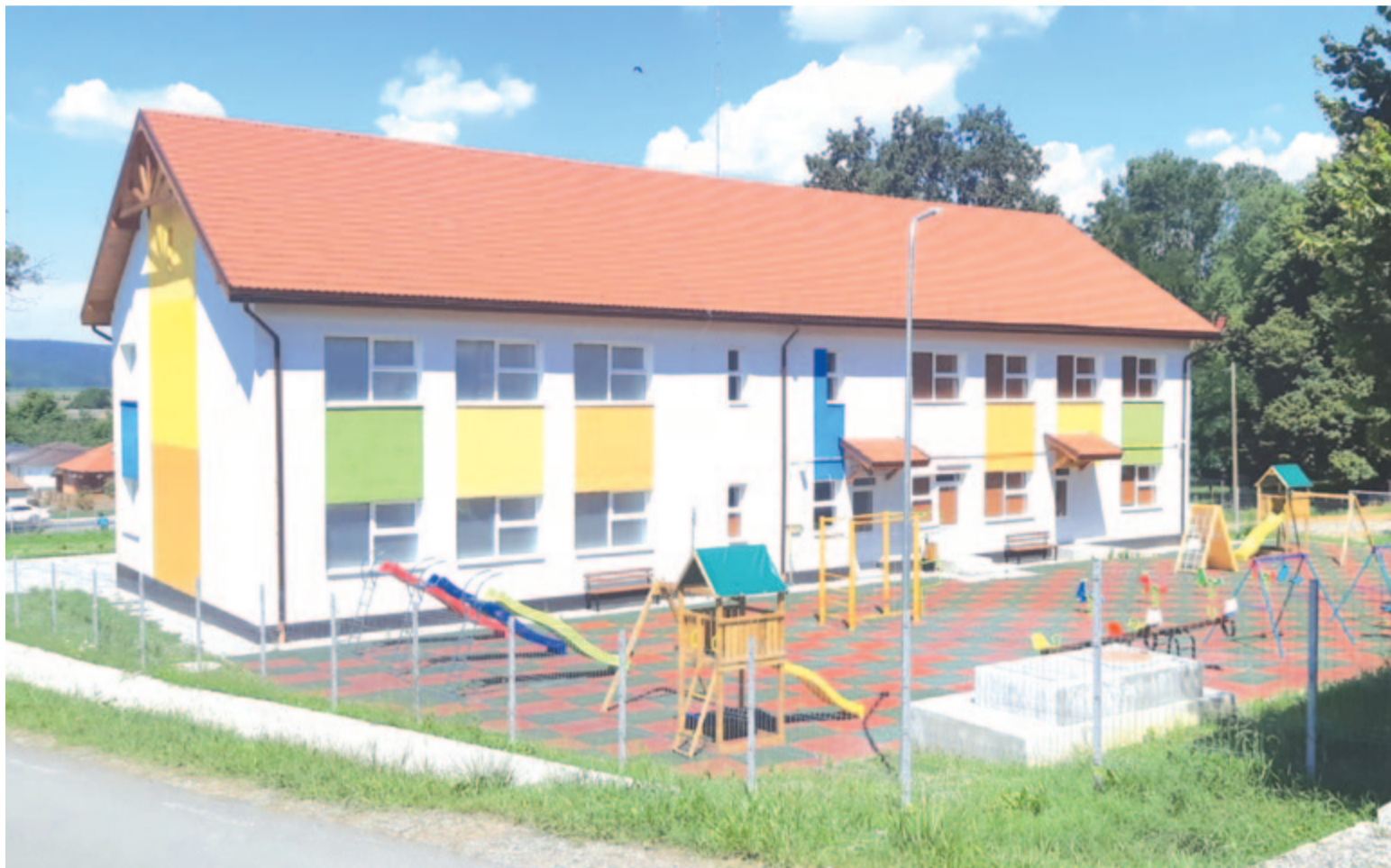
Nagyernyei Népiújság a 6. oldalon