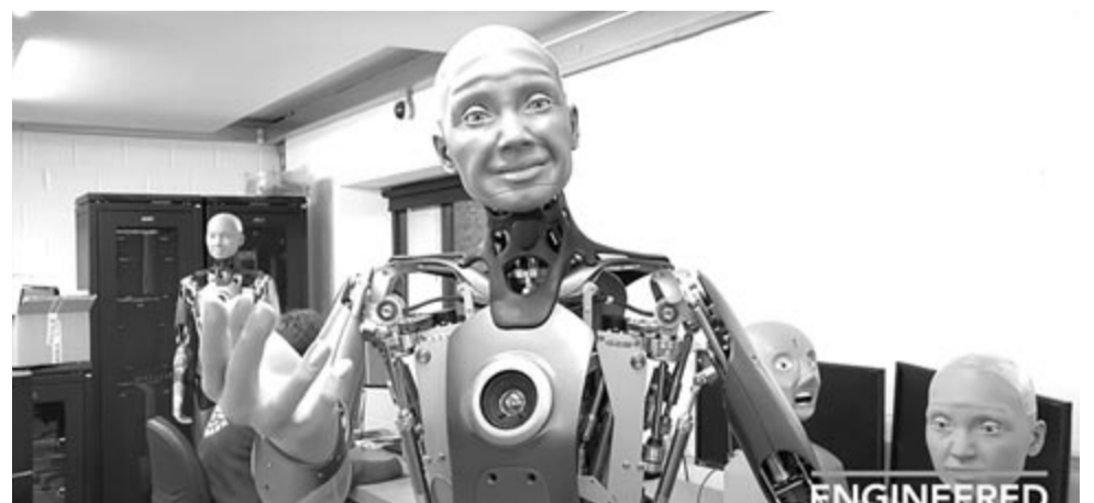
Ameca, a Föld legfejlettebb robotja sajtótájékoztatót is tartott

Biztos választ nem lehet most adni, nem tudni, hogy kinek lesz igaza. Egyedül az idő és a technológiai fejlődés előrehaladtával fognak választ kapni ezekre a kérdésekre.