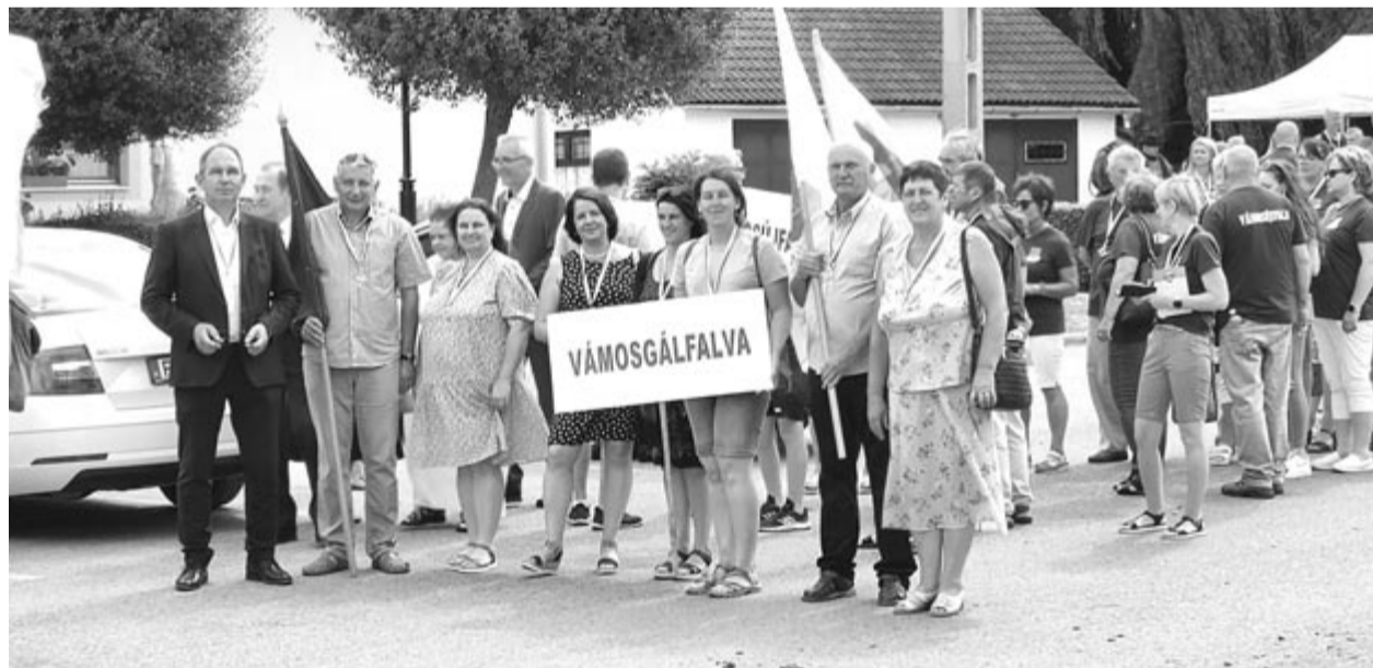
Vámos települések találkozásán a vámosgálfalvi küldöttség