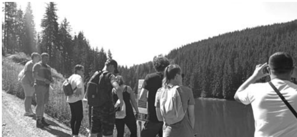
Szakmai kirándulás az ökotáborban

Minden iskolában a csapatoknak lesz egy vezetőtanára is, a továbbjutó csapatok vezetői pedig még a nemzetközi szakasz előtt fognak találkozni Kassán, amikor is megbeszélnek az utolsó forduló kialakítását, a kérdéseket és a könyvszeret. Ezután készítik fel a tanárok a diákokat a nagy megmérettetésre. A nemzetközi verseny után pedig a projekt lezárása következik 2024 augusztusában, amikor az iskolák diákcsoportjai az összes esemény alapján megírják a javaslataikat a saját városuk, régiójuk javítási lehetőségeit illetően, amit aztán eljuttatnak az önkormányzatoknak. Ez lesz a projekt fő terméke.