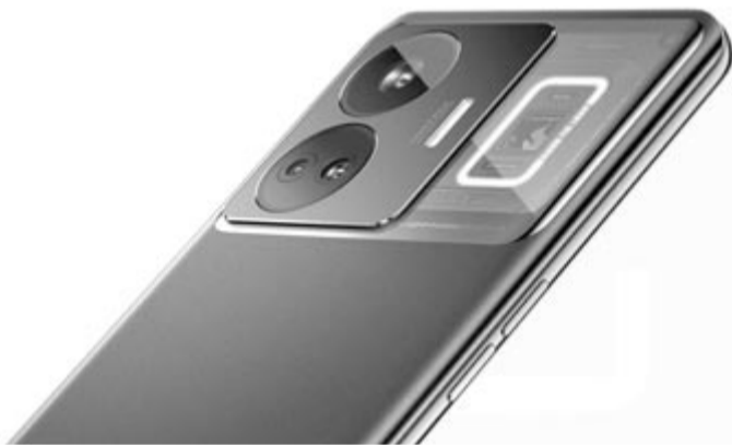
Realme GT3, a jelenleg leggyorsabban tölthető okostelefon

Az aktuális iPhone-ok esetében a legnagyobb vezeték nélküli teljesítmény 30W, miközben van olyan androidos készülék, amely képes 120W-ot is felvenni. Akkor pedig nem is beszélünk arról, hogy az Apple telefonjaihoz alapra töltőfej sem jár 2020 óta. Itt érdemes megemlíteni, hogy a jelenleg kereskedelmi forgalomban kapható leggyorsabban tölthető okostelefon a Realme GT3, amely 240W-tal képes tölteni, a dobozban pedig ott van az ehhez szükséges hálózati adapter. Ezzel a paraméterrel a kínai készülék négy perc alatt 50%-ra tölthető, miközben a jelenlegi csúcs iPhone-nak, a 14 Pro Maxnak több mint 30 perc van szüksége ahhoz, hogy elérje ezt a szintet. A különbség önmagáért beszél.