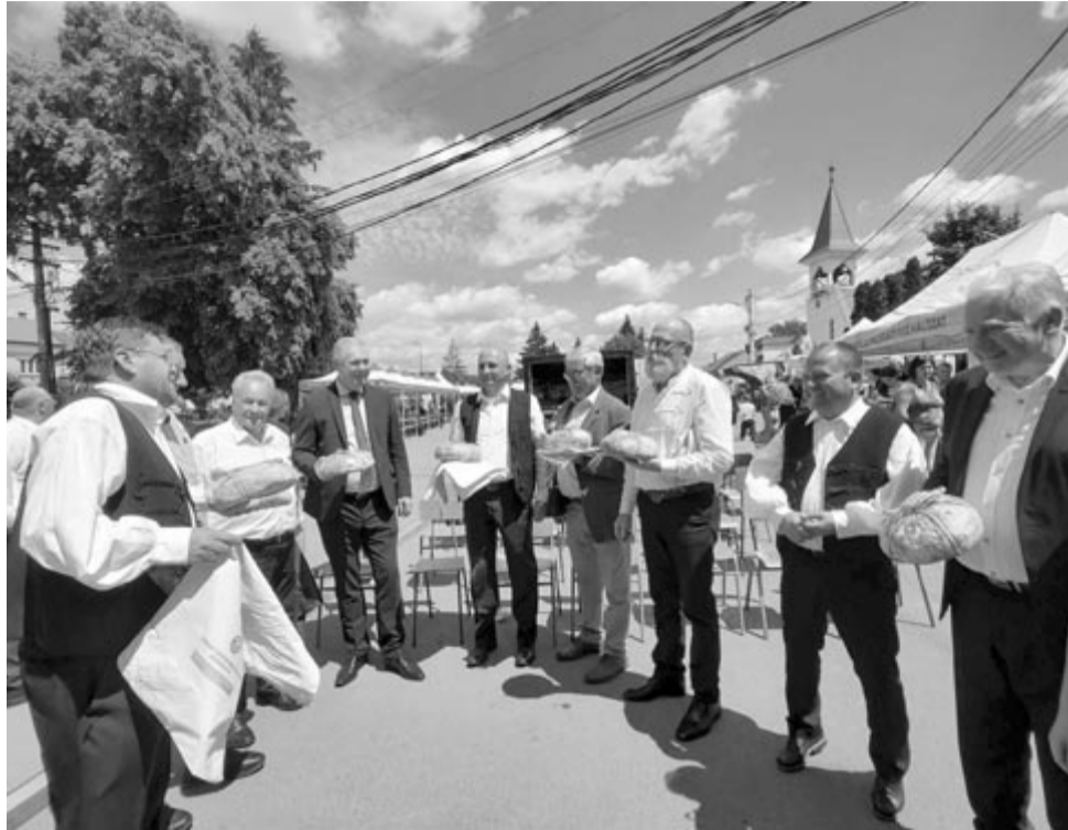
Pénzadományért cserébe megszentelt kenyér – a teremi gyermekotthonnak jut a begyűlt adomány

Az ilyen esemény egyrészt hozzájárul ahhoz is, hogy a Nyárádmente, Marosvásár-