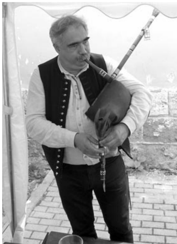
Egy dudás, egy csárda