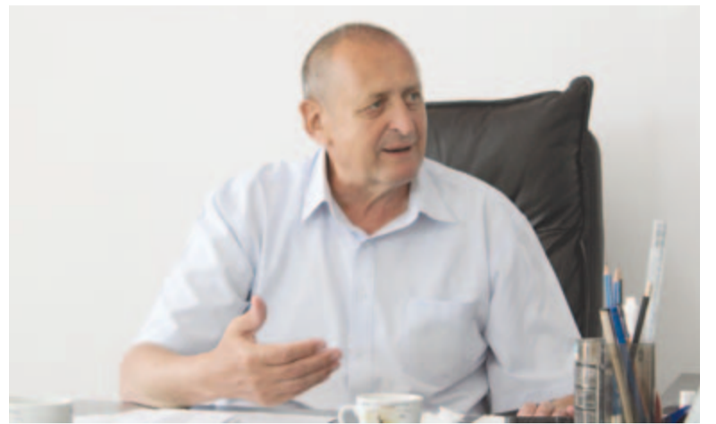
Ioan Aldea polgármester