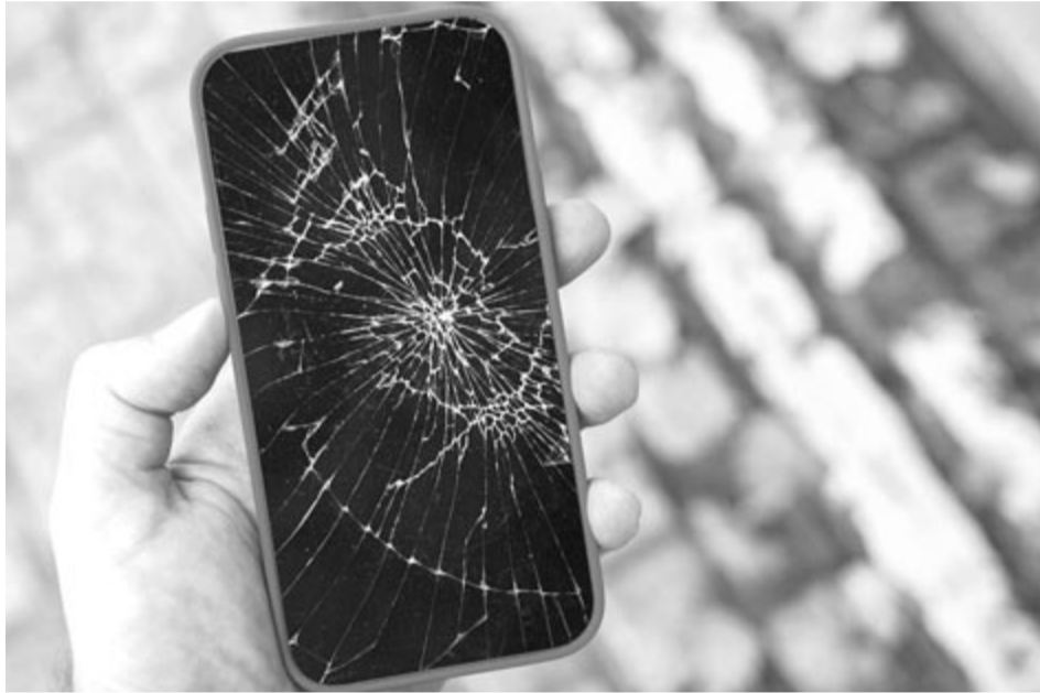
Törött kijelzőjű telefon, illusztráció