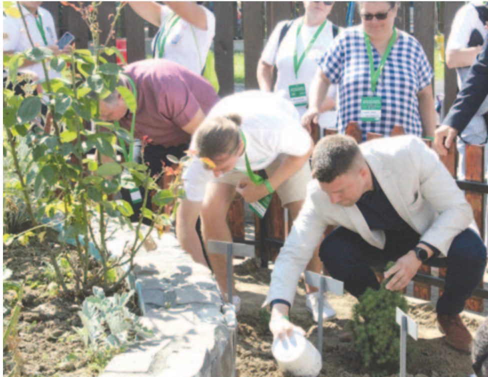
A Keresztúr nevű települések képviselői elültetik az ajándékba hozott cserjéket

Kelemen Hunor , az RMDSZ szövetségi elnöke a névválasztás identitásképző jelentősége kapcsán kiemelte, hogy a Keresztúr név a „kereszt” és az „úr” szavak összeolvadásából született, ami az ősök egyértelmű értékrendjét jelöli. Potápi Árpád szavaihoz kapcsolódva – miszerint a Keresztúrok első találkozója 2000-ben a bodrogi árvíz után szervezte meg Bodrog- és Balatonkeresztúr – az RMDSZ-elnök a helyi kezdeményezések fontosságát hangsúlyozta, majd a folyton változó hagyományról szólt, ami „eleven szövet”, „élő erő”, iránytű az eligazodáshoz.