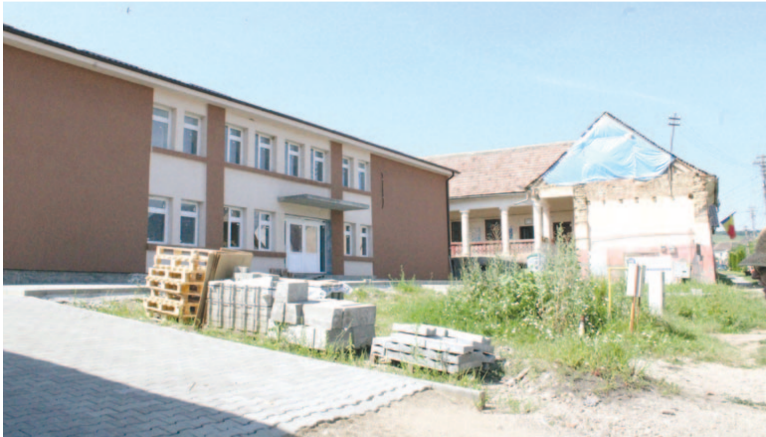
Szászbogácsi Népiújság a 6. oldalon