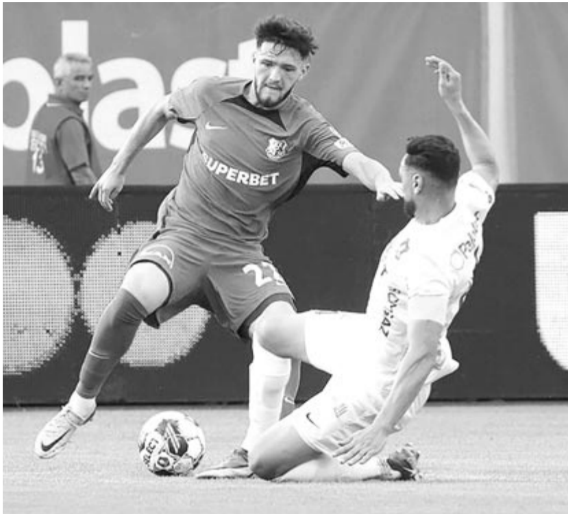
A Seps OSK elleni, Szuperkupa-döntős vereség után magára találni látszik a román bajnok: a Sheriff elleni első mérkőzésen aratott 1-0-s győzelem után a Szuperliga 1. fordulójában is 1-0-s sikert ért el Nagyszebenben, a Hermannstadt vendégeként úgy, hogy a tiraspoliak ellen bevetett tizenegy játékos közül csak egy kapott lehetőséget, a többieket pihentette a tengerparti edzője, Gheorghe Hagi

Két további érdekesség a nyitókörből: az újonc Jászvásár, amely ugyancsak elvesztette a jelvényhasználati jogot, vezetőst szerzett Kolozsváron, a CFR 1907 otthonában, azonban a videóbíró nem érvényesítette a találatot. A vége pedig 2-0 lett a házigazdáknak. Nagyszebenben a bajnok FCV Farul nyert úgy, hogy gólt sem kapott, bár a Sheriff elleni Bajnokok Ligája-selejtező első mérkőzésén használt csapat tagjai közül tízet Konstancaán hagyott Gheorghe Hagi vezetőedző.