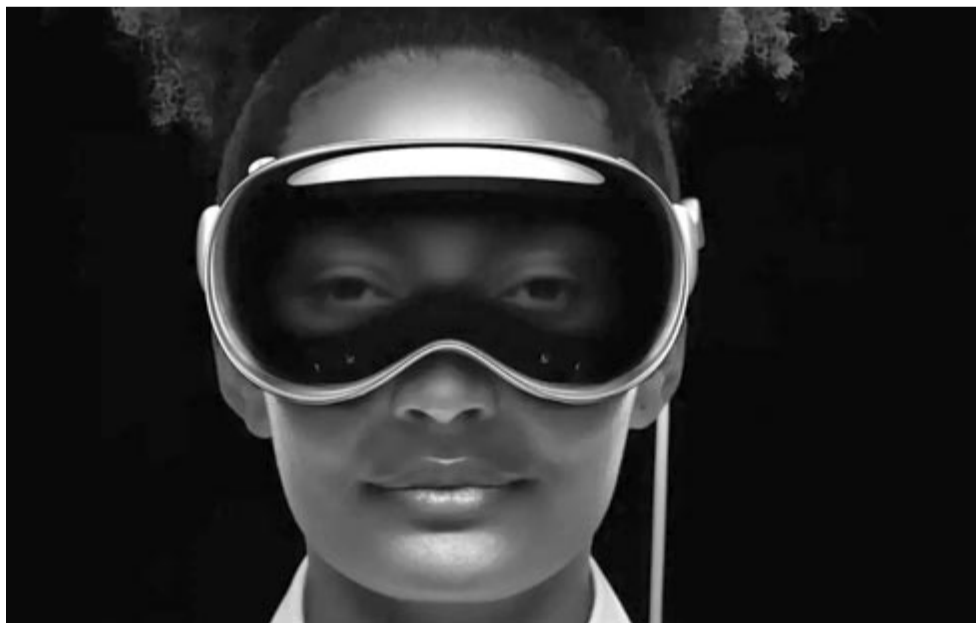
Apple Vision Pro

Jelenleg marad a várakozás, hogy milyen is lesz a valóságban az Apple méregdrága szemüvege, amihez külön kell megvenni a fejpántot, hiszen az alapsomag ezt nem tartalmazza. Nem tudni, hogy ez mennyibe kerül, de ha azt vesszük alapul, hogy az Apple Watch Ultra szíja bizonyos kivitelekben meghaladja a 700 lejt, akkor biztosak lehetünk abban, hogy a fejpánt sem lesz olcsó. Jövő év elején, amikor megérkezik az Egyesült Államok boltjaiba, többet fogunk tudni. A beígért két másik modell a hírek szerint 2025 első felében érkezik.