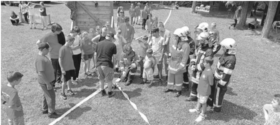
A tűzoltói alapképzése mellett még sok mindent megtanulnak a táborban

Arra a kérdésünkre, hogy miért szeretné ennyi szülő ide küldeni a gyermekét, a parancsnok úgy véli: itt nemcsak oktatás folyik, hanem fegyelem is van, a fiatalok megtanulnak csapatban gondolkodni, egy emberként megoldani a feladatot, emellett bajtársiasságot és egymás iránti tiszteletet is tanulnak. Nagyon sok gyerek már kiskorában arról ábrándozik, hogy felnőttként tűzoltó lesz. Az álom szertefoszlik egy ilyen tábor után, hiszen látják, mennyi munka, tanulás kell ahhoz, hogy valaki tűzoltó legyen. Ennek ellenére az érdeklődés nemhogy