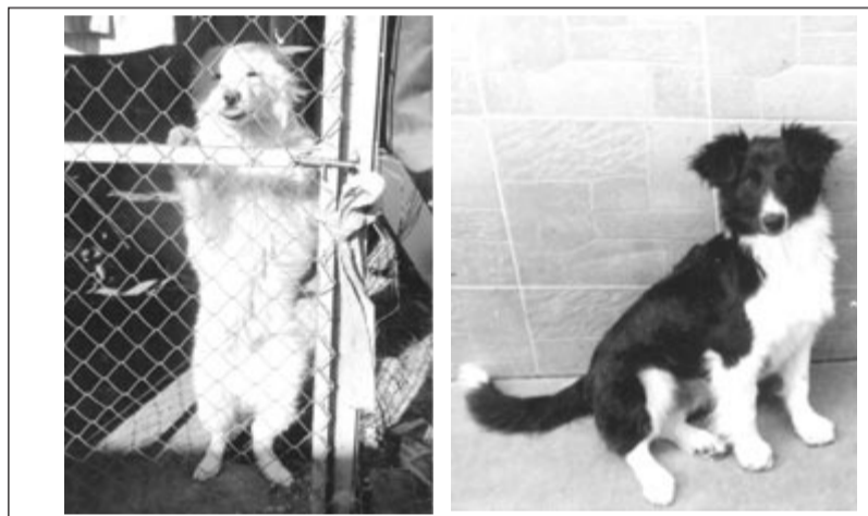
AJÁNDÉKOZOK egy fehér, nagy testű kutyát és egy fehér-fekete középtermetűt. Tel. 0744-573-699. (20158)