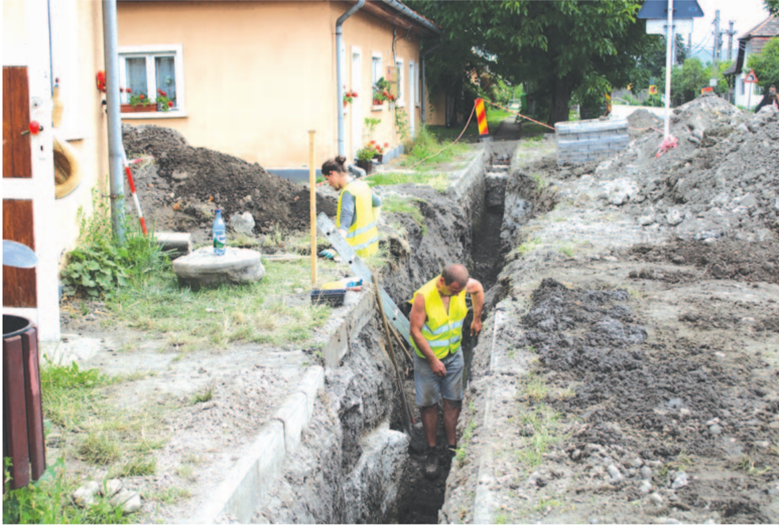
Év végére el kell készülnie