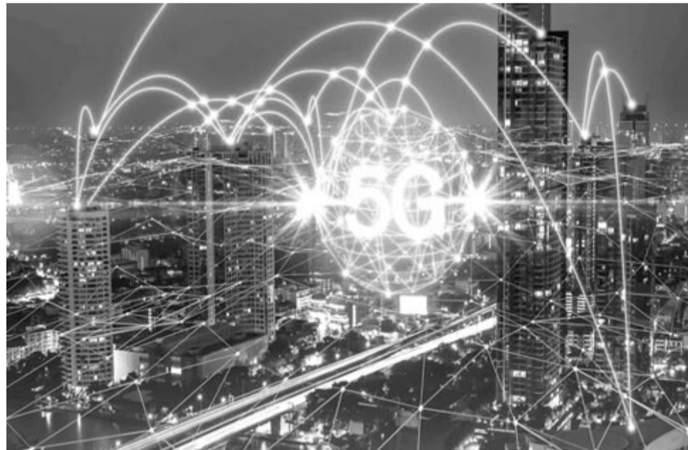
5G, a mobil-adatforgalom (jelenlegi) csúcsa, illusztráció

A mobil-adatfogyasztás mértékét pedig csak növeli, hogy egyre inkább elterjednek a különböző VR- és AR-eszközök és programok. Ezek a jövőben hatványozottan emelhetik a havi internetfogyasztást.