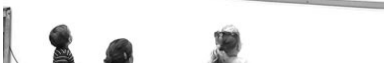
A tábor a jobbágytelki hagyományörző táncosok színpadi fellépése nyitotta meg