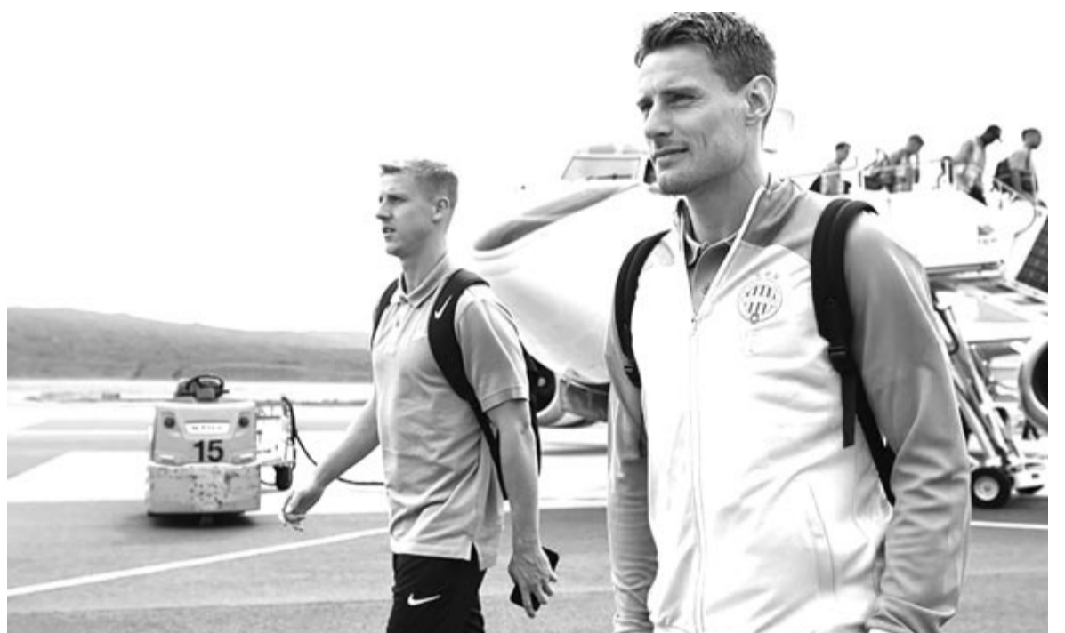
A magyar bajnok már vasárnap megérkezett az első mérkőzés helyszínére, ahol kellemes, 16 Celsius-fokos hőmérséklet fogadta. majd, és a visszavágót játssza idegenben.

Ha a Ferencváros sikerrel veszi az első selejtezőkörös párharcát, akkor a következő fordulóban a svéd BK Häcken vagy a walesi New Saints FC együttesével találkozhat. Ott az FTC már otthon kezd