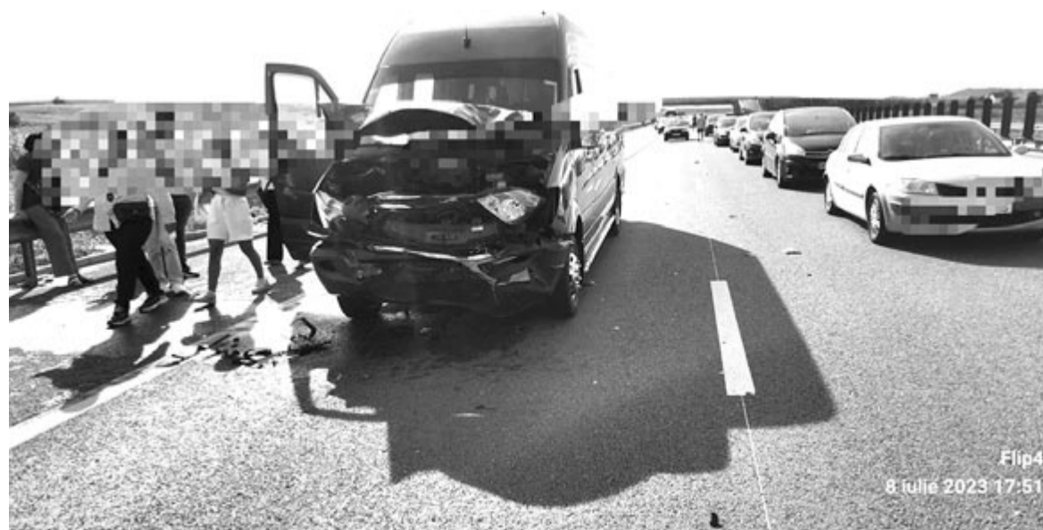
Baleset az autópályán

Vasárnap reggel 7 óra körül a dícsőszentmártoni tűzoltókat a Fehér megyei Küküllővárra riasztották egy közúti balesethez. Egy személygépkocsi letért az úttestről, és a villanyoszlopnak ütközött, majd felborult, ezért speciális tűzmelegelőzési intézkedésekre volt szükség. A sofőrt a SMURD légénysége kórházba szállította – tájékoztattott a tűzoltóság sajtóosztálya.