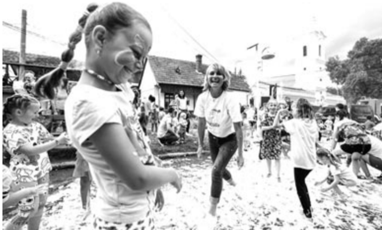
A tavalyinál is gazdagabb lesz a program

Az évről évre bővülő és változó program pontok között idén lesznek új ajánlatok, új fellépők, új helyszínek is. Így például július 22-én (a első napon) gyalogosan vagy kerékpárral lehet szervezeten eljutni