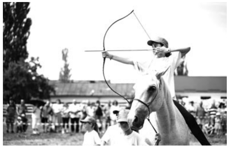
Előteremtették hozzá az anyagiakat, kezdődhet a kéthetes lovas tábor és az egyhetes szórakozás

Az egyik jelentős újdonság a 27-i hivatalos fesztiválnyitón lesz: a városközpontban felavatják az új szociális otthont. Másnap ugyancsak a főtéren kerül sor a Székely Gazdaszervezetek Egyesülete rendezésében a székelyföldi nagy búza-