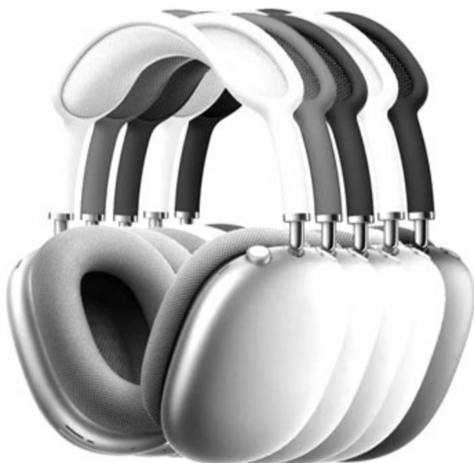
Az első generációs AirPods Max, az egyetlen, amely jelenleg a piacon van