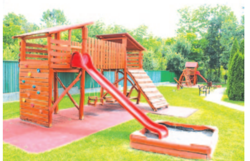
A disznajói játszótér

pedig saját forrásból felújították a meglévő játszótér és a szomszédságában található piknikezőhelyet, ahol sütogetni is lehet. A községgazda úgy tapasztalta, hogy a játszótérek ki vannak használva, ugyanakkor vigyáznak is rájuk a községbeliek.