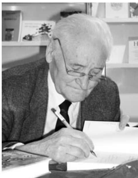
Kányádi Sándor dedikál a marosvásárhelyi könyvvásáron 2001-ben