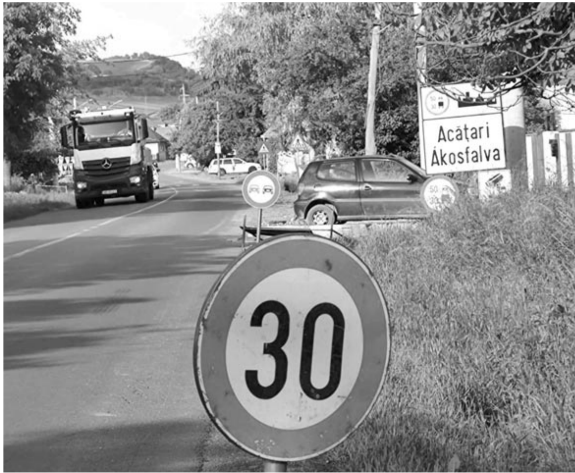
A főutak mentén körülményesebb, lassúbb a kivitelezés

A beruházást az Országos Beruházási Társaság (CNI) finanszírozza, a kivitelezés értéke 32 millió lej. Egy hónappal ezelőtt az önkormányzat aláírta a kivitelezési szerződést Székelyvaja és Göcs csatornahálózatának megépítésére is, ott a 16 kilométeres rendszer kiépítését az Anghel Saligny programon keresztül támogatja a fejlesztési minisztérium. A beruházás értéke 20 millió lej, a munkálatokat 20 hónap alatt kell befejezze a vállalkozó. A munkaterületet ebben az esetben is a napokban adta át az önkormányzat a kivitelezőnek.