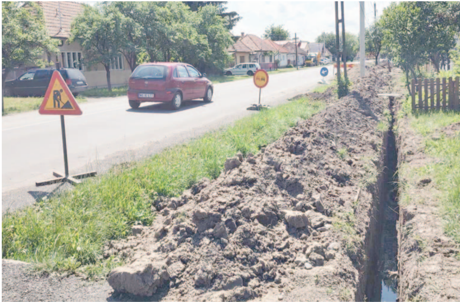
Mindenhol haladnak a munkával