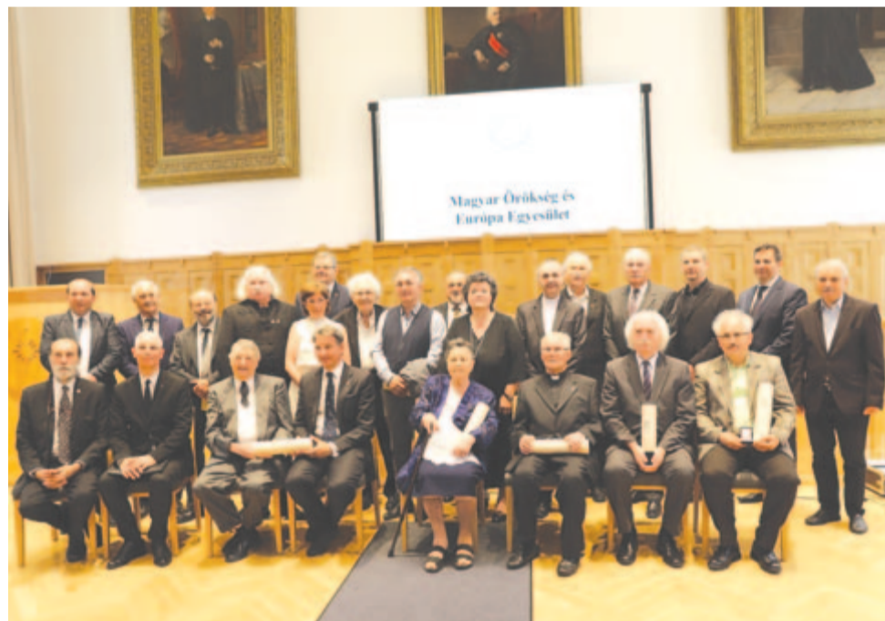
A Magyar Örökség és Európa Egyesület 105. díjátadó ünnepségének elnöksége, a bírálóbizottság, valamint a kitüntetettek és laudátorai csoportja

A rendszerváltás átjárhatóvá tette a határokat, 1990-ben újraindult, és immár művésztelepi igényekkel nyitotta tágra kapuit az összmagyar művészet reprezentánsai előtt a tábor. A nyitás más országok, földrészek irányába is megtörtént. A vezetésben bekövetkezett fiatalítás koncepcióbeli változásokat is hozott. A korábbinál nagyobb súly tevődött a kortárs művészetre. Kiemelkedő szerephez jutott a KorKép nemzetközi művésztelepi projekt, és az utóbbi években a MAMÚ-s alkotókörösség is fokozott részvétellel hallat magáról Gyergyószárhegyen. 2014-ben súlyos megpróbáltatás érte a művésztelepet, örökösödési eljárás nyomán kiszorult a Lázár-kastélyból. De sikerült túllépnie ezen is. A tradicionális technikai műfajoktól a konceptuális műformákig, a mediális megnyilvánulásokig terjedő széles skálán példásan bővül a műgyűjtemény. Tevékenységébe a társművészeteket is bevonva, mind erőteljesebb Gyergyószárhegy kisugárzása. A folyamat, amit a fiatalon elhunyt művészeti telepvezető, Siklodi Zsolt és a tanácsadást felvállaló Eröss István a művészeti centrum és a periféria alá- és fölrendeltségi viszonyának megszüntetésében oly következetesen szorgalmazott, beérni látszik. Ebben is bizonyára nagy előrelépést jelent a rangos Magyar Örökség díj elnyerése.