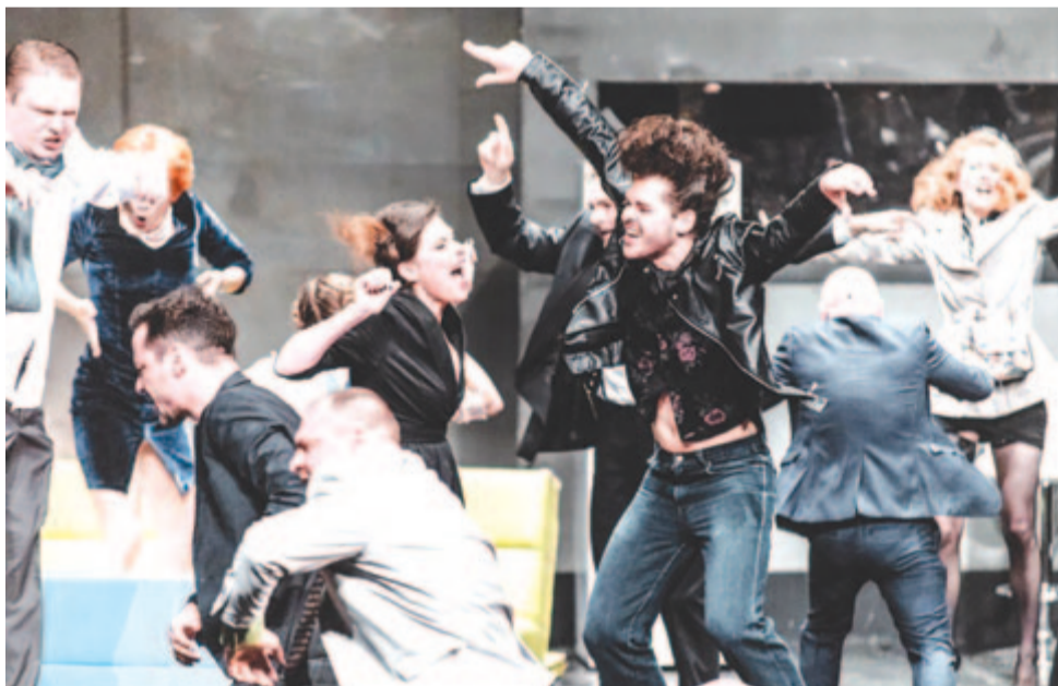
Jelenet a Tompa Miklós Társulat kisvárdai Részegek előadásából

A második felvonásban eltűnnek a lakás-, bár- vagy étterembelsőt idéző bútorok, a szereplők kilépnek a világba, az utcára, vagy bárhová, csak ki, éppúgy, ahogy a kommunikáció és az interakció is verbálisabbá, kimondottá válik. Talán túl kimondottá is. És bár ez már egy újragondolt, kissé átalakított, szereplőcserékkel felfrissített és időtartamában is feszesített előadás, még így is kiesik a kezem-