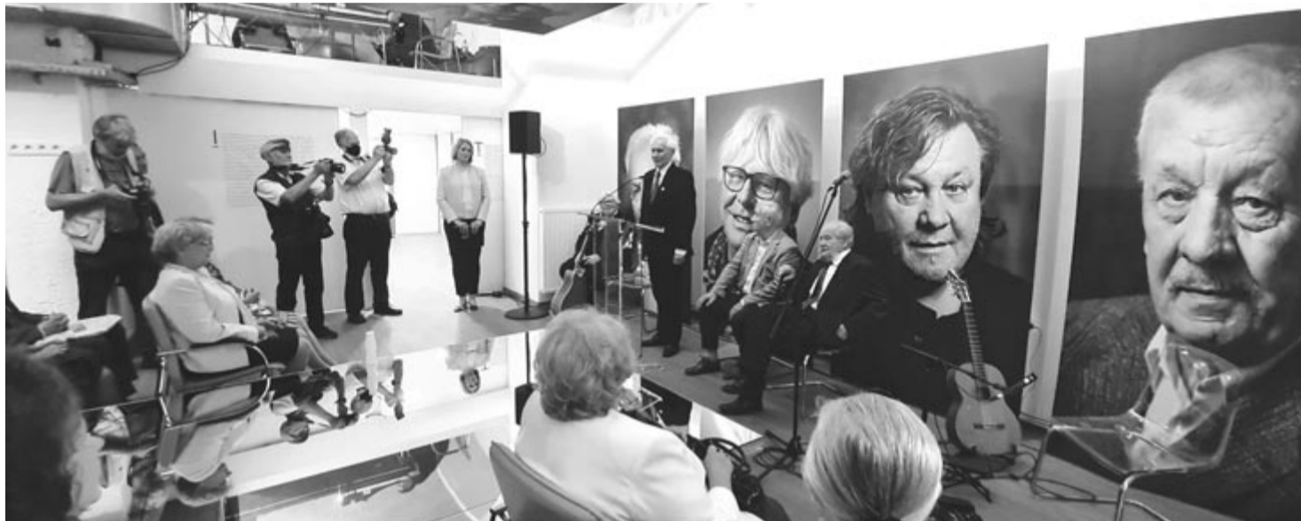
A „kossuthdíjasok” kiállítás megnyitóján

A kossuthdíjasok című fotókiállítás június 14-e és augusztus 20-a között a hét minden napján ingyenesen látogatható 10-18 óra között. (N.M.K.)