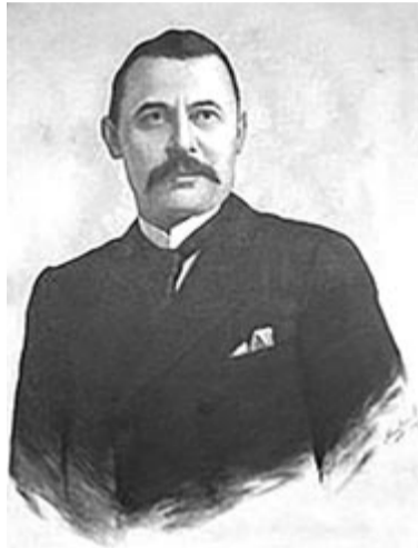
Mayler Ede: Mikszáth Kálmán, 1895

A zöld légy és a sárga mókus (1895) című Mikszáth-novellában a pesti egyetemi sebész, Birli József „kilógus” egyáltalán nem rossz orvos, ráadásul jó emberismerő. A fővárosból falura vonatozik Gál Jánoshoz, a „falu nábobjához”, hogy megmentse az életét. Mikszáth humorára jellemző már a felütés: Isten ítéletet tart az emberek felett, és úgy ítéli, hogy a módos gazdát, „akivel a szolgabíró is kezdet fog”, ezennel leüti. Tehát a módos parasztagazda kezét megcsipi egy apró, de fertőző légy. Gál uram keze „egyszerre da-gadni, pirosodni, aztán feketedni kezdett, mindig odább, feljebb.” A