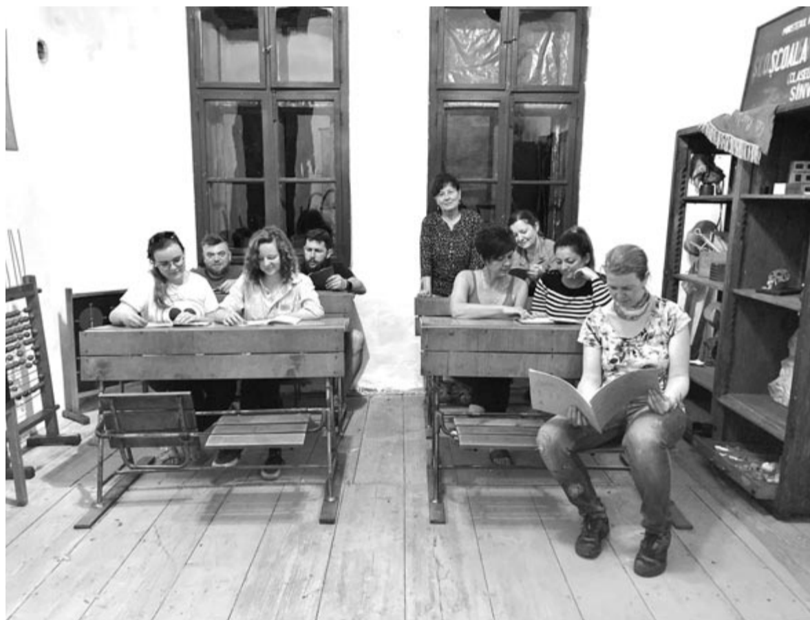
Nemcsak a falu idősei voltak kíváncsiak a megnyílt iskolamúzeumra, a fiatalabbak is szívesen beültek a régi padokba.

Az első munkatábor megszervezését és lebonyolítását anyagilag az amerikai unitárius testvérgyülekezet, az Ohio állambeli cincinnati Saint Johns egyháza támogatta, valamint a Nyomátról Szeretettel Egyesület.