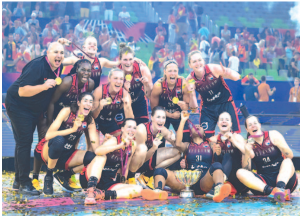
A győztes belga válogatott ünnepel a tróféával a női kosárlabda-Európa-bajnokság döntőjében játszott Spanyolország – Belgium mérkőzés utáni eredményhirdetésen a ljubljani Stožice Arenában 2023. június 25-én. A belga csapat 64:58-ra nyert.

Az Európa-bajnokság végeredménye: 1. Belgium, 2. Spanyolország, 3. Franciaország, 4. MAGYARORSZÁG, 5. Szerbia, 6. Németország, 7. Csehország, 8. Montenegró, 9. Olaszország, 10. Nagy-Britannia, 11. Görögország, 12. Szlovákia, 13. Lettország, 14. Törökország, 15. Szlovénia, 16. Izrael.