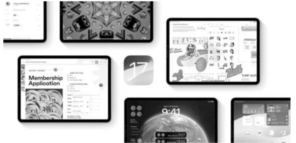
iPadOS 17, illusztráció

Összességében tehát idén az Apple a 2017-ben bemutatott iPhone 8, 8 Plus és iPhone X-től veszi el a szoftverfrissítés