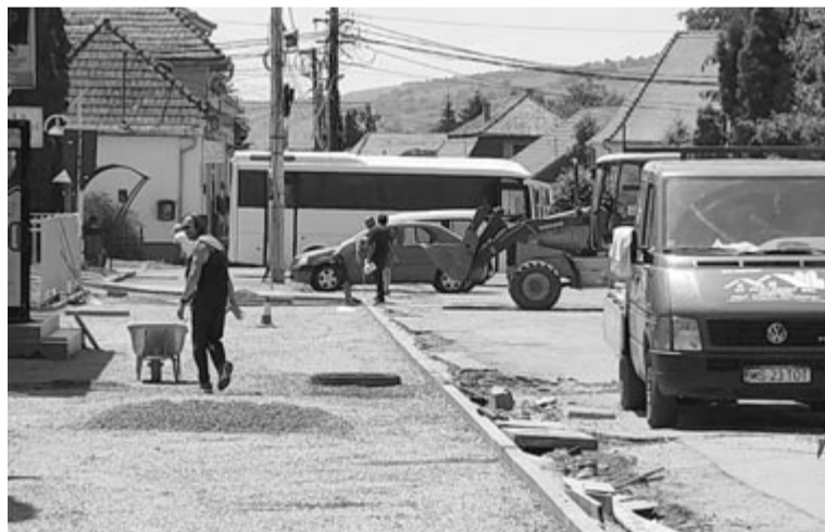
Két szakaszban az őszig megépül a járda, utána aszfaltoznak és rendezik a forgalmat – igéri a városháza

Ha ez a munka befejeződik, a tér további rendezésével foglalkoznak – igéri a városvezető. Tervet készítenek és átépítik vagy rendezik a teret, de mindenképpen leaszfaltozzák a járdát és a park közötti közlekedési sávot. A forgalom kérdése még hátravan, nem tudják még, hogy kétirányúvá teszik-e itt a közlekedést, vagy megmarad továbbra is az egyirányú bejárás, azt sem tudják, hogy lesz-e itt parkolósáv, vagy csak az itt lakókat engedik be, s a többi autós előtt lezárják a forgalmat. Ezekben majd a helyi tanács dönt. Addig is a nyár végére, ősz elejére igyekeznek befejezni itt mindenféle munkálatot, beleértve az aszfaltozást is, hogy utána az új útburkolatra felfessék a forgalmi jelzéseket, aszerint, ahogy a helyi tanács szabályozni fogja a forgalmat a főtér belső oldalán – tette hozzá a polgármester.