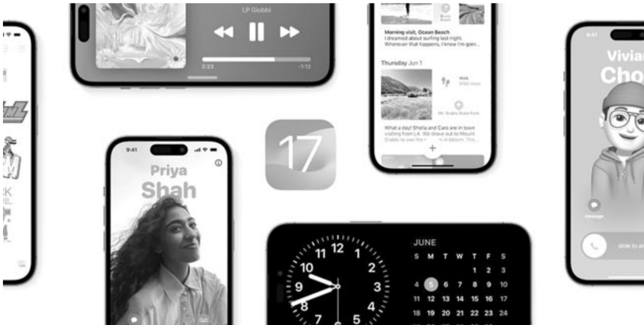
iOS 17, illusztráció

Az Apple Watchok esetében a negyedik generáció és az annál újabb eszközök fogják élvezni az új szoftvert. A számítógépek és laptopok esetében nem lehet egy általános képet alkotni azzal kapcsolatban, hogy mely gépek kapják meg az új MacOS Sonamát, az érintettek számára az a legbiztosabb, ha erre külön rákeresnek a vállalat weboldalán.