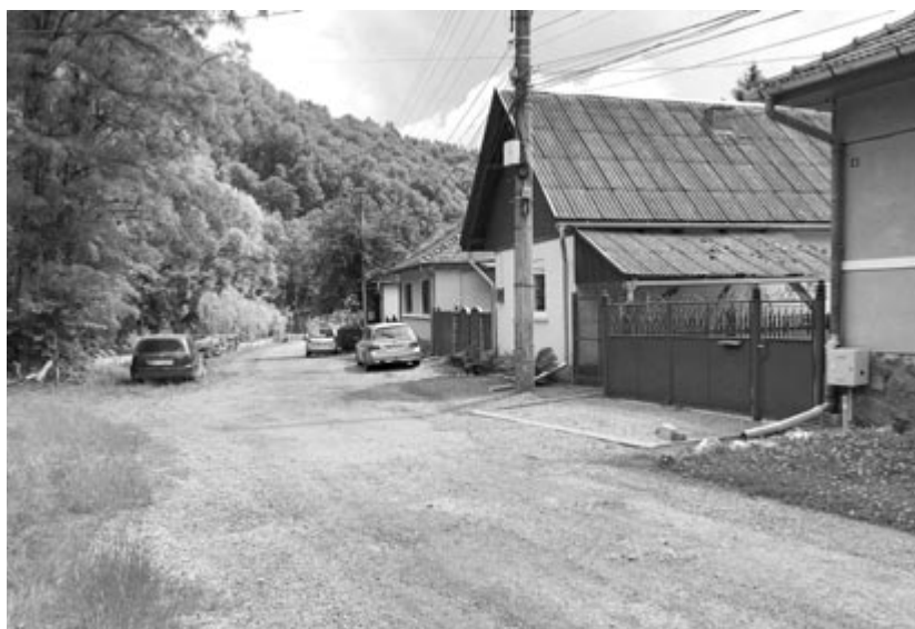
Huszonhét mellékutcat aszfaltoznak le, alig marad már szilárd burkolat nélküli közlekedési felület

Nemrégiben faültetési akció is zajlott Szovátán, az önkormányzat munkatársai különböző facsemetétet ültettek ki szerte a városban. Ezzel egy időben a régi kisvasút nyomvonalán megtisztították a területet, amely a Sómező utcát összeköti a „kölábakkal”. Ebben az S. Illyés Lajos Általános Iskola diákjai is segítettek, akik díszcserjéket telepítettek és madáretetőket helyeztek el az út mentén. (GRL)