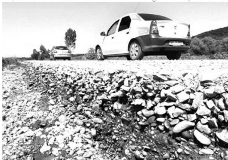
Az egy hónapja használt terelőút egy szakasza leszakadt – óvatosan kell közlekedni rajta