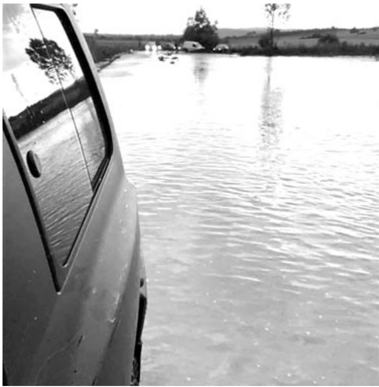
Csütörtök este ellepte a víz a terelőutat Kisadorján mellett

Terepszemlénken tapasztalhatunk, hatalmas kárt okozott az úton