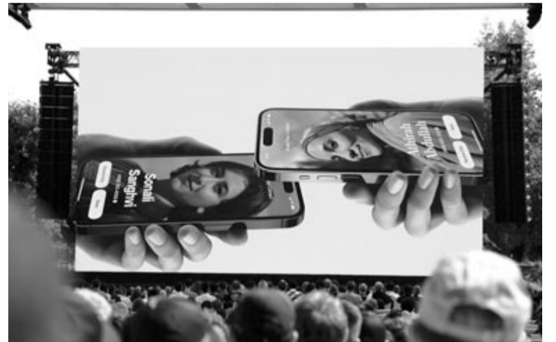
AirDrop – NameDrop

Rátérve a termékekre, megérkezett a 15 hüvelykes MacBook Air. A típust 2008-ban mutatta be Steve Jobs, azóta 13 hüvelykes kiadásban érhető el. Még volt egy nagyon rövid időszak, amikor létezett egy 11 hüvelykes változat, azonban azt az irányt végül az Apple elkaszálta. Most pedig megérkezett a 15 hüvelykes. Erre az lehet a magyarázat, hogy az almás vállalat a MacBook Pro esetében megszüntette a méretet, a helyébe került a 16 hüvelykes, méregdrága erőgép, na nem mintha valaha is olcsó lett volna bármelyik MacBook Pro. Viszont ez az eddiginél is sokkal magasabb ár sok vásárlót eltántoríthatott a 16 hüvelykes kiadástól, különösen akkor, ha átlagos számítógépes feladatokat végez, vagyis nincs szüksége akkora teljesítményre, mint