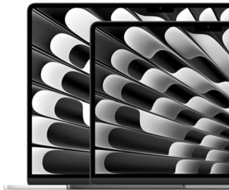
MacBook Air 13 és 15 hüvelyk

A legnagyobb újdonság pedig maga az Apple Vision Pro, az Apple 3500 dolláros VR-szemüvege. Az ár az Egyesült Államokban érvényes, Európában legalább 4000 euró lesz. Am ebben sincs meg a nagy wow faktor, lehet benne videóhívásolni, és akivel beszélünk, az egy avatárt, egy virtuálisan összerakott figurát lát rólunk, azaz elvesztődik a videóhívás igazi varázsa. Ezenkívül pedig az akkumulátor nincs beépítve a szemüvegbe, ami azt jelenti, hogy mondjuk a zsebünkbe kell tenni, akkor pedig ott lóg a kábel. Az akkumulátor pedig mindössze két órát bírja, így egy hosszabb repülőúton sem lehet például filmet nézni rajta, mert nem elegendő az üzemidő. Vannak benne finom részletek, mint hogy 3D-ben mutatja az alkalmazások ikonjait, hogy virtuálisan élénk teszi a billentyűzetet, hogy gesztusokkal lehet vezérelni, de ez édeskevés. Különösen ennyi pénzért. Az egyedüli terület a mérnöki, architektúrai, ahol ennek a „túlázott bűvárszemüvegnek” lehet értelme, de ez annyira kicsi terület, hogy hosszú évek alatt sem lesz képes az Apple annyit eladni, hogy visszahozza a fejlesztési költségeket. Am egyelőre ne írjuk le teljesen az eszközt, várjuk meg, hogy kerüljön a boltokba – legalább az Egyesült Államokban –, és akkor fogjuk majd látni, hogy mire képes valójában. A pletykák szerint nem biztos, hogy a szemüveg eljut Európába.