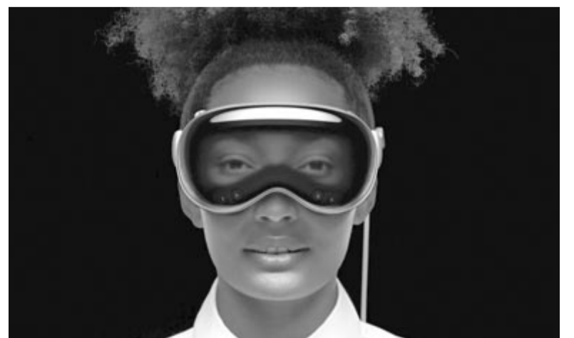
Apple Vision Pro

semmi. Érkeztek új számlapok, új widgetek, néhány új funkció a sport alkalmazásba, és ennyi. Új számlapok minden évben érkeztek, a widgetek számos területen hasznosnak tűnhetnek, de nem egy órán, amelynek alpból kicsi a kijelzője. A felhasználók többsége például nem is azon nézi meg az időjárás-előrejelzést, legfeljebb rápillant, hogy éppen hány fok van kint, nemhogy az amúgy is kicsi képernyőt megossza, és kitegyen rá egy ablakot, ahol állandóan tudja nézni az időjárás-előrejelzést. Az Apple ezzel a funkcióval példázta a widgetek hasznát a WWDC-n, ezért élünk mi is vele. Az egyetlen komolyabb újdonság a sportfunkciók terén érhető tetten, de ez is csak egy szűkebb réteget érint. Például biciklizés közben elérhető lesz egy Live Activity widget, amelyre ha rányomnak a felhasználók, láthatják kilistázva a legfontosabb információkat, ame-