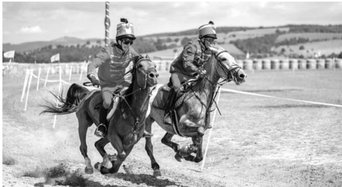
A döntő futamban Székelybere lova és lovasa (b.) „bevágatott” a budapesti döntőre

A vasárnapi középútamban már nagyobb volt a tét, itt a megingó Etéd lova elveszítette a küzdelmet Székelybere indulójával szemben. Nem sikerült döntőbe jutnia Nyárádszeredának a címvédő Farkaslakával szemben: Tip-Top már a startnál hátrányba került Villámmal szemben, a második helyen végzett.