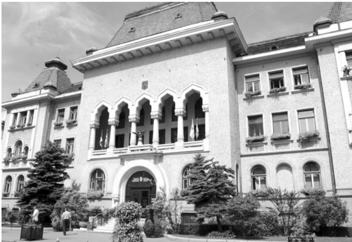
A felvétel illusztráció

A nőnek kétszer ajánlott fel lakhatási lehetőséget a polgármesteri