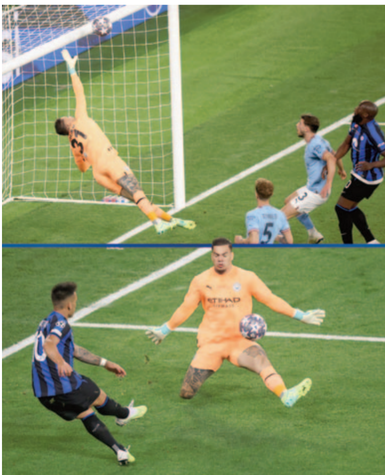
Az Inter több nagy helyzetet kihagyott, kettőt az UEFA közösségi oldalán is bemutattak

* 1: Celtic Glasgow (skót) – 1967, Ajax Amsterdam (holland) – 1972, PSV Eindhoven (holland) – 1988, Manchester United (angol) – 1999, Internazionale (olasz) – 2010