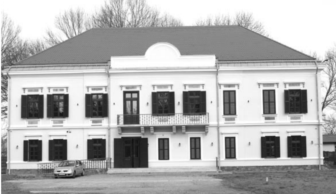
A maroszentgyörgyi Máriaffy-kastély is az úti célok között

Tonk Márton hangsúlyozta: az egyetemen évről évre stabil, 2200 körüli a diáklétszám, a sepsiszentgyörgyi karral azonban 2600-ra nő, így az erdélyi magyar fiatalok egyharmada tanulhat a magyar kormány támogatásával működtetett erdélyi magyar magánegyetemen. (MTI)