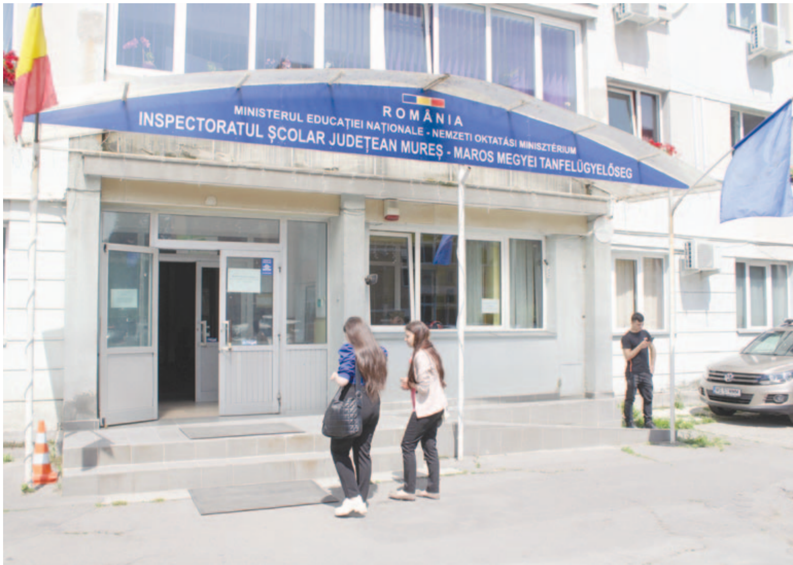
A Maros Megyei Tanfelügyelőség székhelye