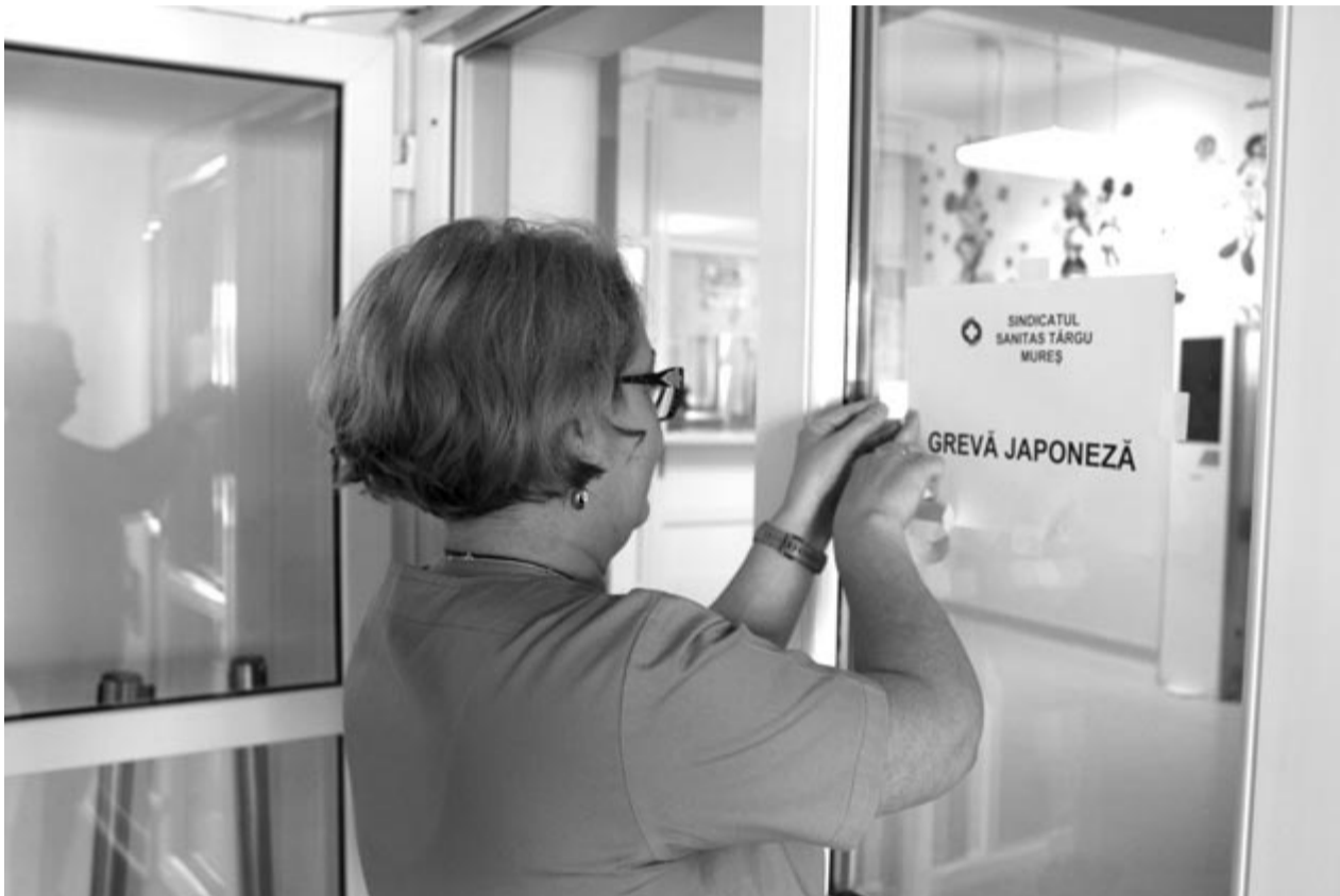
Japansztrájkba léptek a Maros megyei sürgősségi klinikai kórház szakszervezeti tagjai is

Alexandru Rafila egészségügyi miniszter szerdán kijelentette, keresik a megoldásokat, hogy megelőzzék az általános sztrájk kirobantását az egészségügyben.