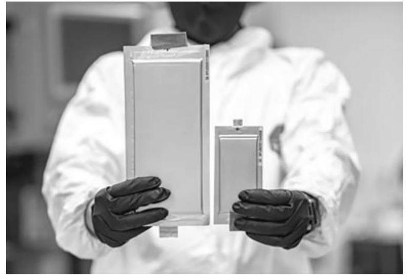
Mennyivel kisebb akkumulátor kell ugyanannyi energiához?

Mielőtt viszont nagyon elkezdjük beleélni magunkat, azt is látni kell, hogy a Ganfeng már 2021 végén bejelentette az első generációs SSB-ket, sőt még egy villanyautót is bemutatott, amelyet állítólag ezek a cellák hajtottak. Közel két évvel ezelőtt a vállalat azt állította, hogy az akkumulátorai 260Wh/kg energiasűrűséget érhetnek el, ami csaknem egyenlő a kereskedelmi forgalomban kapható lítiumion-cellákkal. Akkori elmondásuk szerint a második generációs akkumulátorban lítiumfém-anódot terveznek használni, amivel elérhetik a 400Wh/kg energiasűrűséget. Ha ez sikerülne, csaknem a duplájára tudnák emelni egy elektromos autó hatótávolságát úgy, hogy a súly nem változna. Merthogy ez is egy komoly szempont, a nagyobb