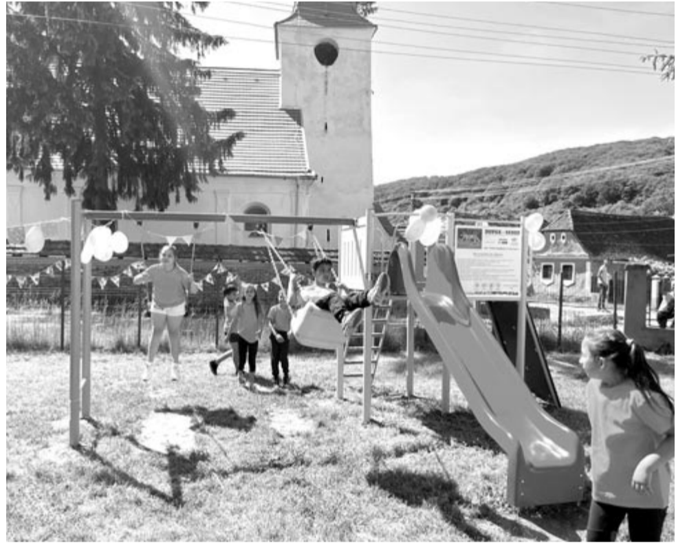
Mindenkinek jár az esély és az öröm – Ravában hétfőn tartottak játszóteravatással egybekötött gyermeknapot

Ennek a napnak és a szerdai programoknak nemcsak a helyi (és környékbéli) gyerekek örültek, hanem a vicei szövőgyár kollégiumban élők közül is több mint tucatnyian. A Beszterce-Naszód megyei intézmény gyerekeit támogató Maros megyei személyek meghívására tizennégyen érkeztek Nyárádszeredába, ahol a református egyház közöset és Bocskai István szobrát is megismerhették, játszhattak zongorán, játszóteren