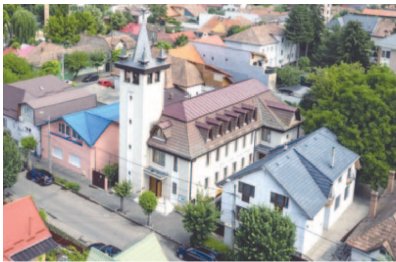
31 éve épült fel a templom

Marosvásárhelyen jelenleg tíz református egyházközség működik. A Szabadság úti az alapítás sorrendje szerint a hetedik. A reformáció több