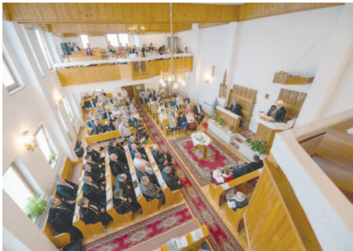
A felújított templom