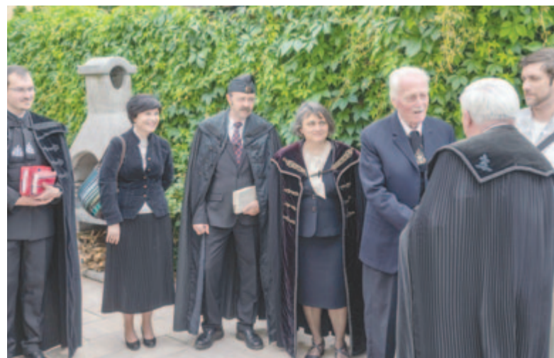
A gyülekezet volt lelkészeit köszönti Kató Béla püspök