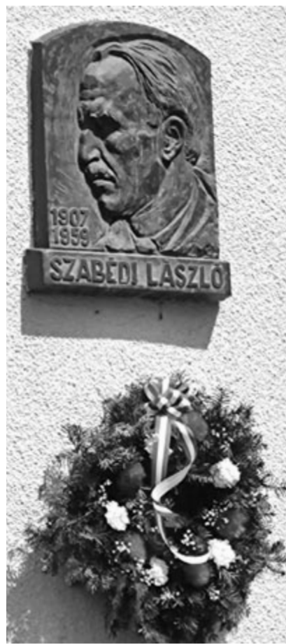
A templom falán a Szabédi-feldomborművet minden évben megkoszorúzzák

Születésének 116., halálának 64. évfordulóján a tiszteletére vasárnap Szabédon megkoszorúzták a templom falán a feldomborművet, míg múlt pénteken az Erdélyi Magyar Közművelődési Egyesület koszorúzott a Szabédi-emlékház falán levő emléktáblánál, valamint a Házsongárdi temetőben található sírjánál, ahol Kovács István unitárius püspök mondott beszédet, ezt követően műhelykonferenciára és kerekasztal-beszélgetésre került sor.