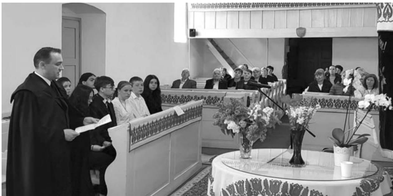
Vasárnap a szabédi templomban is emlékeztek Szabédira