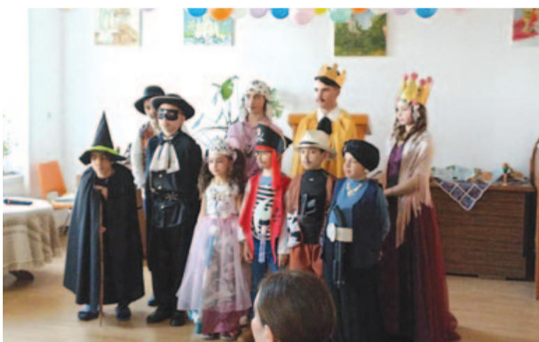
Farsangi öltözetben a bentlakás

Bár attól tartva, hogy olyan időket élünk, amikor a háború okozta infláció miatt mindenkinek nehezebbé vált az élete, múlt év december 12-én tettük közre kérésünket, amelyben támogatást kerestünk, hogy a Nagysármáson működő magyar szóróvízkollégium fűtését és meleg vízzel való ellátását biztosító gázkazán cseréje megvalósulhasson.