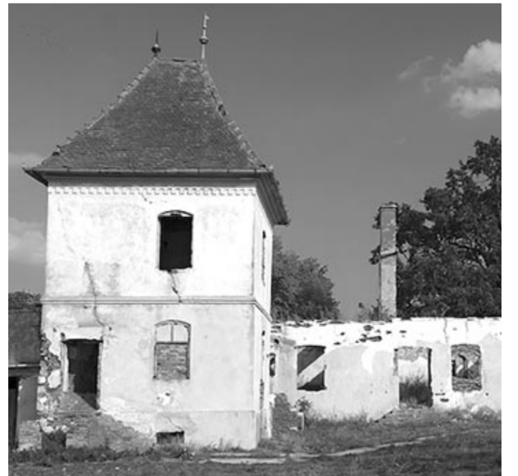
A Kemény-kúria romjai

Sorozatunk következő részét A rajongókkal folytatjuk.