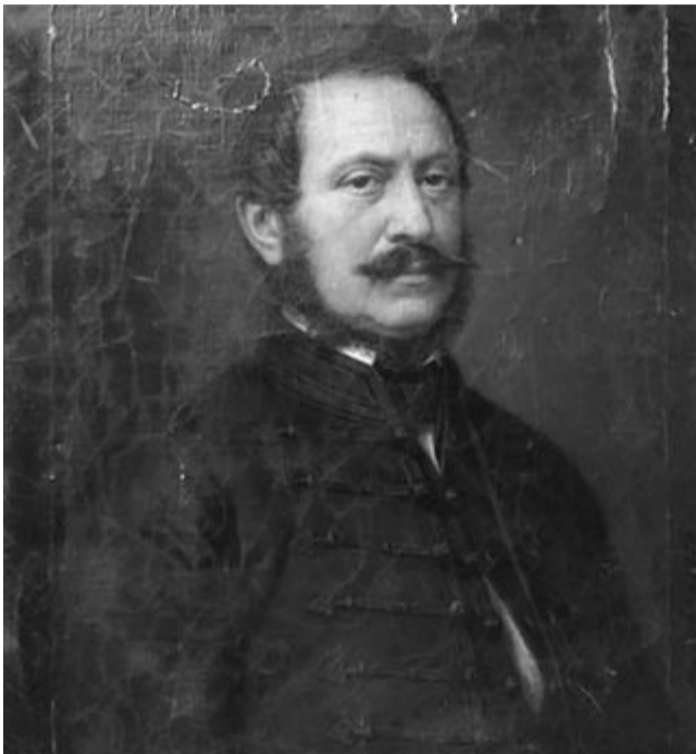
Kemény Zsigmond – Barabás Miklós festménye

Belülről ismeri a jobbgyékérdés megoldatlanságában és a nemzetiségek egymásnak feszülésében rejlő veszélyeket. Fél