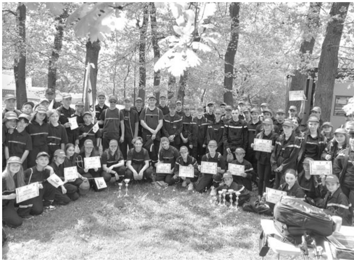
A szeredai és remetei iskolás csapatok múlt pénteken hat serleget szereztek

Az év első részét már sikerként könyvelhetik el, hiszen a tavalyinál is jobb eredményeket értek el a megyei versenyeken – értékelte a Nyárádszeredai Önkéntes Tűzoltók Egyesületének elnöke. Már egy ideje felvetette a működő nyárádmenti önkéntes tűzoltóknak, hogy mennyire fontos volna az utánpótlás képzése, hogy időben át tudják adni egy új nemzedéknek a stafétát, és a tavaly nyári ifjúsági tábor során fogalmazódott meg az is, hogy a szeredaiakon kívül más nyárádmenti csapatoknak is részt kellene venniük a megyei versenyeken. A szeredai alakulatnak évek óta aktív ifjúsági csapata van, az elmúlt években és a tavalyi táborban számottevő tapasztalatot halmoztak fel, és ez meg is látszott az idei verseny eredményein. Továbbá a szeredaiak vállalták, hogy a felső-nyárádmenti gyerekcsoportok képzésébe is besegítenek, idén voltak is már közös gyakorlataik, de mivel a versenyről csak két héttel ezelőtt értesültek, a csíkfalvi és nyárádmagyarósi gyerekek nem vállalták ezt a versenyt. A remetei és gálfalvi gyermekek először vettek részt, és nagyon jól szerepeltek. A megyei versenyeknek van súlya, van egyfajta nyomás is, a gyerekekben ott a bizonyítási vágy, hiszen készültek ezekre – értékelte Kacsó István parancsnok. Nagyon sok dicséretet kaptak a hivatásos tűzoltó bíráktól, látszik, hogy szakmai tudással rendelkező, összeforrott, lelkes fiatal csapatokról van szó.