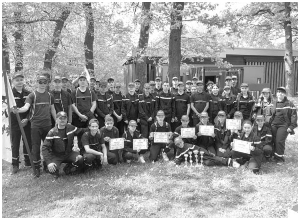
A szeredai ifjúsági csapat már komoly tapasztalattal rendelkezik, tavaly is, idén is jeleskedett a megyei versenyen

A múlt hét végi megyei versenyeknek nagy tétje van: júliusban szervezik az iskolai csapatok országos versenyét és háromnapos táborát, ahol két nyárádmenti csapat fogja a megyét képviselni, a szeredai fiúk és a remetei lányok. Ha itt jól szerepelnek, akkor akár a jövő évben Olaszországban szervezendő világversenyekekre is kijuthatnak. Ennek tudatában még alaposabban fognak felkészülni és versenyezni a nyárádmenti gyerekek – vetette fel az elnök.