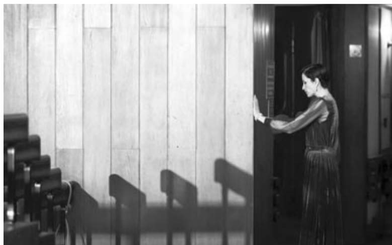
Ármány vs. szerelem