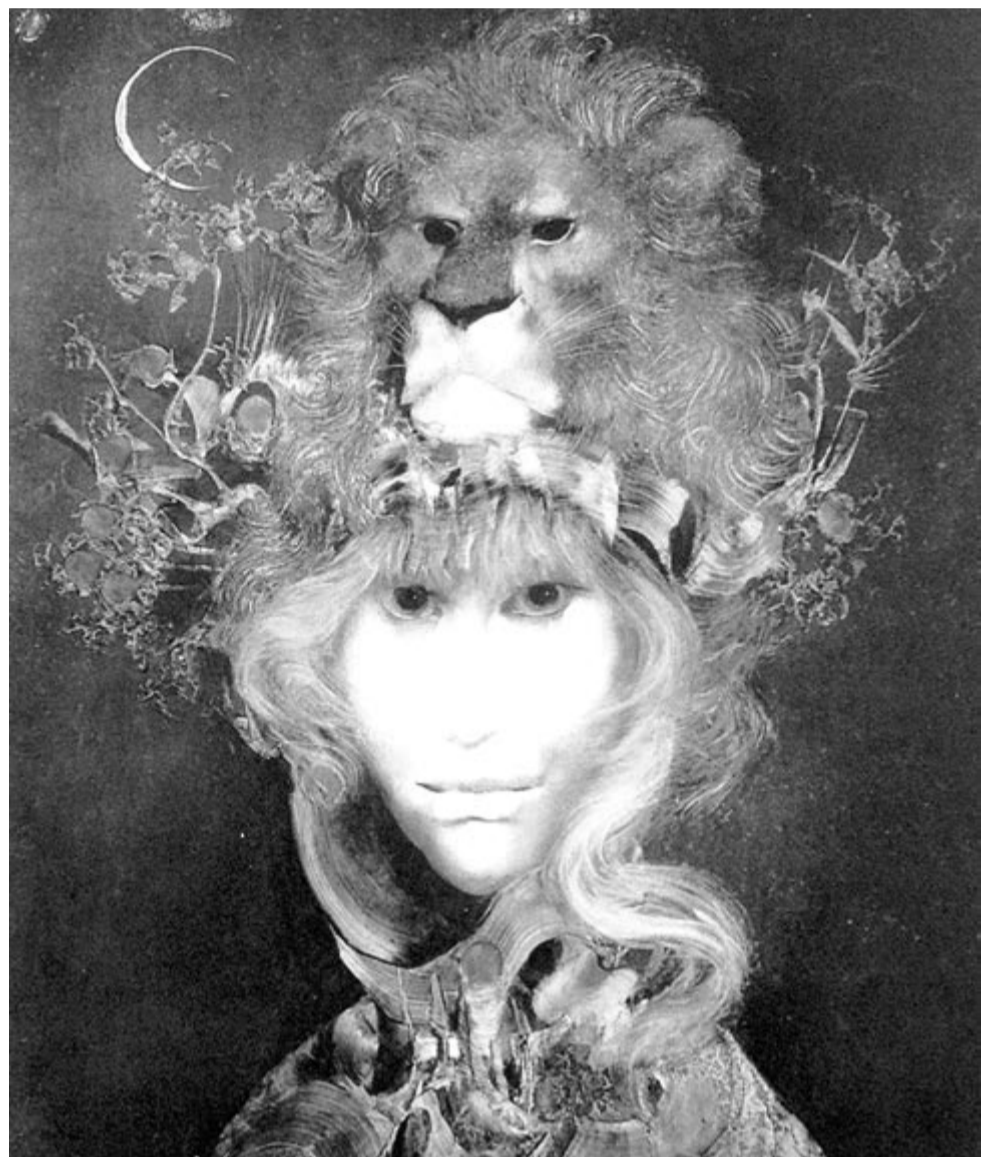
Szász Endre: Bátorosság (Május)

114 éve, 1909. május 11-én született a vajdasági Zomboron a Déry Tibor-díjas költő, író szerkesztő, műfordító. Elhunyt ugyanott 1995. január 29-én.