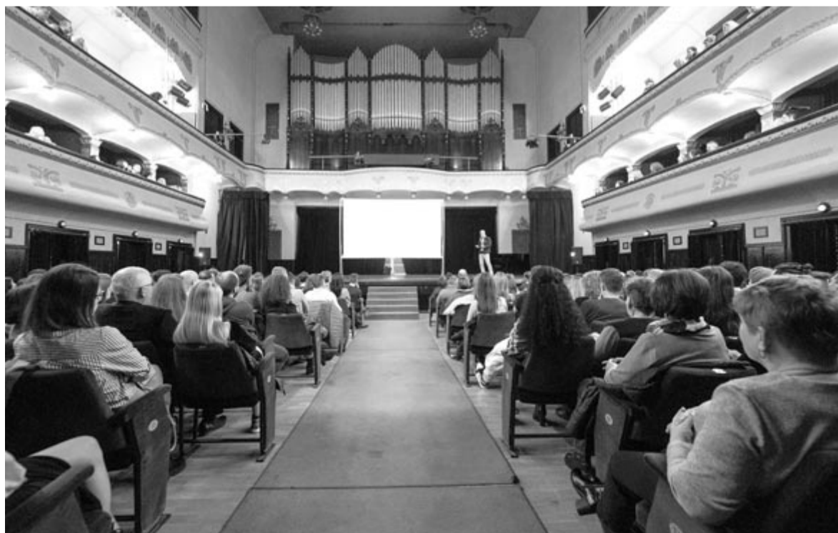
Teltházás előadás és feszült figyelem