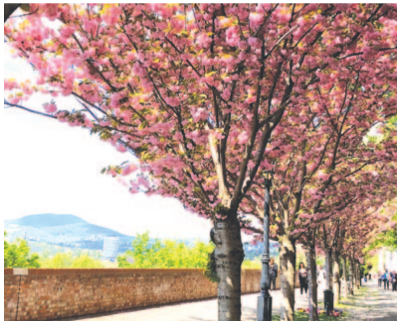
Sakuraünnep a budai vár Tóth Árpád sétányán

Magányos madárka, eljött az este, Hová vezetnek most a csillagok? Te nem tehetsz arról, hogy a szívedben Milyen lemondó vágy ragyog.