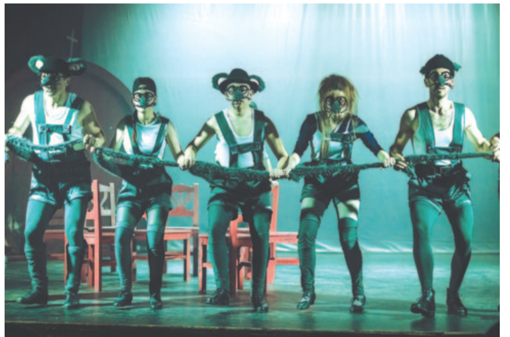
Élvezetes darabbal, néptánckomédiával áll elő a Bekecs