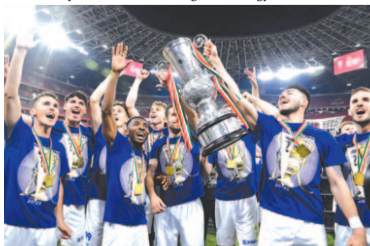
A győztes zalaegerszegi csapat ünnepel a tróféával

A Zalaegerszeg hosszabbításban 2-0-ra legyőzte a Kupa szerdai döntőjében a budapesti Puskás Arénában másodikztályú Budafokot a labdarúgó MOL Magyarban.