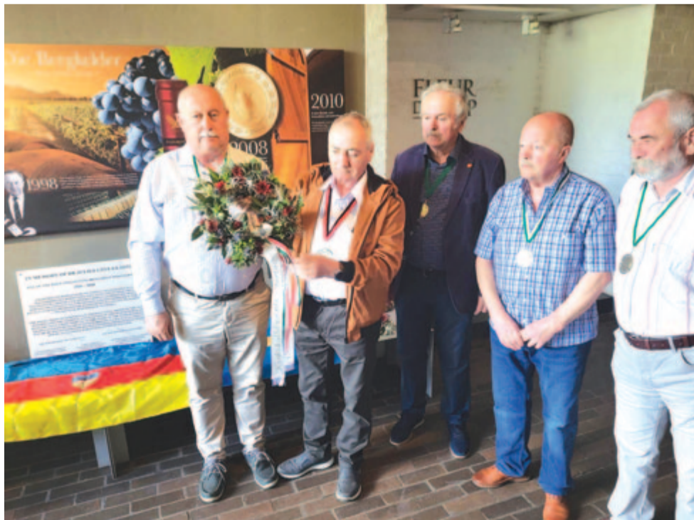
A Kis-Küküllő Borlovagrend küldöttsége