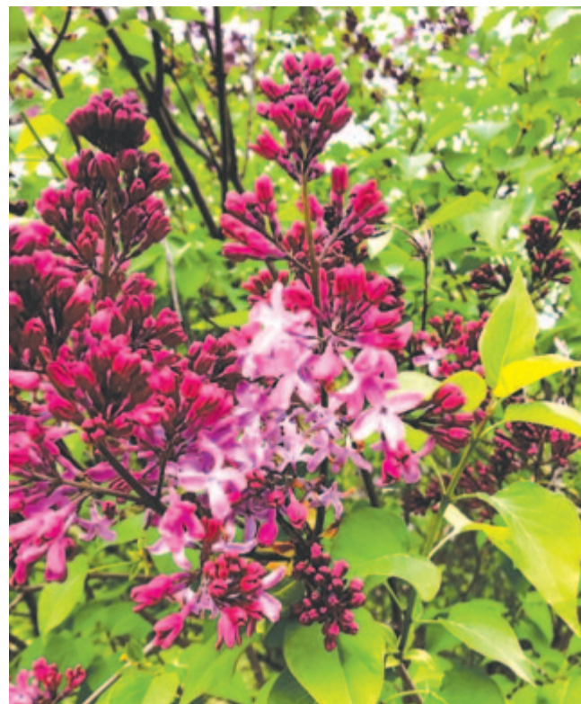
Májusi jóslat friss orgonaággal

Nézzétek, itt jön ő – a nagy hatalmú földlakó! A réten minden kis, fakó Fűszál kívánja, remegve várja. A kagyló-kürt szavától zeng az istenek hona,