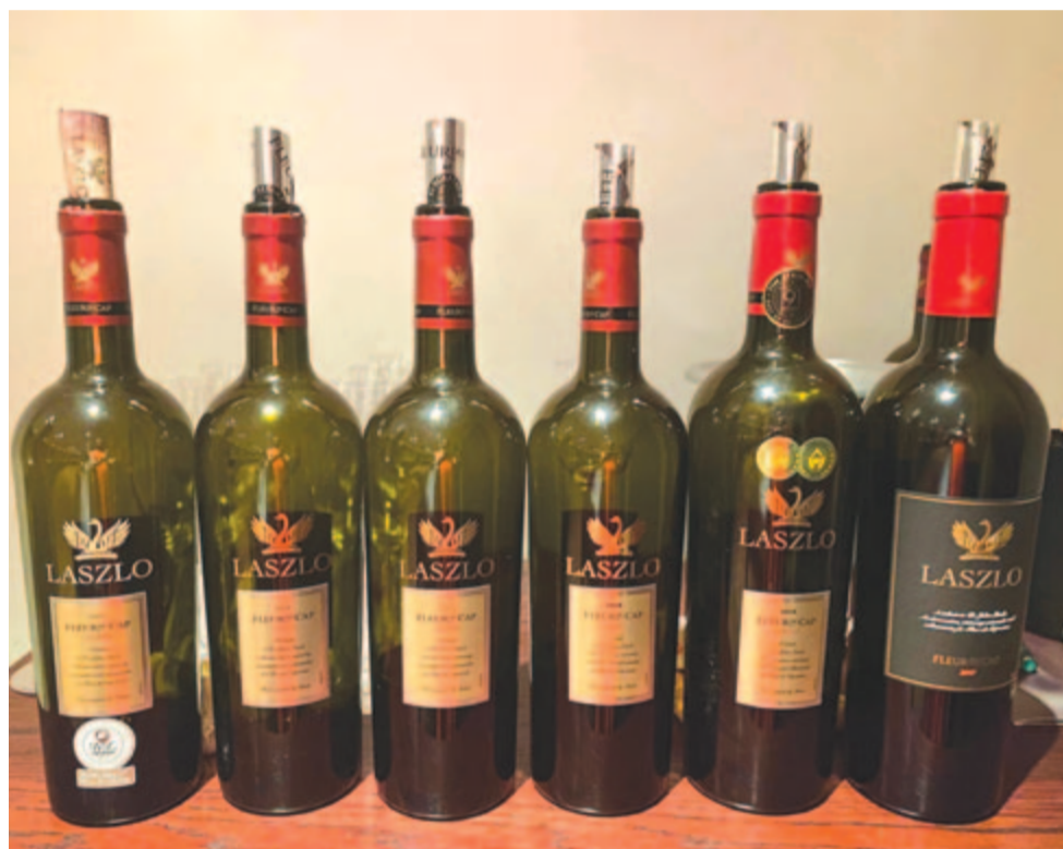
A híres László-borok

– Óriási munkát végzett, nagy szőlőültetvényeket telepített, kiválasztotta azokat az új fajtákat, amelyek az ottani klímának és ta-