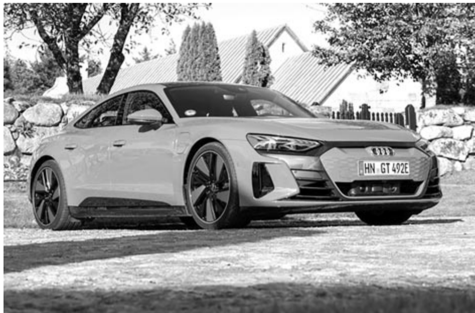
Audi E-tron GT, illusztráció

A mellett a tény mellett sem lehet elmenni, hogy az Audi már a bejelentés előtt elkezdte az átszámozást. Gondoljunk csak az E-tronnak hívott nagy SUV-ra, amelyből a frissítés után Q8 E-tron lett. A következő villanyhajtású modell a hírek alapján a Q6 E-tron nevet fogja viselni, ez szintén egy SUV lesz, feltehetően közepes méretű. Egyedül a sportos kupé, az E-tron GT nem kap számot, legalábbis egyelőre.