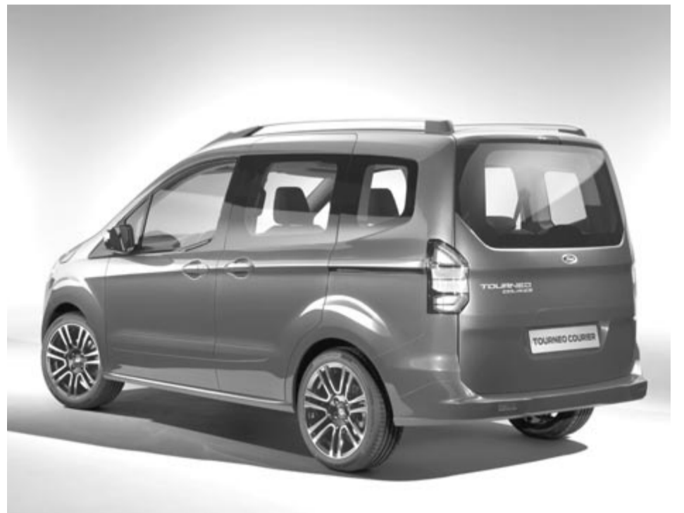
Ford Tourneo Courier