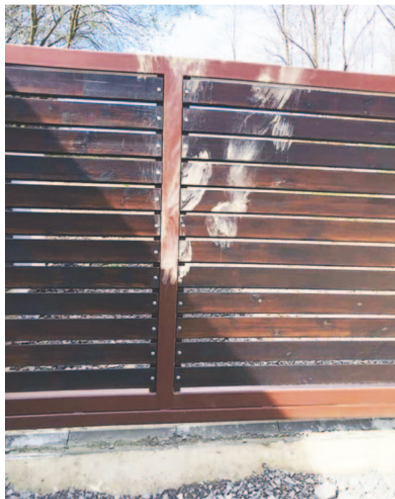
Felmásznak az autóra, és a kerítésen is átjutnak

Kerítésben okoztak már kárt, ezeket az eseteket a tulajdonosok néha jelentik a polgármesteri hivatalban, de ritkán kérnek kártérítést. Pedig ezekben az esetekben is kártérítést kellene kérni, iratesomót összeállítani, és ezért is járna az államtól kártérítés. Ám a lassú és kö-