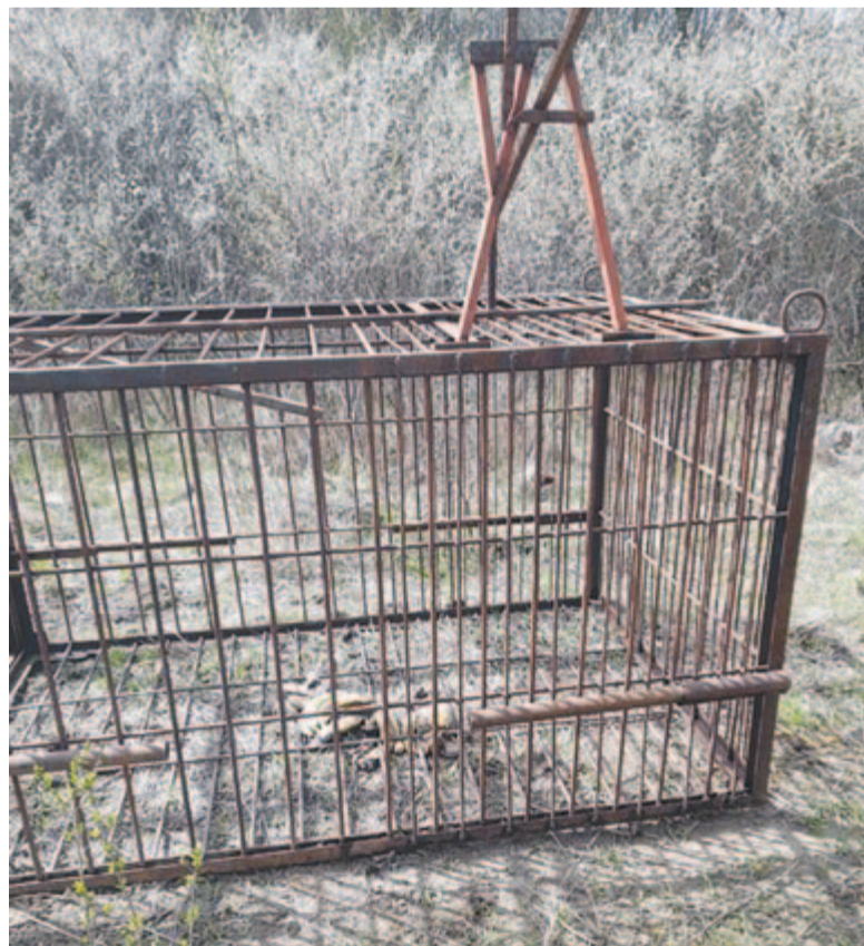
A koronkai önkormányzat kelepccét állított, de még nem sikerült megfogni őket