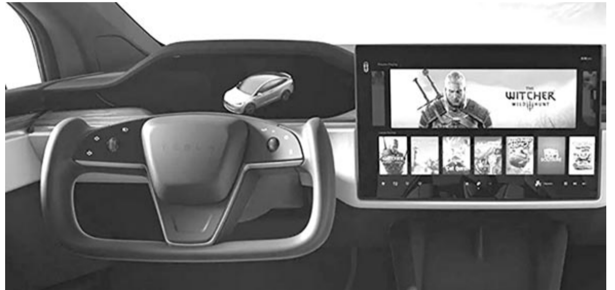
A Tesla szarvkormányja

tehát mindegy, milyen az alakja. Es itt jött a bökkenő, mert hiába ígéri Elon Musk a teljes önzvezetést minden alkalommal két évvel későbbre, az nem akar elérkezni. E tény, az egyre növekvő vásárlói elégedetlen-