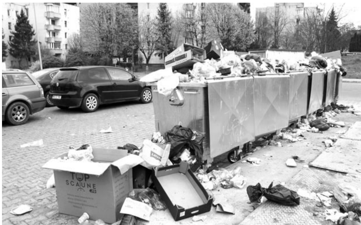
Visszatérő látvány lesz?

A kérdés továbbra is fennáll: miért nem küldtek eleve meghívót azoknak a cégeknek, amelyek kellő komolysággal birkóznának meg Marosvásárhely és környéke köztisztasági feladataival?