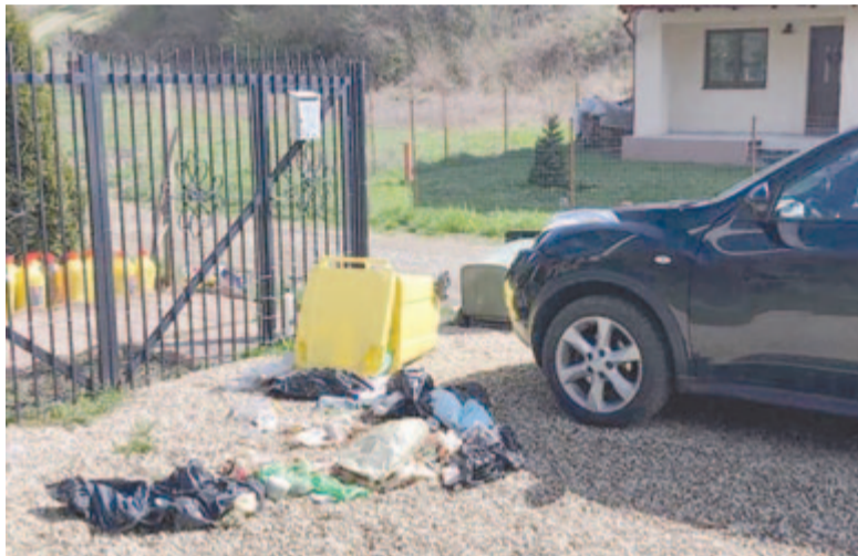
Élelem után kutatva bejárnak a kukákra