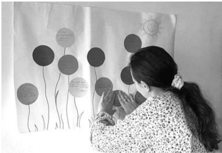
A hOrizontos kedvezményezettek személyes mottói