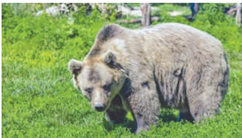
Lassan az életü(n)k részévé válik?

A község vezetője pontosítani kívánja, hogy nem állandó jelenlétről és nem „terrorról” van szó, ahogy egyesek állítják, a medvék időnként jelennek meg a lakott területen és a községben. Helyváltoztató életmódjuk miatt nem lehet kijelenteni, hogy ezek az állatok Koronkán élnek, mert a környező községekben is felbukkannak: Ákosfalván, Nyáradkarácsonban, Backamadaras, Jedden és Marosvásárhelyen is. Időnként itt-ott megjelennek a településen, majd továbbállnak, egy idő múlva pedig visszatérnek. Például Koronkában is megfordult az az anyamedve, amelyet nemrég Marosvásárhelyen befogtak, de a karácsonyfalvi határban is látták azt, amelyik Koronkában is mutatkozott. A községet is magába foglaló vadászterület vadőre szerint 10-12 medve kószál a környéken. A település különböző pontjain bukkanak fel időről időre, Székelybósban is, a két falu közötti lovas tanyára is