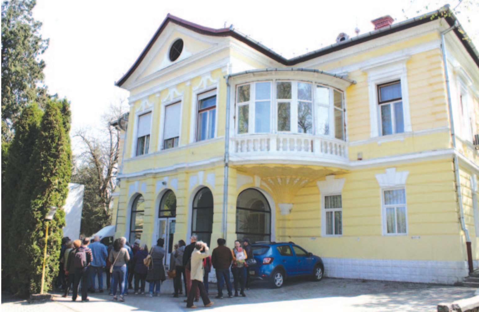
A Trébely utcai Bernády-villa