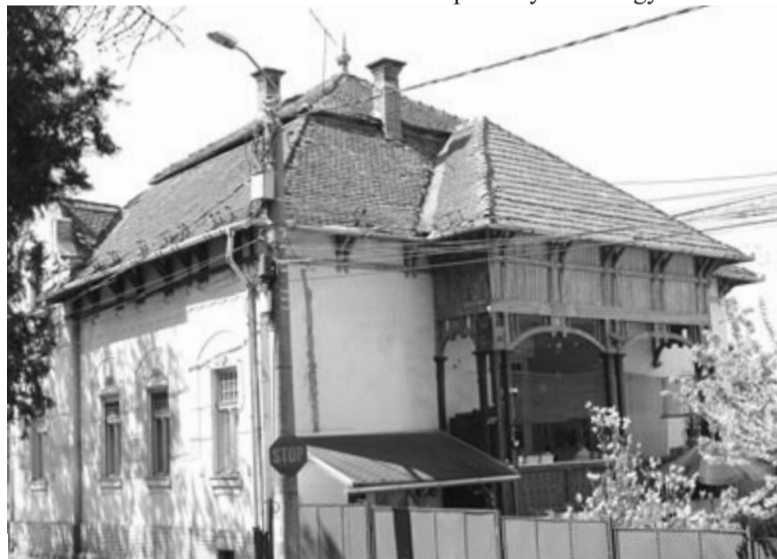
A Toroczka Wigand Ede építette Bernády-ház

A Bernády alakja köré szervezett második séta délután a Kultúrpalotától indult. Orbán János és Jeremiás István ekkor a közismert megvalósítások – a palota, a Városháza, a Kereskedelmi és Iparkamara, a Városházával szembeni polgári lakóházak – mellett a meghiúsult álmokról – egy színházépület, a Bethlen Gábor-múzeum és a régi születési park helyére tervezett vármegyeháza tervéről – osztott meg érdekes tudnivalókat a jelenlétükkel.