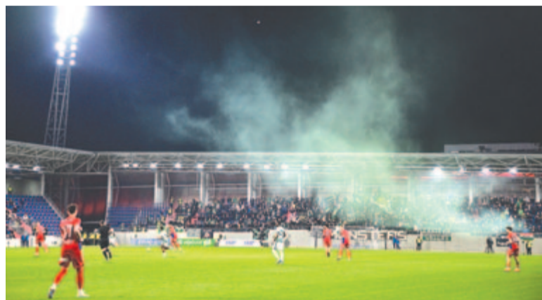
Ferencvárosi szurkolók a Vasas FC – FTC mérkőzésen

A hajrában a Vasas becsülettel küzdött az egyenlítésért, de komolyabb veszélyt nem tudott kialakítani az Európa-ligában nyolcaddöntős rivális kapuja előtt.