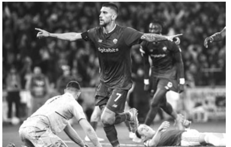
Az AS Roma a 89. percben mentette hosszabbításra a mérkőzést, aztán a hosszabbításban beindult a gólgyártás.

A hazai visszavágón a Sevilla minden idők legidősebb – 30 év és 295 nap átlagéletkorú – kezdőcsapatát küldte harcra a Manchester ellen, amelyet az elmúlt hat szezonban egyformán spanyol csapat ejtett ki az európai porondon, három alkalommal – a mostani előtt 2018-ban és 2020-ban is – éppen a Sevilla volt a „tettes”. Az andalúziai alakulat ötödször jutott be az Európa-liga elődöntőjébe, minden más együttesnél többször. Ráadásul valamennyi korábbi ilyen alkalommal – 2014-ben, 2015-ben, 2016-ban és 2020-ban – meg is szerezte a trófeát.