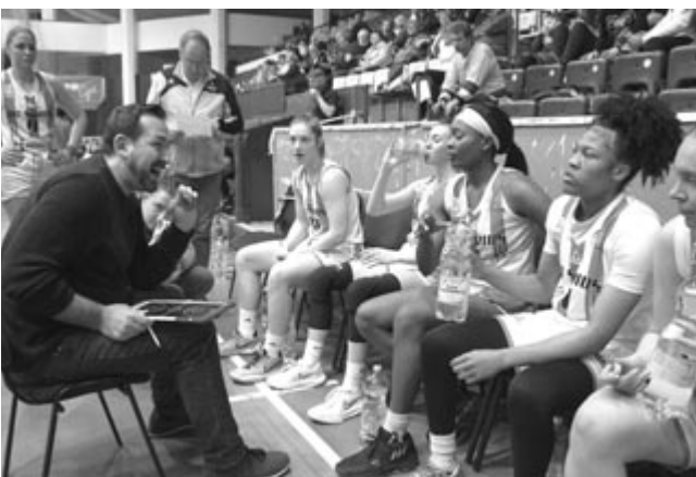
A felvétel egy korábbi mérkőzésen készült

KSE: Hawks 27 pont (3), Córdá 19 (4), Biszak 14 (2), Wilson 11, Bara Németh 6, Domokos 2, Kozman. Kispadon: Marthi, Lénárt, Nagy.