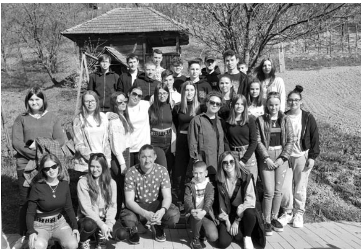
Szabédon kéttucatnyi fiatal jelent meg, ami falusi viszonylatban igen szép szám