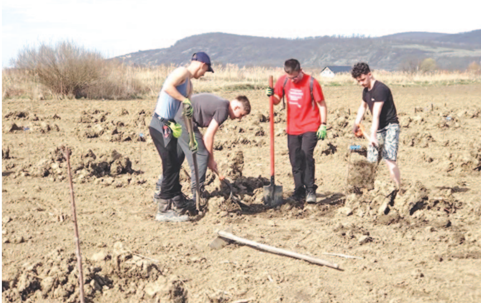
Néhány fiatal a szórakozás helyett szívesen megy segíteni a telepítésben