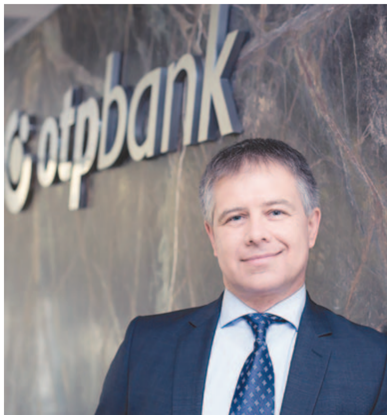
Fatér Gyula, az OTP Románia vezérigazgatója

A piacnak ezen szegmense folyamatosan növekszik, ehhez pedig a hagyományos bankok is alkalmazkodnak. Példa erre, hogy az elmúlt időszakban ők is kifejlesztették az elektronikus szolgáltatásaik teljes tárházát, illetve az áron is alapvetően változtattak. Aki napjainkban Romániában egy folyószámlát nyit, az gyakorlatilag minimális vagy semmilyen költséggel nem kell szembesülnön, húzta alá Fatér Gyula .