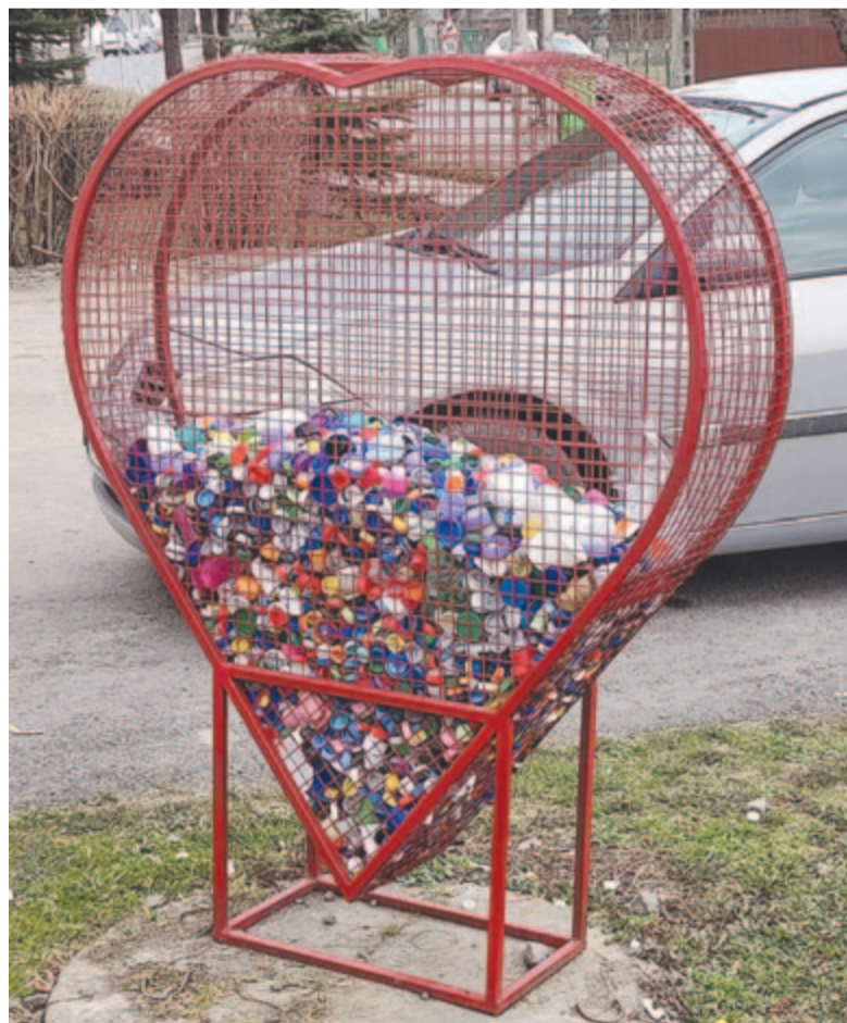
Szívesen teszik – Backamadaron szív alakú gyűjtőedényt helyeztek ki