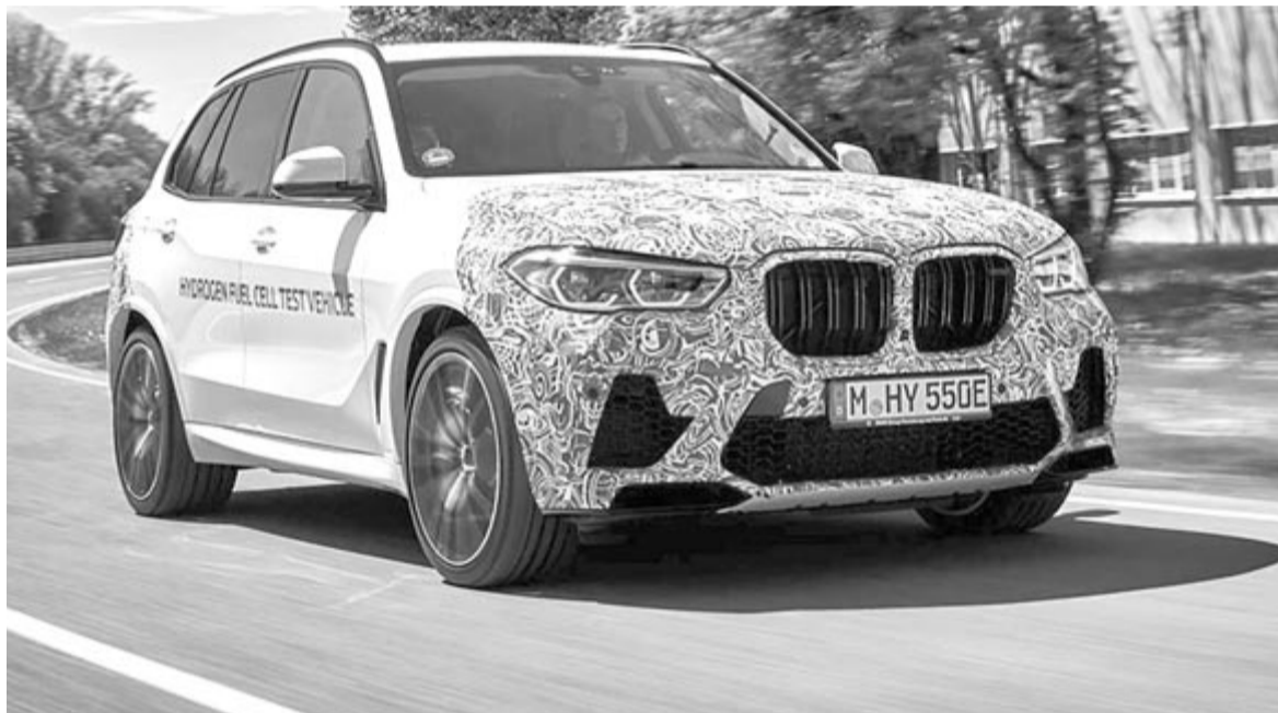
Testtüzem – hidrogénhajtású BMW

hány szépséghibája. Egyrészt nincsenek hidrogéntöltő állomások, másrészt a technológia korántsem veszélytelen, mert nagy nyomású tartályok vannak a kocsi alatt, ami robbanásveszéllyel jár, harmadrészt azt az elektromos áramot, amit a hidrogén cseppfolyósítására hasz-