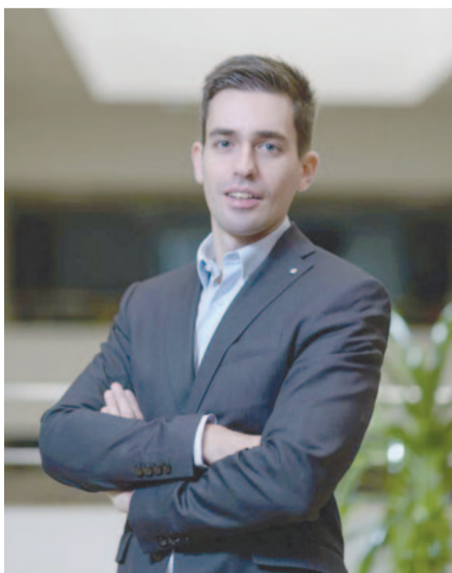
Dr. Szász Levente közgazdász

Az ENSZ úgy fogalmazott, hogy válságok összefolyásában élünk, ami mind a magánemberekre, mind a vállalatokra hatással van. Jelenleg mindkét csoportot kihívások elé állítja a gazdasági helyzet, és bár bizonytalan a jövő, az előrejelzések a helyzet javulását vetítik