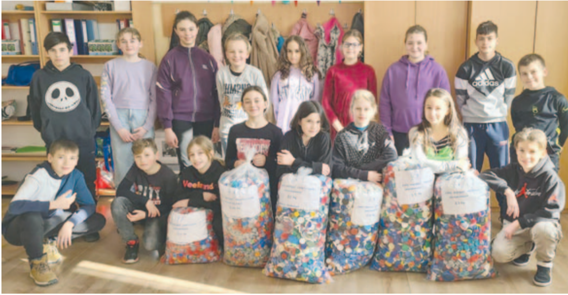
A pedagógusok hozzáállásának köszönhetően megynkben is nagyon népszerű lett az akció az iskolások körében

Maros megyéből is számos óvodai és iskolai csoport kapcsolódott be a legutóbbi akcióba, csak a marosvásárhelyi Stefánia óvodában például szinte fél tonna kupak gyűlt össze, de a versenyhirdetés szerint az óvodai csoportok között a megyeközponti intézmények mellett ott jeleskednek az ákosfalviak, kelementelkiek, búzásbesenyőiek,