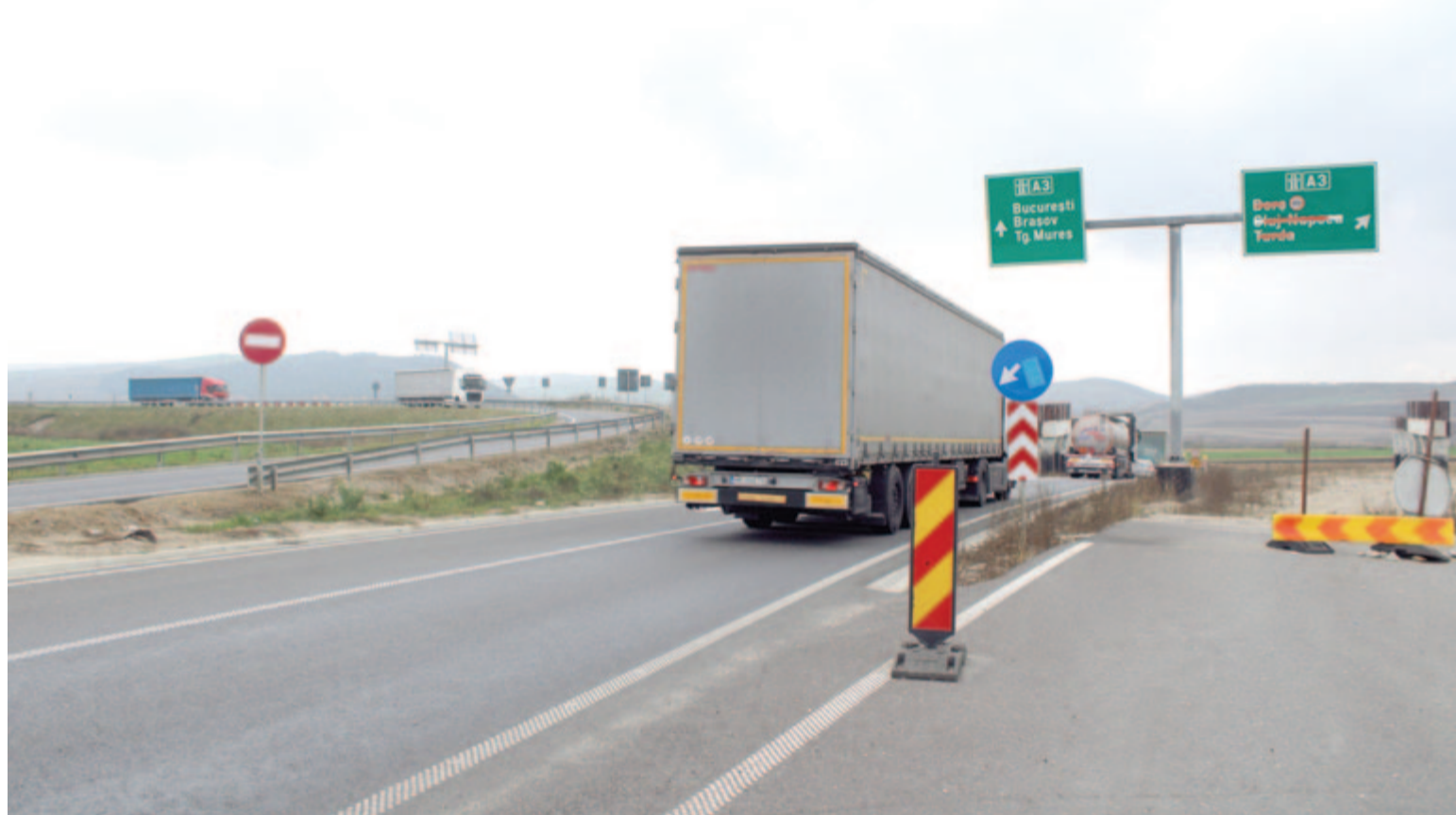
Az autópálya kellemetlenséggel is jár a helyieknek, de gyorsabb és biztonságosabb közlekedést tesz lehetővé