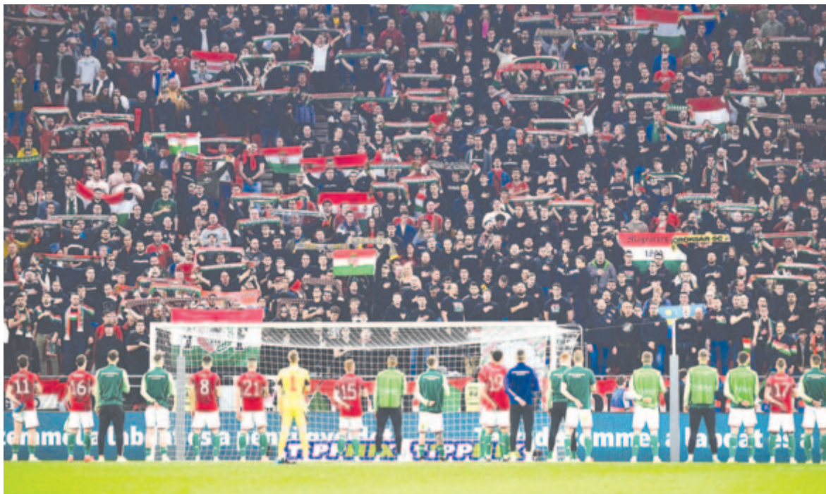
A magyar válogatott játékosai a Himnuszot éneklék a szurkolókkal a Magyarország – Észtország felkészülési mérkőzés után a Puskás Arénában 2023. március 23-án. A magyar válogatott 1-0-ra nyert

„Akkor vagyunk sikeresek, ha csapatként alázatosan állunk a találkozóhoz. Ahhoz, hogy nyerjünk, százszázalékosan ott kell lennünk fejben és hozzáállásban, mert hiába győztük le Angliát kétszer is, tudjuk, hogy nem azon a szinten vagyunk – jelentette ki Rossi, aki elismerte, hogy az elmúlt évek