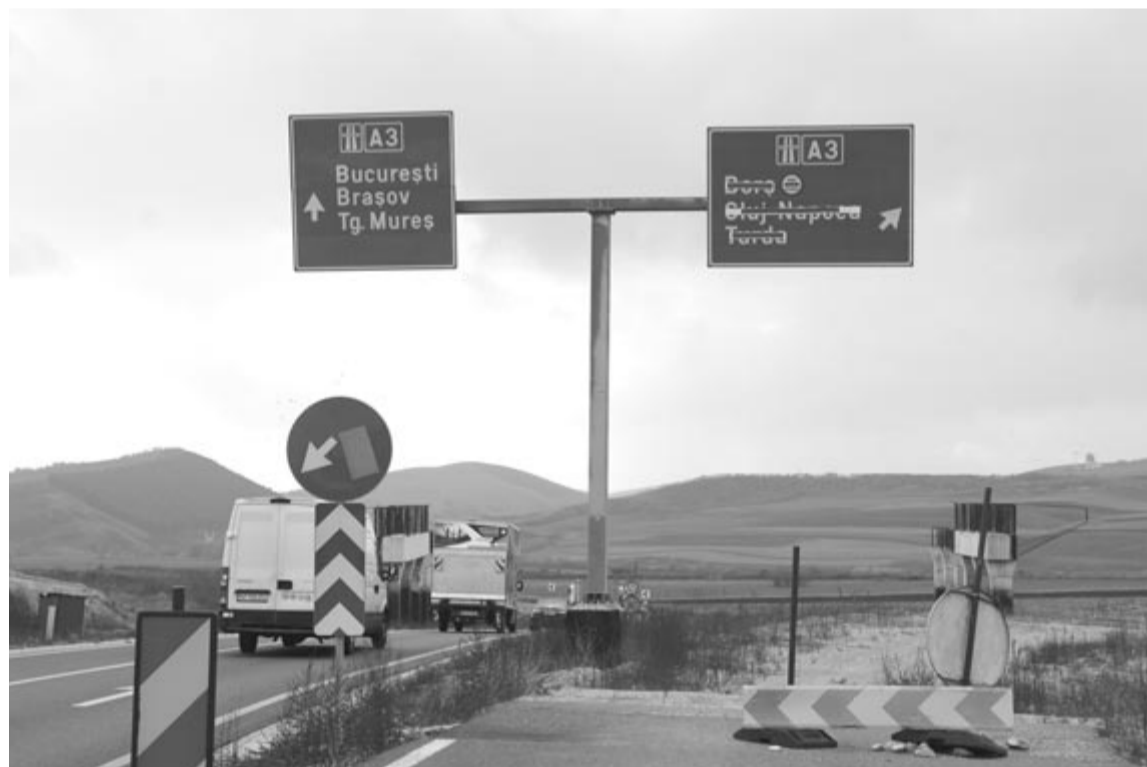
A helyiek remélik, hogy az autópálya mentesíti a nehézforgalom alól az Ákosfalva és Nyáradtő közötti falvakat.

A fentebbi kellemetlenségeken, valamint az építkezéssel járó változásokon és új szabályozásokon túl a helyiek pozitív hozadékban is reménykednek. Nyáradkarácson előjárója szerint legalább annyi haszna lesz a községnek a sztrádaépítésből, hogy a nehézforgalom kikerül a megyei útról, illetve a falvakból. Ákosfalva vezetője is meg van győződve arról, hogy az ország nyugati részébe tartó tranzit- és nehézforgalom alól mentesülni fognak a falvak, ám a Szászrégen és Beszterce irányába haladó forgalom ezután is Ákosfalván és Koronkán fog áthaladni Marosvásárhely irányába, és a megyeközpont sem mentesül teljesen a nehézforgalomtól az autópálya megépítésével. Ami a községbelieket illeti, nekik már most is három lehetőségük van a megyeközpont megközelítésére (Koronka, Hagymásbodon és Nyáradtő irányában), így az ő közlekedési szokásaikat nem fogja különösebben befolyásolni az autópálya.