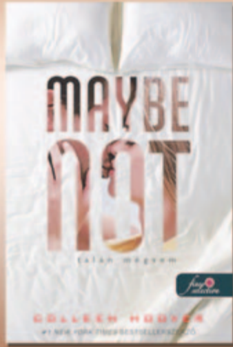
Colleen Hoover Talán mégsem