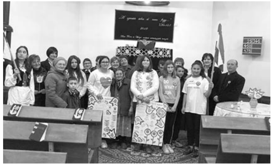
A Mezőség szélén még fontosabb ünnepelni, ragaszkodni értékeinkhez