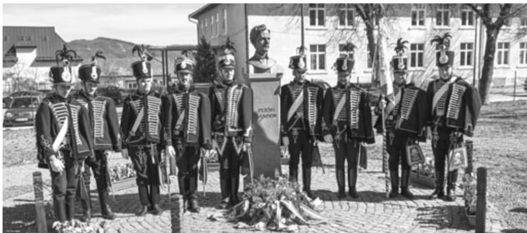
Méltón emlékeznek ezután az erdőszentgyörgyiek, régi álmuk volt a Petőfi-szobor.