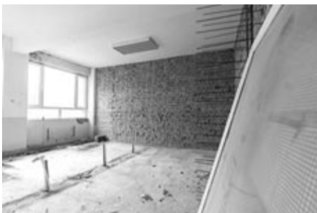
A bel- és külkapcsolati osztály

A tanulókat ideiglenesen a Traian Săvulescu Mezőgazdasági Főgimnázium által biztosított helyiségekbe, valamint a Serafim Duicu Általános Iskola B épületébe költöztették át.