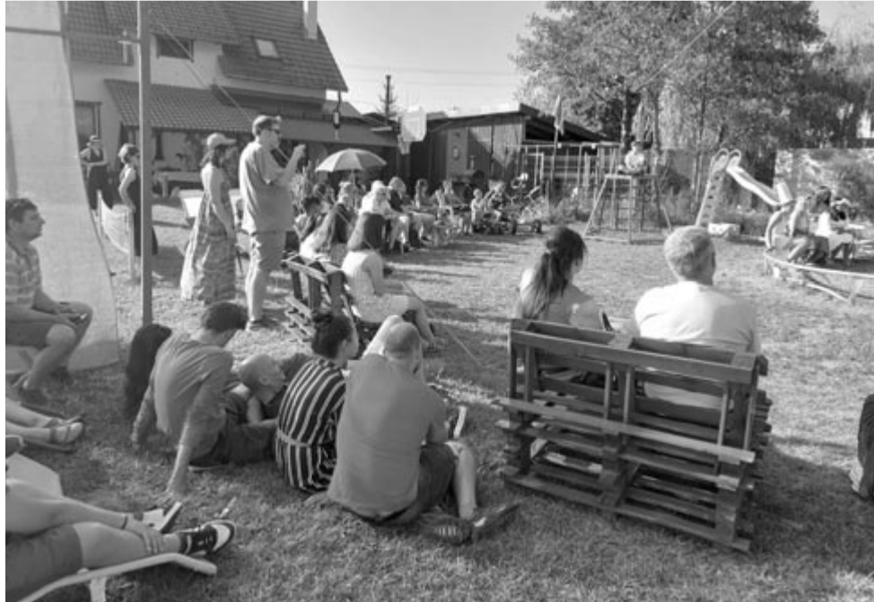
Idén visszaköltözik a fesztivál a felújított Sándor-villába

A szervezők két újdonságot is bejelentettek: a 2024-es évtől a filmfesztivál részeként szabadegyetemet is tartanak, továbbá a következő évtől újabb jelentős bővítés várható a kulturális kínálati palettájukon: jazz- és komolyzenei fesztiválokkal bővül a Rengeteg!