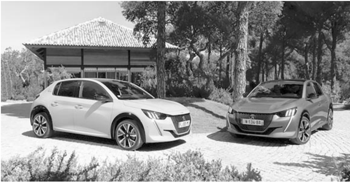
Peugeot 208, a legnagyobb számban eladott modell 2022-ben