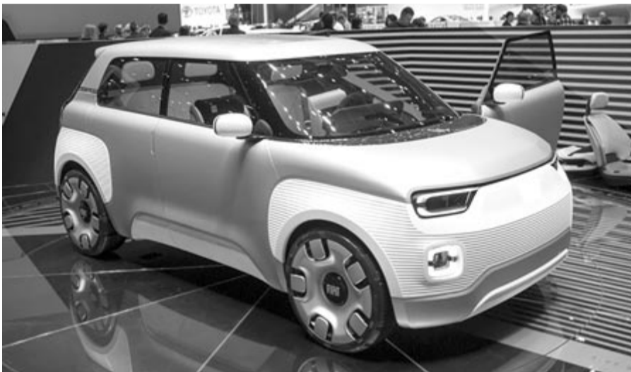
Elektromos Fiat Panda-konceptió