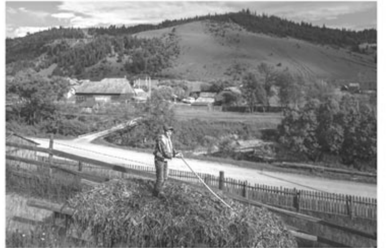
Lapunkunk 1., 3., 7., 9-16., 19., 25. és 28. oldalán Szöllősi Mátyás gyimesi fotósorozatából ábrázolták.