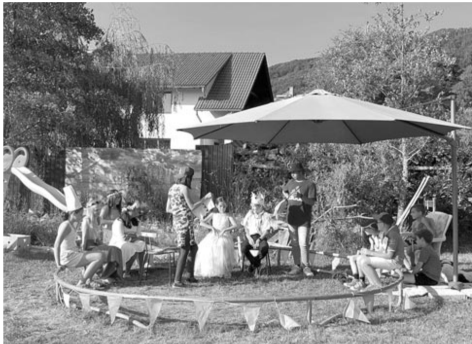
A Rengeteg fesztiválok egyik kiemelt célja az ifjúság képzése és a fiatal művészek támogatása.