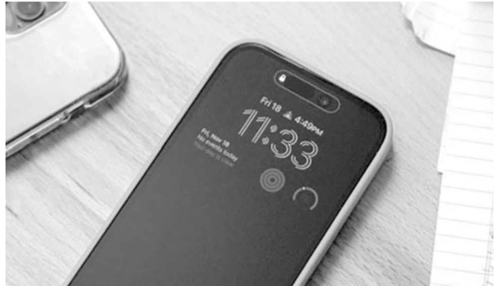
iPhone 14 Pro bekapcsolt Always-on display funkcióval

Az interneten több tesztet is lehet látni azzal kapcsolatban, hogy mennyivel merül gyorsabban egy telefon akkor, ha be van kapcsolva ez a funkció, és ha nincs. Viszont ezek csak becslések, az Apple új szoftvere azonban konkrét választ ad a kérdésre. Az új funkcióra a 9to5Mac hívta fel a figyelmet, ő fedezte fel azt az iOS 16.4 béta verziójában, hogy a beállításoknál megjelent egy olyan részlet, amely az Always-on display akkumulátorfogyasztását mutatja. Ez azt jelenti, hogy amikor ez az operációsrendszer-verzió min-