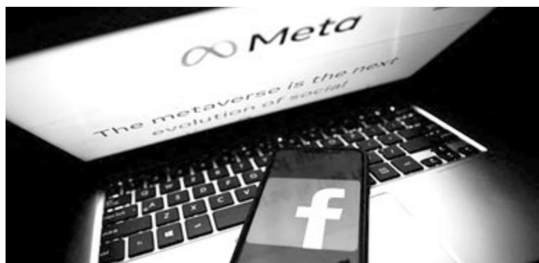
A Meta mesterséges intelligenciája, illusztráció