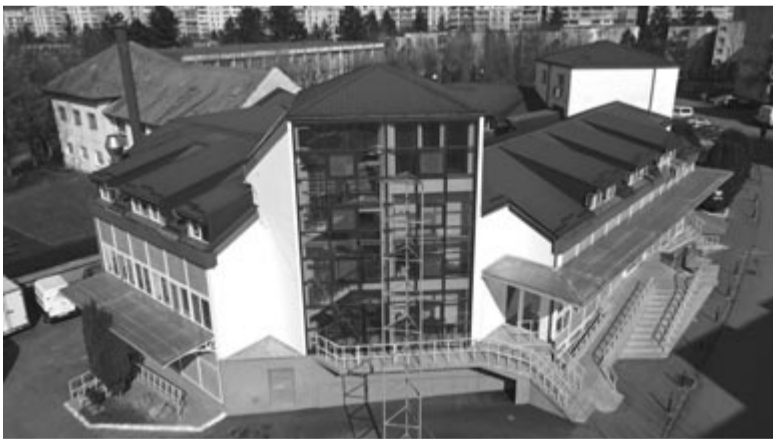
Az Alpha Transilvană Alapítvány épülete