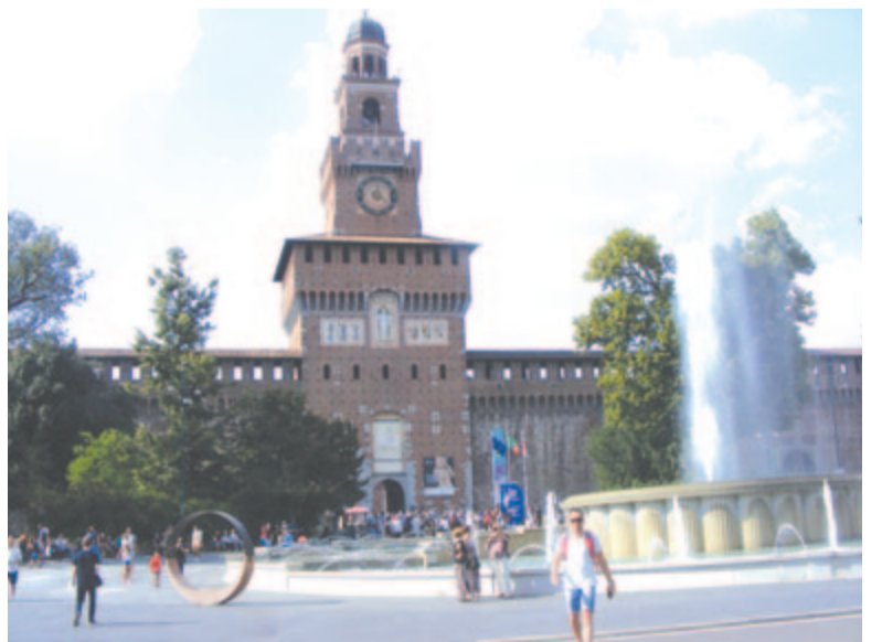
A Sforza-kastély bejárata

Jóval hajónk visszaindulása előtt elindulunk a kikötő irányába. A kikötő közelében, egy kis utcácskában lehető fel a város egyik leghíresebb épülete, amely korábban kápolna volt, és jelenleg a Modern Művészetek Múzeumának ad