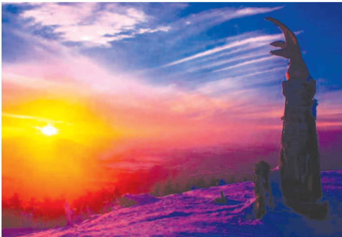
Fenyvesek zihálnak rekedten, fénypárna nő kerekdeden – télbe oltott béke

Ez a hol vérfagyasztóan realista, más-kor rajongásig pesszimista német költő néha fenségesen természeti képekkel ajándékoz meg: