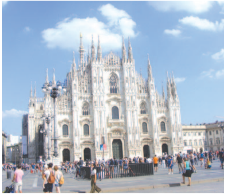
A milánói dóm