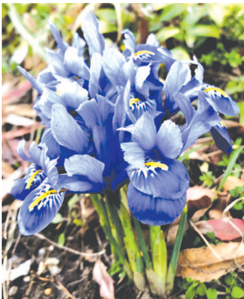
A gyámoltalan virág virulni akar – békeváró tavasz

Haragszik és dül-fül az Isten vagy csak talán alszik az égből, aluszik vagy halott is éppen – ki költi őt föl, emberek? Anyák, sírjátok hangosabban: